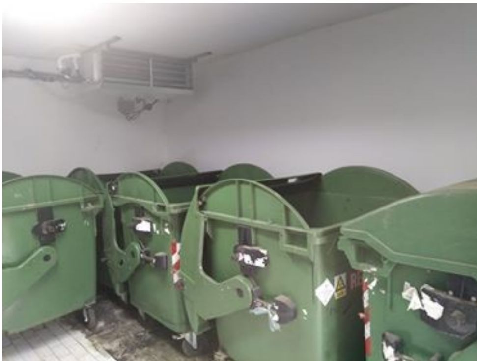
Slika 2. Regulator mikroklimatskih uvjeta u odlagališnoj prostoriji [10]

Slika 2. prikazuje kako se unutar stare mrtvačnice koja je u sklopu Opće bolnice u Koprivnici te je ista prenamijenjena za sakupljanje odnosno pričuvu zaraznog otpada do odvoza od strane dogovorene tvrtke prijevoznika – Remondis, opremljena ventilacijom te uređajima za reguliranje potrebite temperature za odlaganje opasnog – zaraznog otpada.