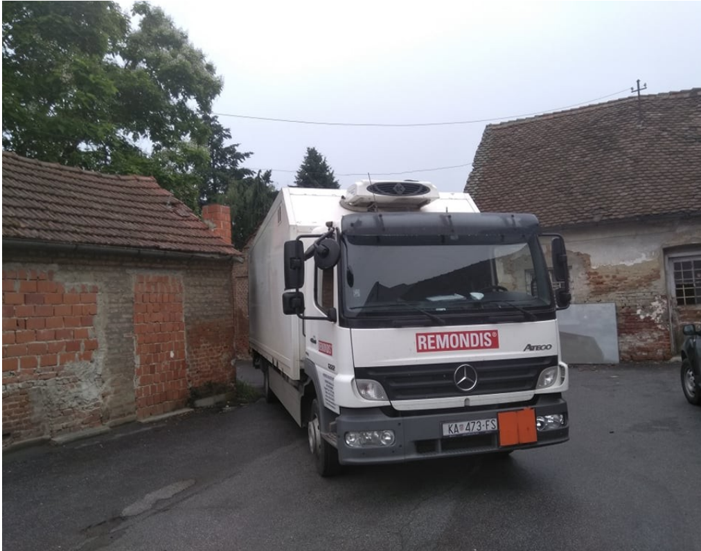
Slika 3. Prijevozno sredstvo za otpad tvrtke Remondis [10]

Prema pravilu postoji tip vozila za transport opasnog medicinskog otpada a to su: