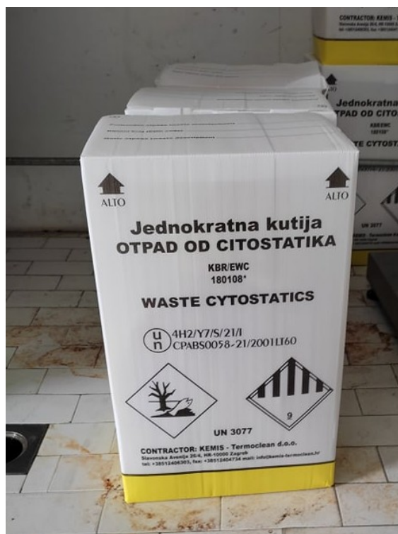
Slika 9. Kutija za zbrinjavanje citostatskog otpada [10]

Kemijski otpad zahtijeva također posebnu pažnju i odgovarajuće zbrinjavanje. Za svaku osobu koja je u doticaju sa takvim otpadom određena su načela i mjere zaštite na radu kako bi se omogućila sigurnost i zaštita zdravlja svih radnika koji mogu doći u doticaj sa istim otpadom.