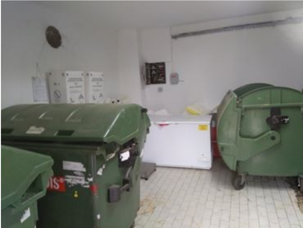
Slika 4. Unutrašnjost privremenog odlagališta opasnog otpada ustanove [10]

Slika 4. prikazuje privremeno odlagalište opasnog otpada u sklopu ustanove proučavane u ovom završnom radu. Uključujući zarazni, patološki te citostatski otpad. Koje se uredno ostavlja te redovito čisti i dezinficira. Odlagalište se nalazi pod ključem kako bi se onemogućilo zlouporaba tog privremenog odlagališta te također onemogućio ulazak ne ovlaštenim osobama.