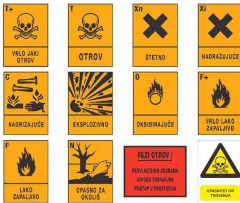
Slika 1. Piktogrami opasnog otpada [2]

Nadalje, unutar ovog završnog rada bit će objašnjena podjela vrsta otpada po svojstvima i po mjestu nastanka, te podjela kategorija otpada po skupinama. Naglašava se važnost djelatnosti gospodarenja otpadom kao zakonski neizostavnom točkom poslovanja, koju svaka ustanova ili tvrtka koja proizvodi bilo kakvu vrstu otpada, mora provoditi. Prilikom uzimanja u obzir gospodarenje otpadom jasno je da on uzrokuje i određen iznos financijskih obaveza i troškova, koje je ustanova dužna podmiriti kako bi osigurala njegovo ispravno provođenje. Otpad može preuzeti odnosno odvoziti sa mjesta nastanka sve tvrtke ovlaštene za gospodarenje pojedinim vrstama otpada, a to ostvaruju na temelju ishodne dozvole ili upisa u neki od očevidnika. Opća bolnica dr. Tomislav Bardek Koprivnica surađuje sa više različitih poduzeća koje se bave gospodarenjem otpadom, te svoj prikupljeni otpad odvoze iz područja tvrtke u suradnji s dotičnim poduzećima. Temeljem ugovora, ustanova navedene bolnice, različite vrste otpada predaje različitim poduzećima, što je također objašnjeno i razrađeno u daljnjem tekstu ovog završnog rada.