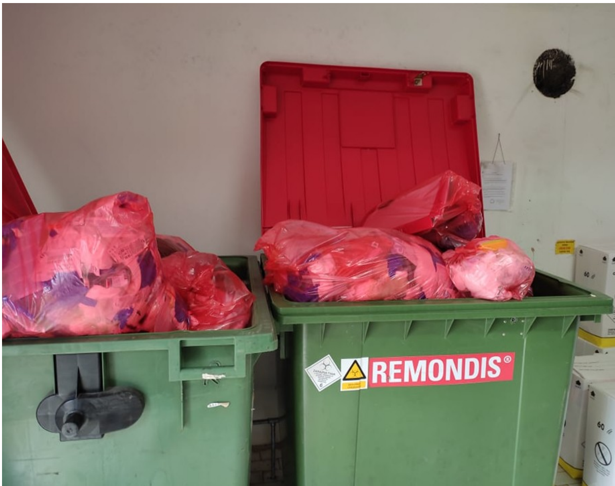
Slika 7. Zarazni otpad [10]

određenom razdoblju. Normativ je da se zarazni otpad odvozi jednom tjedno tj. Uglavnom utorkom međutim bilo je i slučajeva kad se količina otpada naglo povećala te se interveniralo dvotjednim odvozom te vrste otpada. Na Slici 7. je prikazano na koji je način pohranjen zarazni otpad u navedenoj ustanovi. Vidi se kako je to kontejner koji ima crveni poklop te da se u njemu nalaze crvene nepropusne vreće koje označuju vrstu otpada u slučaju crvene boje – zarazni otpad.