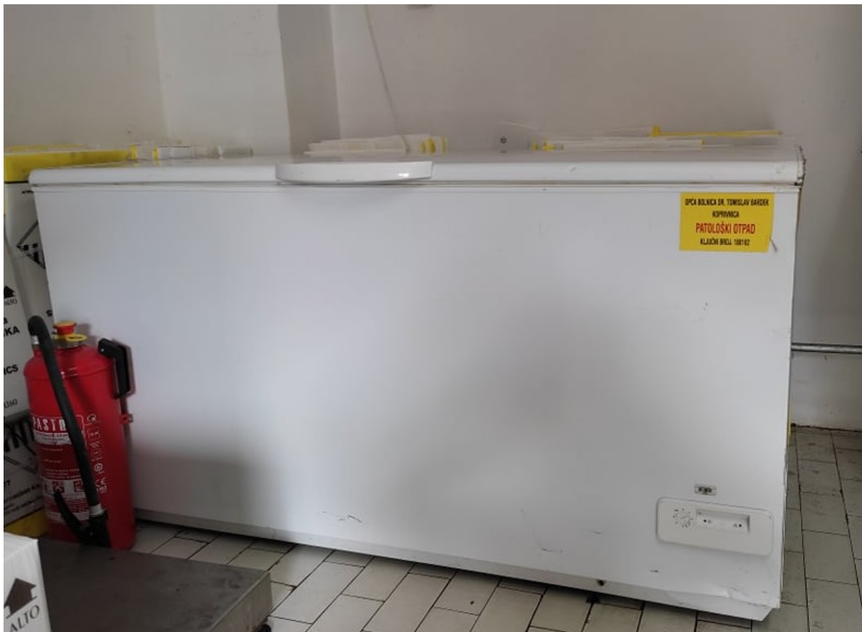
Slika 8. Spremište patološkog otpada [10]

Patološki otpad u Općoj bolnici Tomislav Bardek u Koprivnici čini 2% od sveukupnog opasnog otpada.