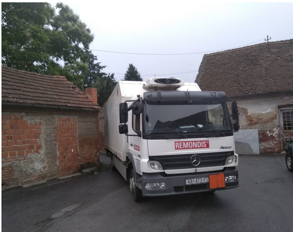
Slika 3. Prijevozno sredstvo za otpad tvrtke Remondis [10]

Prema pravilu postoji tip vozila za transport opasnog medicinskog otpada a to su: