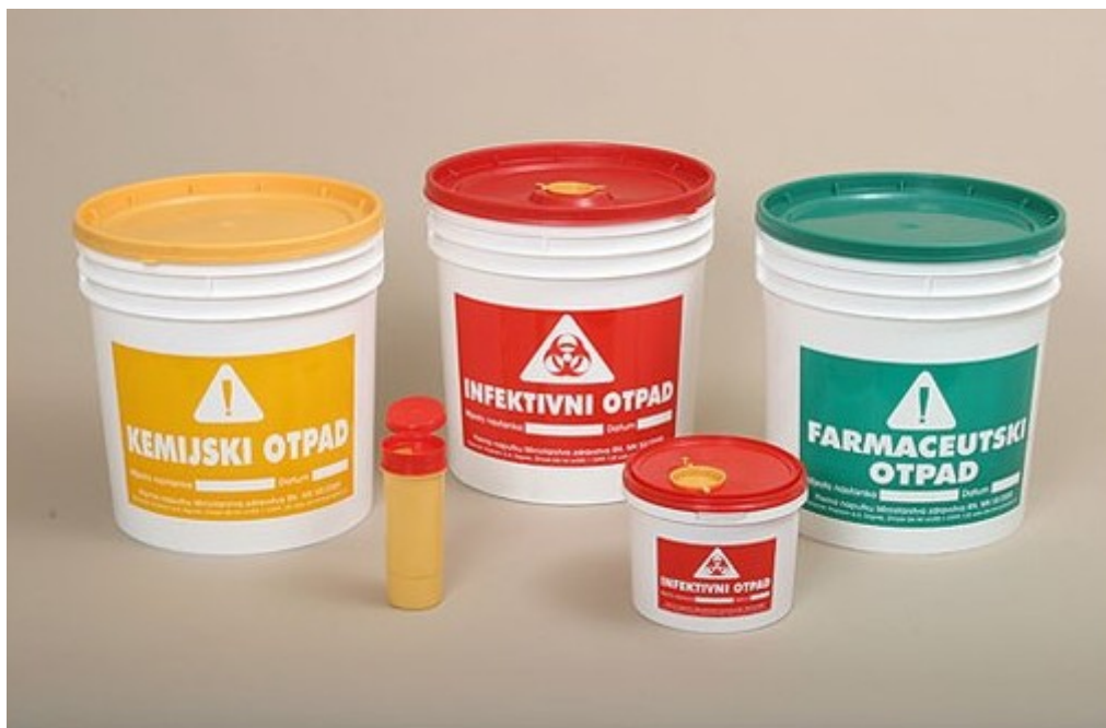
Slika 10. Prikaz boja različitih vrsta otpada s osvrtom na kemijski otpad [13]