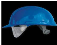
Slika 12. Industrijska zaštitna kaciga za električare [14]