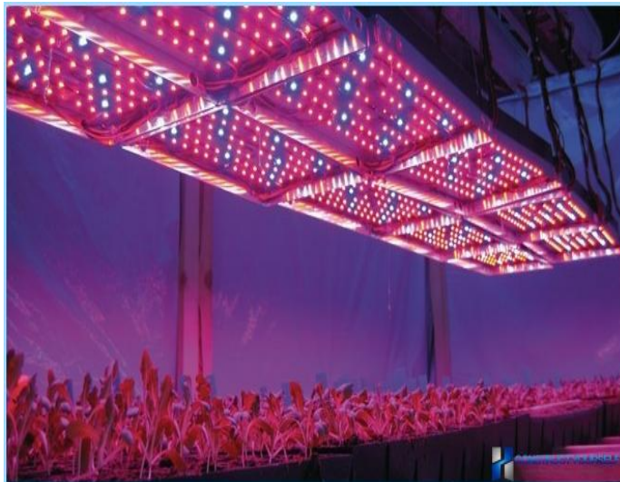
Slika 11. LED rasvjeta u stakleniku [21]