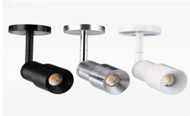
Slika 5. Spot LED svjetiljke [11]