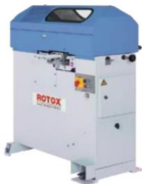
Slika 7 Prikaz pile za rezanje letvica za staklo

Do završetka procesa ostaju još tri faze, a prva od njih je sastavljanje elemenata koje se izvodi na preši za ostakljivanje. Nakon toga slijedi rezanje letvica za staklo koje dolaze u nekoliko vrsta, ovisno o tome o kom sustavu PVC profila je riječ. Letvice za staklo postavlja radnik i to na način da, nakon podešavanja kuta, odjednom stavlja dvije letvice na rezanje. Letvice se ostavljaju kraj preše za ostakljivanje, a sve operacije vodi stroj prema uputama glavnog računala (7)