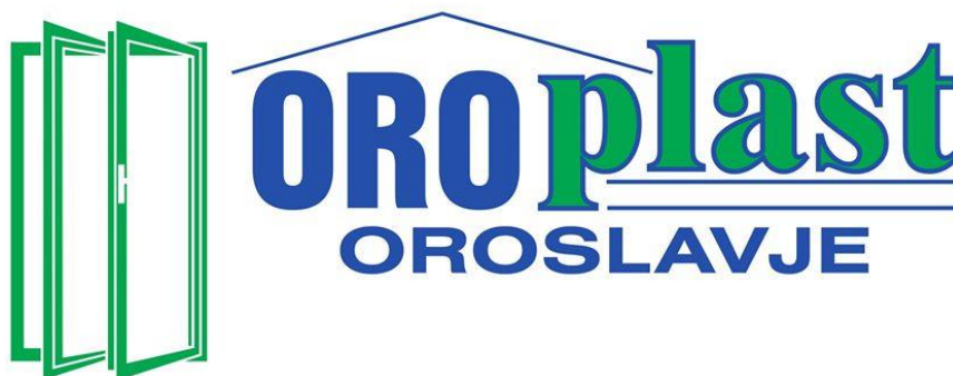
Slika 1 Logo tvrtke ORO PLAST – MRZLJAK

Predmet proučavanja zaštite na radu u ovom završno radu je tvrtka ORO PLAST – MRZLJAK d.o.o. Ova tvrtka za proizvodnju proizvoda od plastike za građevinarstvo u privatnom je vlasništvu, a nakon dugogodišnje iskustva rada u Njemačkoj 2004. godine osnovana je u Hrvatskoj sa sjedištem u Oroslavju. Tvrtka se nalazi na adresi Ulica Marije Jurić Zagorke 26, Oroslavje (1).