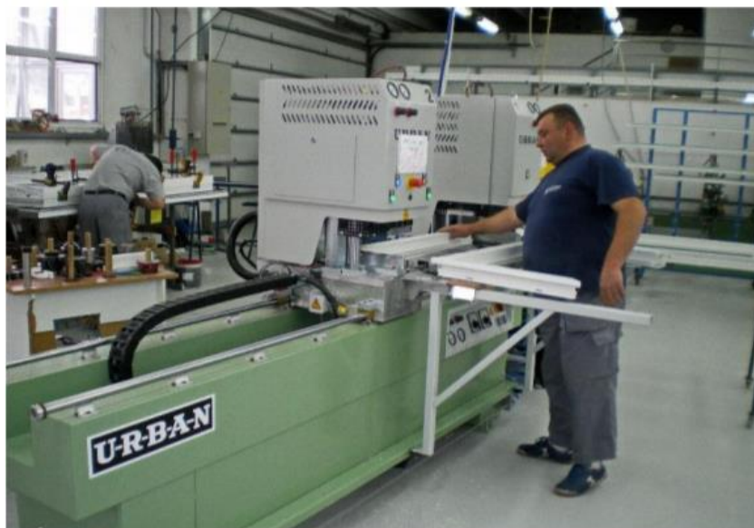
Slika 4 Prikaz varilice