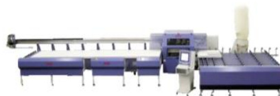
Slika 2 Prikaz reznog stroja i pogona