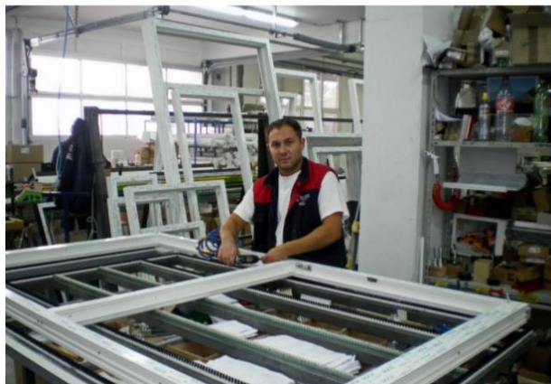
Slika 6 Prikaz stola za okivanje