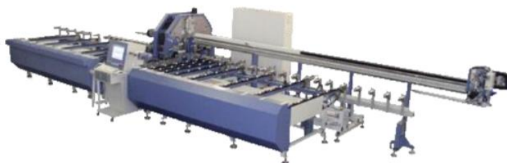
Slika 3 Prikaz obradnog centra

pored armirača. Nakon što radnik u PVC profile stavi ojačanje, PVC profil ulazi u stroj za armiranje koji upucava vijke i čelična ojačanja u PVC profile. Dužina čeličnog ojačanja očitava se na monitoru koji pokazuje dužinu PVC profila i određuje potrebno ojačanje. Nakon armiranja, PVC profili se obrađuju, što se smatra najsloženijim proizvodnim procesom. Naime, nakon armiranja PVC profili ponovno trakom idu do sljedeće faze, u ovom slučaju do obradnog centra gdje se profili bruse, odzračavaju i frezaju (7).