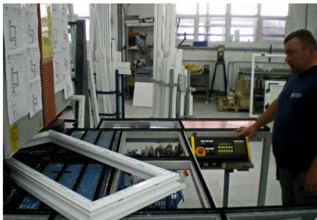
Slika 5 Prikaz čistilice vanjskog kuta