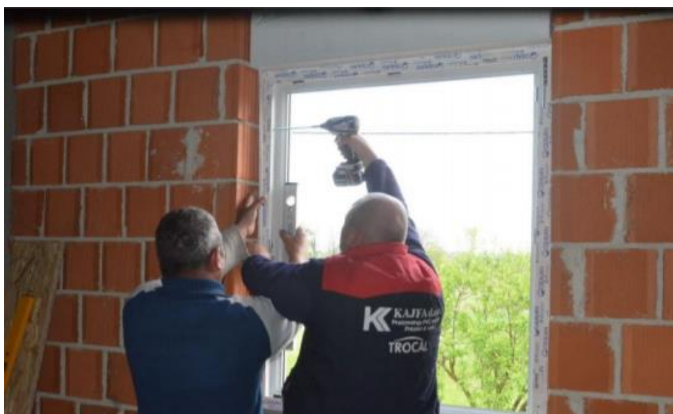
Slika 9 Prikaz montaže PVC prozora

Također, važno je znati da građevinski otvor uvijek mora biti veći od dimenzija same PVC stolarije te da se preostali prostor ispunjava pjenom kako bi se postigla toplinska i zvučna izolacija. Kada je primjerice riječ o prozorima, građevinski otvor tada on mora biti od 1,5 do 2 centimetra veći od dimenzija PVC prozora. Upravo je u tom segmentu montaže vrlo važno da se sve odradi prema pravilima kako, uslijed toplinskih dilatacija, ne bi došlo do poteškoća u otvaranju ili zatvaranju prozora ili pak do pucanja doprozornika (7).