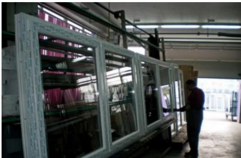
Slika 8 Prikaz preše za staklo

Zadnji korak u proizvodnom procesu PVC stolarije je ostakljivanje profila na preši. Naime, profili se najprije sastavljaju na preši na način da se spajaju okviri i krila, a zatim se profil pneumatski steže, a radnik podešava visinu profila kako bi ga lakše ostaklio. Unutar utora u krilu PVC profila postavljaju se ulošci za staklo, a potom se na njih postavlja staklo koje se učvršćuju na krilo. Kada se postavi staklo, važno je staviti prethodno rezane letvice kako bi staklo stajalo na tom položaju. Nakon postavljanja stakla na PVC profile, proizvod je spreman za isporuku kupcu, a do nje se odlaže u skladište u kojem čeka do konačne montaže na objektu kupca (7).