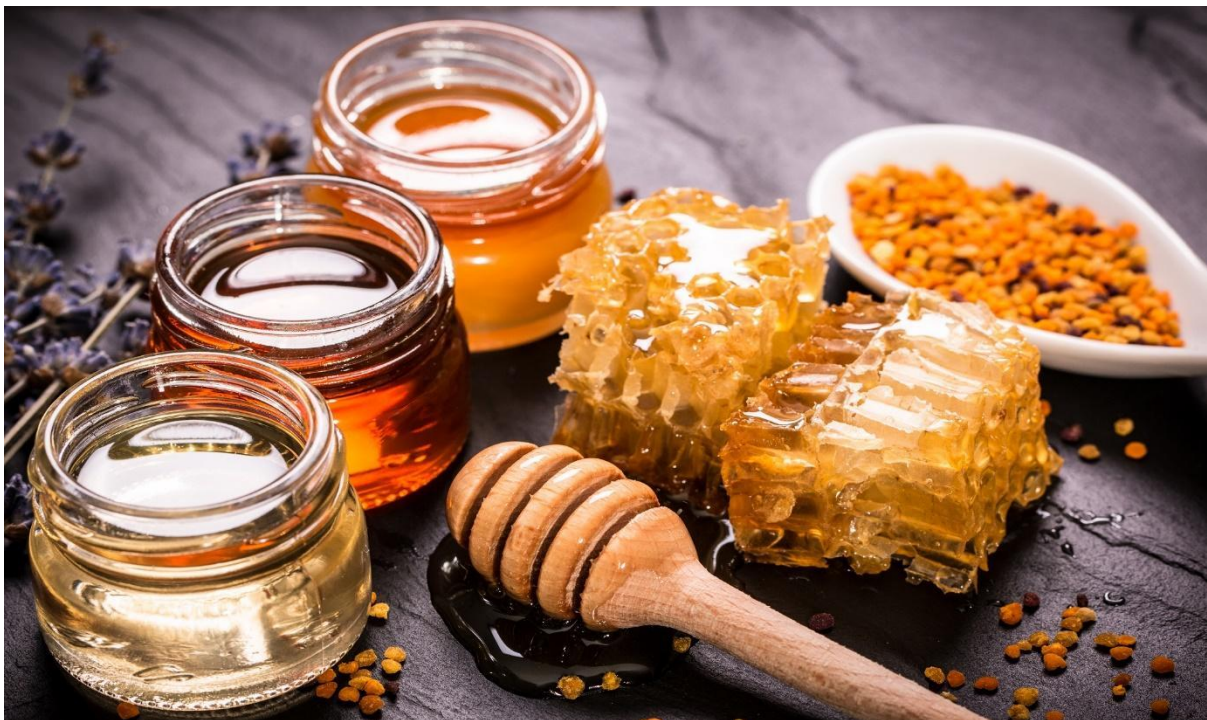
Slika 3. Pčelinji med [3]

Med je kristaliziran, viskozni proizvod guste konzistencije i slatkog okusa što ga medonosne pčele proizvode od nektara medonosnih biljaka ili sekreta koji potječe od živih dijelova biljaka (četinjače, lisnjače). Obzirom na izvor dijelimo ga na cvjetni med i medljikovac. Med je prikazan slikom 3.