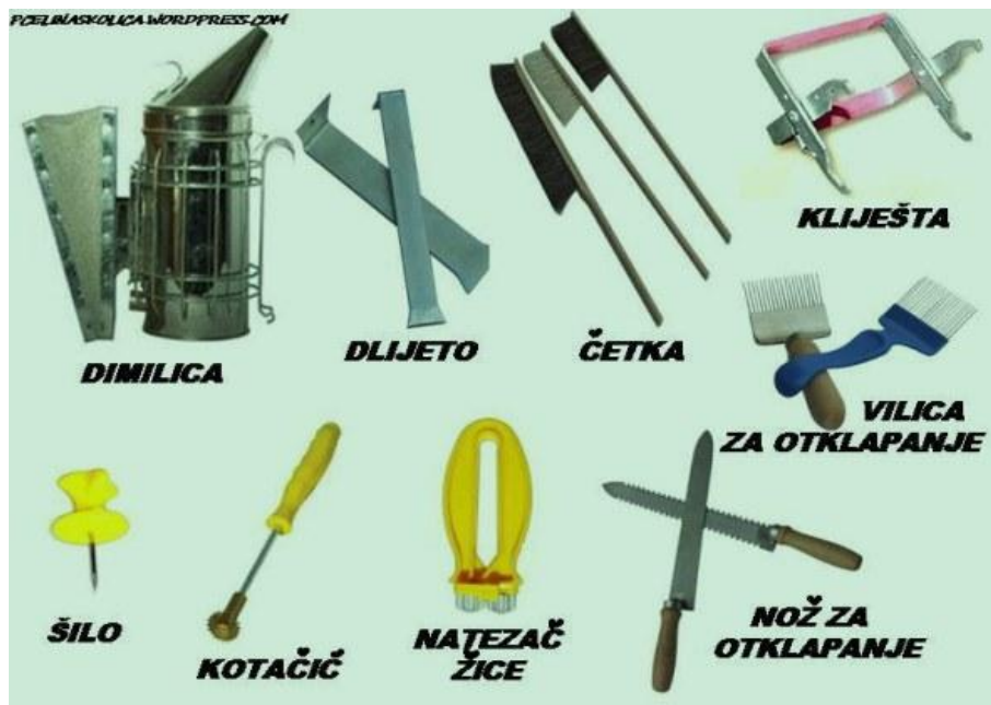
Slika 6. Pčelarska oprema [6]