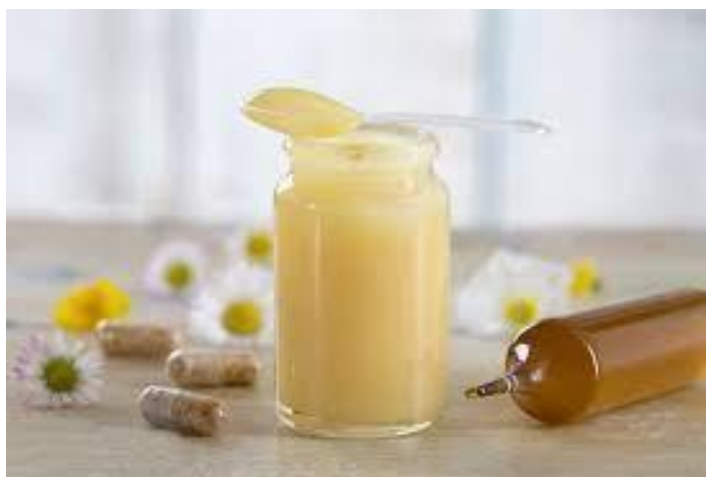
Slika 4. Matična mliječ [4]

Propolis je tekućina tamnozeleno do smeđecrvene boje. Kemijski sastav mu je raznolik te najviše sadrži biljne smole i balzama, aromatičnih i eteričnih ulja, voska i peludi. Ima antiseptička, bakteriostatična, anestetična i antitoksična svojstva. Dobar je biostimulator, jer aktivira specifična antitijela u organizmu. U narodnoj medicini koristi se za liječenje gnojnih rana, opekotina, žuljeva, ogrebotina i upala. Upotrebljava se i za lakiranje drvenih predmeta (Agroklub.hr).