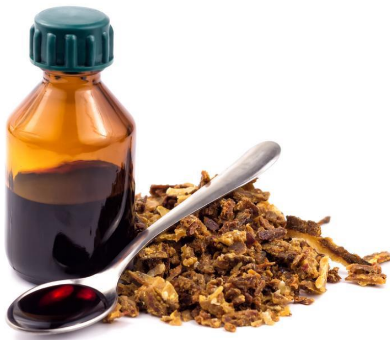
Slika 5. Propolis [5]

Propolis je tekućina tamnozeleno do smeđecrvene boje. Kemijski sastav mu je raznolik te najviše sadrži biljne smole i balzama, aromatičnih i eteričnih ulja, voska i peludi. Ima antiseptička, bakteriostatična, anestetična i antitoksična svojstva. Dobar je biostimulator, jer aktivira specifična antitijela u organizmu. U narodnoj medicini koristi se za liječenje gnojnih rana, opekotina, žuljeva, ogrebotina i upala. Upotrebljava se i za lakiranje drvenih predmeta (Agroklub.hr).