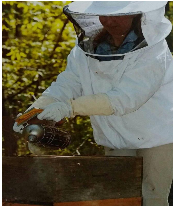
Slika 7. Pčelarska oprema [7]

U našoj državi najveći broj pčelara bavi se pčelarstvom iz hobija. Tako je iz podataka za 2012. godinu, koji su objavljeni u Nacionalnom pčelarskom programu za razdoblje od 2014. do 2016. godine, vidljivo da se od ukupno 8.953 registriranih pčelara, njih 664 (7,42 %) profesionalno bavilo pčelarstvom i da su držali 111.779 (22,72 %) od ukupno 491.981 pčelinjih zajednica, dok su se svi ostali pčelarstvom bavili iz hobija.