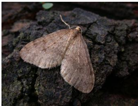
Slika 6.: Leptir Operophtera brumata L. [6]

Leptiri ovog štetnika se roje od studenog do siječnja za vrijeme mrazova odakle su dobili ime. Mužjaci lete dok ženke ovog leptira imaju zakrčljala krila pa se penju po deblu kako bi stigle do krošnje i tamo položile jaja (slika 6.). Mrazovci kao posljedicu izazivaju golobrst već krajem proljeća dok kod voćki vrlo često dolazi do gubitka ploda.