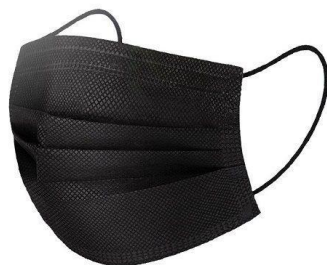
Slika 14.: Jednokratne medicinske maske za lice

vid zaštite od potencijalnog dodira gubarovih dlačica sa licem čime se sprječava direktan dodir otrovnih dlačica i kože.