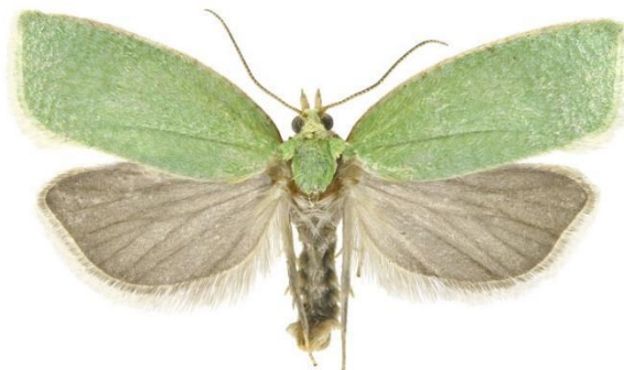
Slika 2.: Leptir Tortrix viridana L. [2]

Odrasli Zeleni hrastov savijač je maleni leptir sa jednolikim zelenim prednjim parom krila i pepeljasto sivim stražnjim krilima (slika 2.). Kao posljedicu ovaj štetnik izaziva golobrst i moguće propadanje stabla.