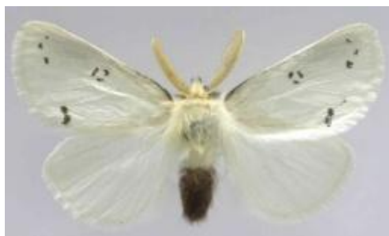
Slika 4.: Leptir Euproctis chrysorrhoea L. [4]

Zlatokraj u odraslom obliku je veliki leptir bijelih krila. Mužjaci se od ženki razlikuju po tamnoj pjegi na prednjim krilima, a ime su dobili po žuto-smeđim dlačicama koje se nalaze na kraju trbuha (slika 4.). Napadnuta stabla mogu odumrijeti nakon uzastopnih golobrsta.