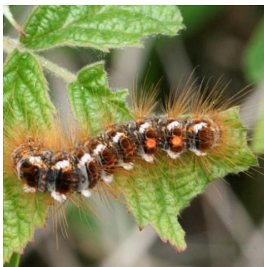
Slika 3.: Gusjenica Euproctis chrysorrhoea L. [3]

Zlatokraj napada hrastova stabla kao i stabla gloga te grmove. Gusjenice tijekom kasnog ljeta ogoljuju lišće i stvaraju guste zapretke na granama gdje prezimljuju. One se raspoznaju po tamnosivoj do crnoj boji sa bočnim bijelim linijama i crvenkastim mrljama na leđima (slika 3.).