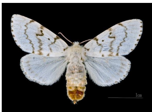
Slika 9. Ženka Lymantria Dispar L. [9]

Ženka ovog leptira može narasti do 3 centimetra. Ima bijela krila promjera 50 do 70 milimetara. Na prednjim krilima se nalaze vijugave linije i tamne pjege (slika 9.). Ženka gubara ima dobro razvijena krila, ali ne leti. Ona se polako uspinje po deblu čekajući mužjake. Nakon oplodnje tijekom jeseni i zime ženka odlaže 300 do 600 jajašca na kori debla, a rijeđe i u granama te ih pokriva svojim žutim dlačicama sa zatka. Ona također odlaže i neoplođena jaja, ako ne dođe do oplodnje, a iz njih se rijetko razviju gusjenice. Takva žuta jajna legla su specifična karakteristika gubara.