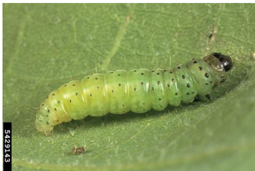
Slika 1.: Gusjenica Tortrix viridana L. [1]

Zeleni hrastov savijač je štetnik koji napada hrastova stabla. Pojava ovog štetnika se raspoznaje po savijenom lišću tijekom travnja u kojem se nalaze malene gusjenice (slika 1.). Gusjenice se prepoznaju po sjajnoj crnoj glavi i tijelu zelene boje.