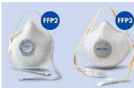
Slika 13.: Zaštitne maske FFP2 i FFP3[13]

Filtarske polumaske se dijele na maske s ventilom i maske bez ventila (FFP2 i FFP3) i koriste se jednokratno (Slika 13.). Ove maske štite od kapljica, raznih čestica u zraku i aerosola. Maske bez ventila filtriraju udisani zrak i izdisani zrak te time osiguravaju samozaštitu i vanjsku zaštitu. Maske s ventilima filtriraju samo zrak koji se udiše i zbog toga one osiguravaju samo samozaštitu.