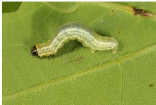
Slika 5.: Gusjenica Operophtera fagata Scharf [5]

Mrazovci napadaju hrastove, grabove, bukvu, brezu i voćke. Gusjenice mrazovca su prepoznatljive po žutim uzdužnim prugama na svjetlo zelenoj podlozi i po svom specifičnom kretanju.