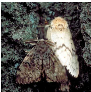
Slika 7.: Odrasle jedinke Lymantria Dispar L. [7]

Gubar je jedan od najznačajnijih primarnih štetnika u Hrvatskim šumama (slika 7.). On najviše napada hrastove ( Quercus spp. ), a često i druge vrste listača poput obične bukve ( Fagus sylvatica ), grabova ( Carpinus spp. , Ostrya Carpinifolia ), lijeske ( Corylus spp. ) i pitomih kestena ( Castanea spp. ). Uz to ponekad ga se može pronaći i na četinjačama. Gubar je u hrastovim šumama Hrvatske dominirao do 60-tih godina prošloga stoljeća kada dolazi do pojačane pojave ostalih defolijatora te tada kontinentalni dio Hrvatske bilježi blago opadanje gubarovih populacija. Praćenjem pojave gubara zaključeno je kako se on pojavljuje u cikličkim gradacijama svakih 10-11 godina.