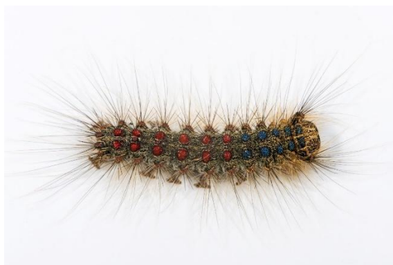
Slika 8.: Gusjenica Lymantria Dispar L.[8]

Gusjenice gubara su veličine 40 do 70 milimetara. Smeđe su boje sa jednom žutom uzdužnom ili jednom širokom sivosmeđom prugom. Gusjenice na svojoj poledini imaju bradavice. Na prvih pet segmenata se nalaze po dvije plave bradavice dok se na ostalim segmentima nalaze bradavice crvene boje (slika 8.). Gusjenice su gusto obrasle otrovnim lako lomljivim dlačicama koje ako dođu u doticaj sa ljudskom kožom izazivaju svrbež i kratku upalu kože. Zbog svojih dlačica gusjenice imaju mogućnost lebdenja te im to omogućava veliku rasprostranjenost po šumama.