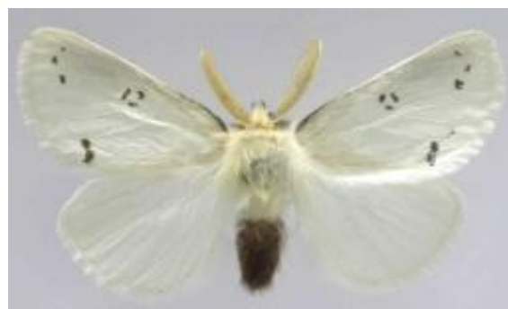
Slika 4.: Leptir Euproctis chrysorrhoea L. [4]

Zlatokraj u odraslom obliku je veliki leptir bijelih krila. Mužjaci se od ženki razlikuju po tamnoj pjegi na prednjim krilima, a ime su dobili po žuto-smeđim dlačicama koje se nalaze na kraju trbuha (slika 4.). Napadnuta stabla mogu odumrijeti nakon uzastopnih golobrsta.