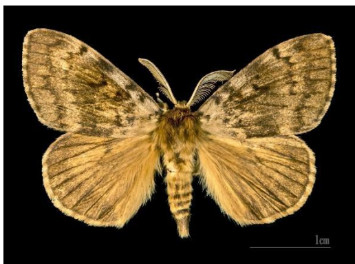
Slika 10.: Mušjak Lymantria Dispar L.

Mušjaci gubara narastu do 15 milimetara (slika 10.). Imaju tamna sivosmeđa krila sa promjerom 35 do 50 milimetara. Životni vijek leptira je desetak dana, rijeđe dulje što ovisi o klimatskim uvjetima. Čitav razvoj gubara traje godinu dana.