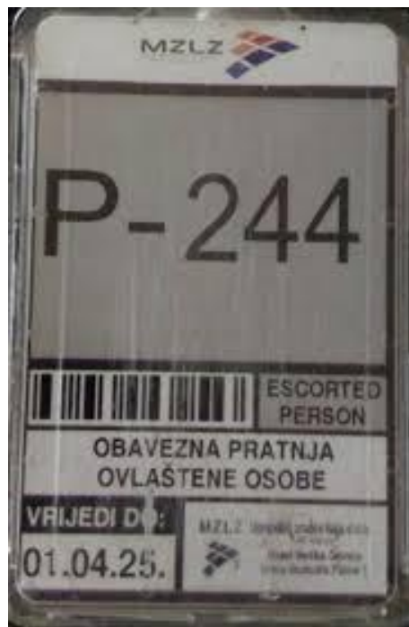
Slika 5 Primjer identifikacijske iskaznice za pristup uz pratnju [36]