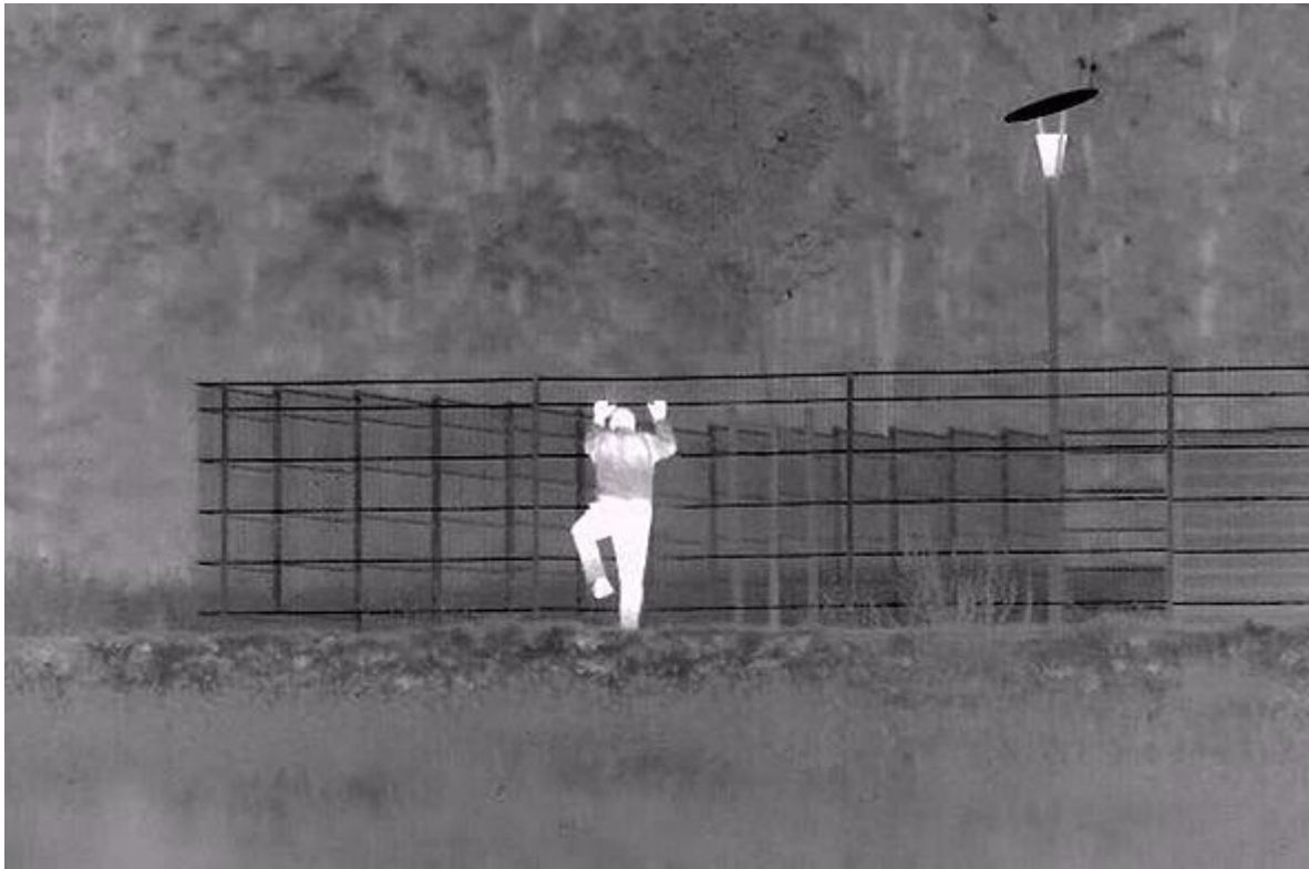
Slika 3 Primjer prikaza termalne video kamere [34]