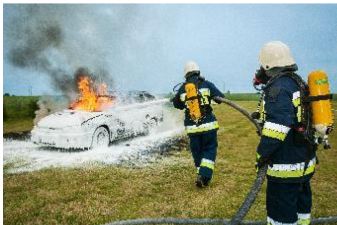
Slika 7. Prah kao sredstvo za gašenja