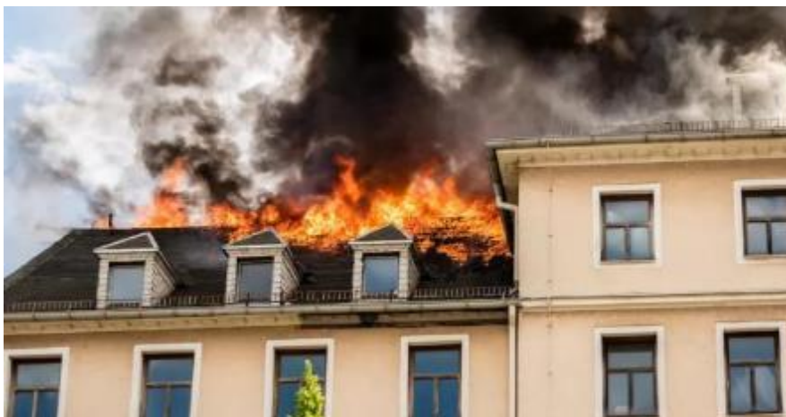
Slika 18. Požar u zgradi