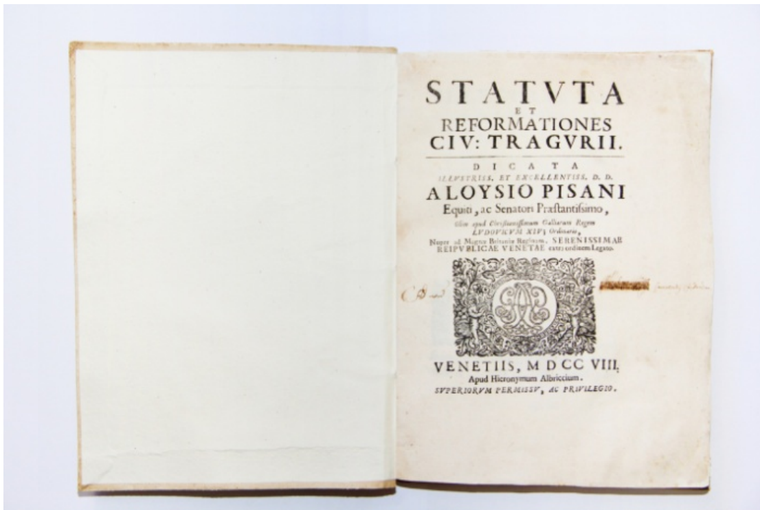
Slika 5. Statut grada Trogira iz 1322. godine izložen u Muzeju grada Trogira [20]

sprovedena jer su ona često ispremiješana. Ipak, Trogirski statut kao zbornik predstavlja smislenu pravnu cjelinu i spada među sređenije dalmatinske srednjovjekovne statute. [16]