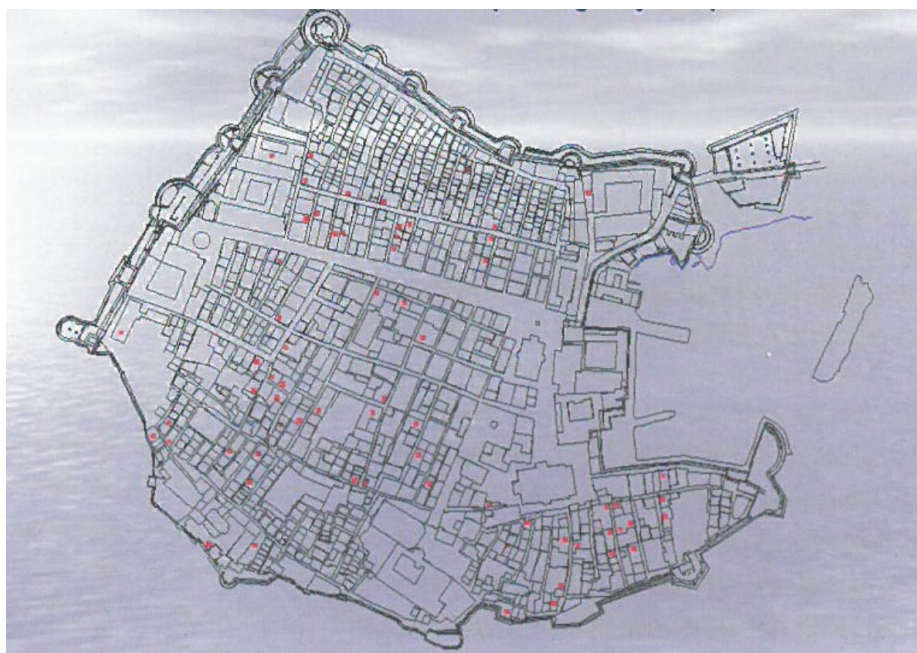
Slika 1. Tlocrt Dubrovnika i raspored gradskih gustijerni (bunara) [13]