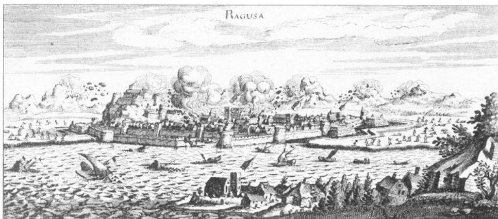
Slika 2. Velika trešnja Dubrovnika 1667. godine [13]

Zaključno, elementarne nepogode, požari i prirodne katastrofe pratile su razvitak Dubrovnika te su značajno obilježile njegovu izgradnju. Nakon svake katastrofe na starim temeljima nastajao bi novi grad pa se kontinuitet gradnje može poistovjetiti s kontinuitetom obnove. [13]