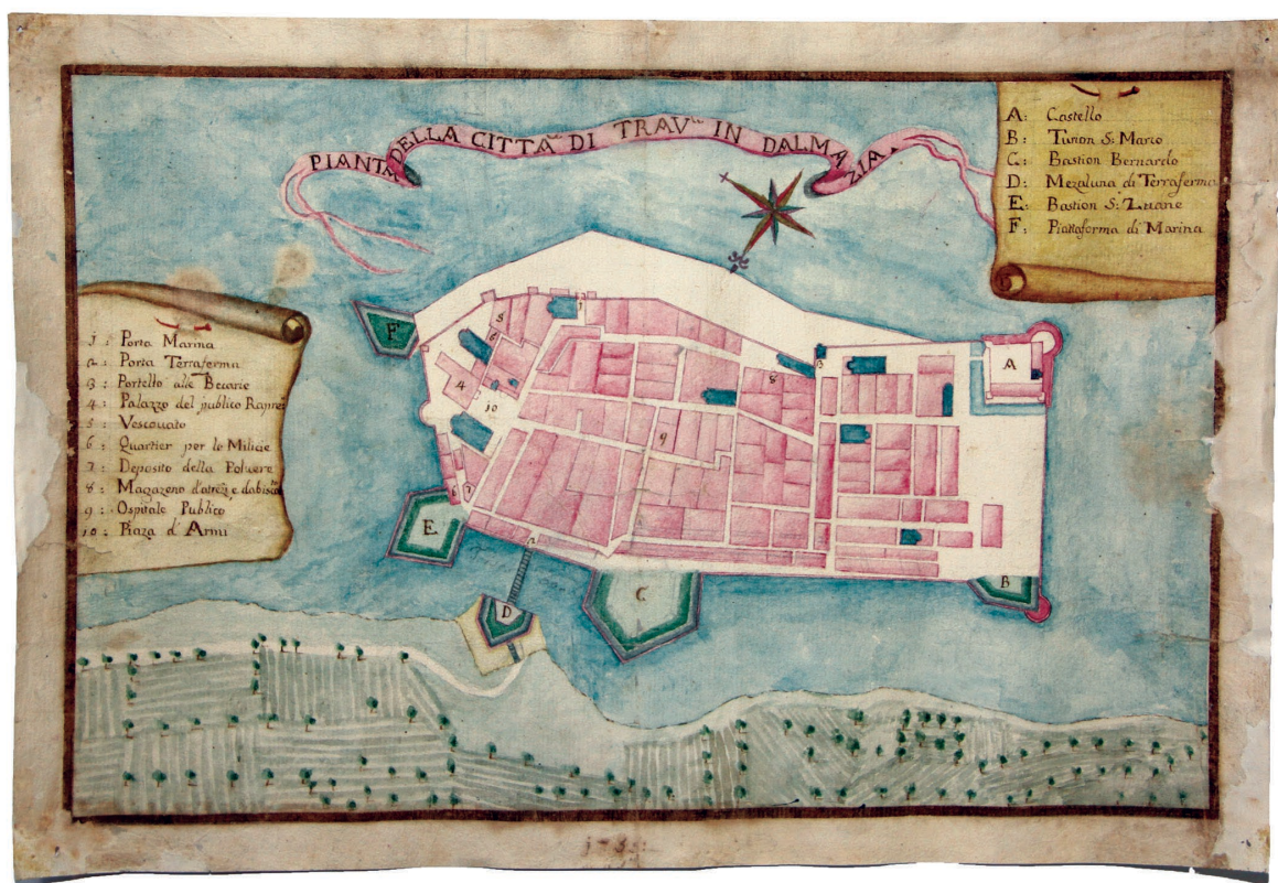
Slika 7. Plan grada Trogira iz 1755. godine [20]

vlasti i napredni građani poduzmu mjere za osnivanje vlastitog vatrogasnog društva, budućeg nositelja zaštite u Trogiru i okolici. [15] [20]