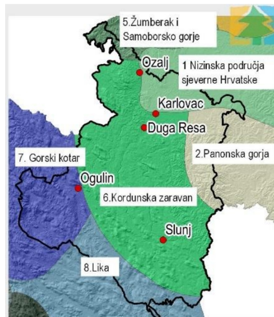
Slika 3: Krajobrazne jedinice Karlovačke županije