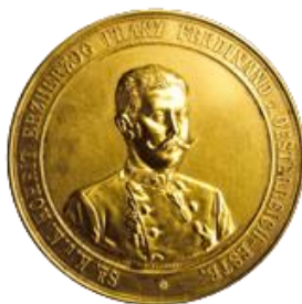
Slika 1 . Zlatna kolajna s likom nadvojvode Franza Ferdinanda [1]