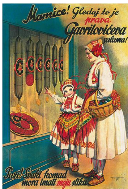
Slika 4. Lik Jelice koji se nalazi na svim proizvodima [4]

1926. rad u tvornici i dalje cvjeta, a godišnje se proizvodilo 60 vagona salame, 20 vagona masti i 5 vagona konzervi. Prema liku trogodišnje Jelice Cekuš, sestrične Đure Gavrilovića starijeg, u Beču je izrađen zaštitni znak tvornice Gavrilović. Jelica je odrastala s tvornicom i od malih nogu grickala čvarke i salame. Grafičko rješenje Jelice, koja u ruci drži Zimsku salamu, 1931. godine osmislio je Andrija Maurović, jedan od najvećih hrvatskih crtača stripova. Lik Jelice se od tada pa do danas nalazi na svim Gavrilovićevim proizvodima.