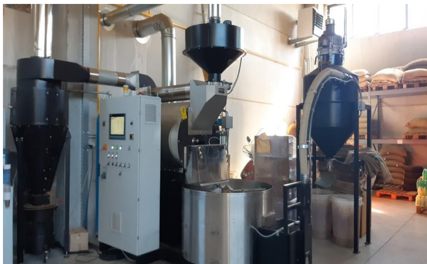
Slika 10 Pržionik u kojem su uzorci prženi.