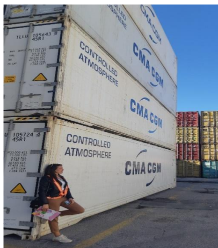
Slika 1 Kontejneri u kojima se doprema kava u Riječku luku.