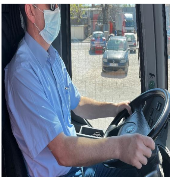
Slika 13. Pravilno nošenje zaštitne maske

Slika 13. i 14. predstavljaju pravilno nošenje zaštitnih maski vozača autobusa, slika 14. i 15. prikazuju nepravilno nošenje maske vozača autobusa.