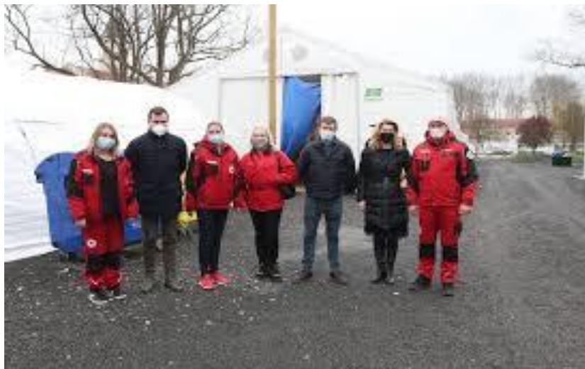
Slika 27. Nošenje zaštitnih maski u potresnom području