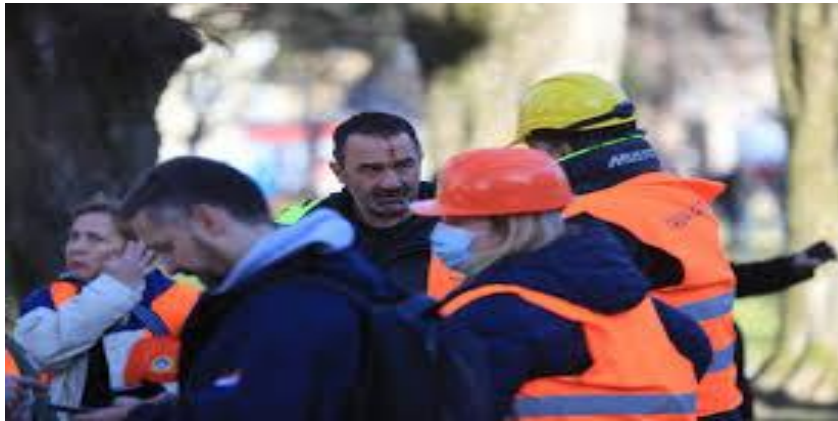
Slika 25. Nošenje zaštitnih maski za vrijeme potresa