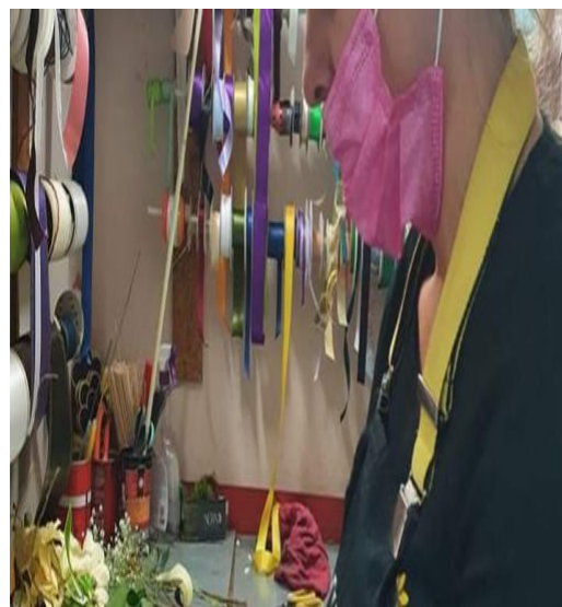
Slika 20. Nepravilno nošenje maske