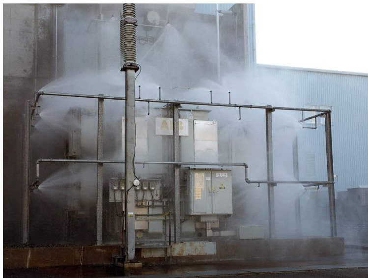
Slika 13. Slika prikaz gašenja „SAME SAFE-om“.[2]