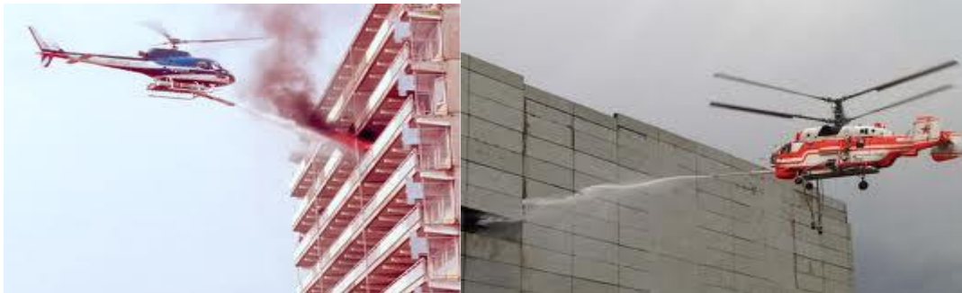
Slika 4. IFEX protupožarni helikopteri.[16]