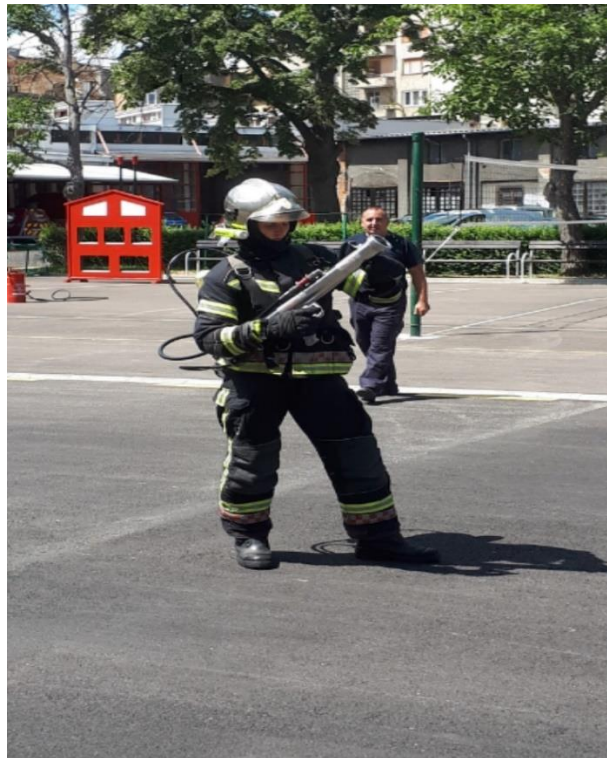
Slika 1. Autor rada na zadatku s visokotlačnim uređajem.[18]

Požarne opasnosti možemo otkloniti na raznorazne načine. Jedan od najučinkovitijih sredstva u praksi za gašenje i suzbijanje požara odnosno požarnih opasnosti su visokotlačni uređaji za gašenje požara.