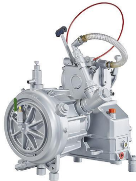
Slika 8. Visokotlačna centrifugalna vatrogasna pumpa H5.[15]

visokotlačnim cijevima veće duljine, kao i mogućnost opremanja vozila s većom količinom opreme i alata za gašenje požara raslinja, trave i sl.[15]