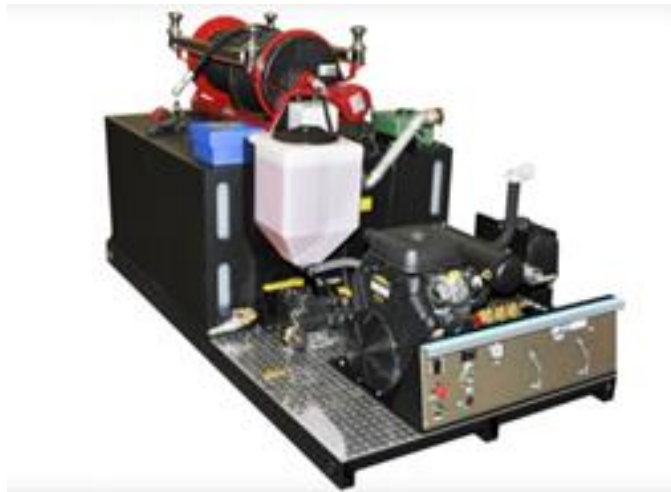
Slika 12. Visokotlačni uređaj PyroBlitz B 2000M-G.[7]

Vodovodni dijelovi vatrogasnog sustava opremljeni su visokotlačnim hidrauličkim cijevima i priključcima. Tu su uključene visokotlačne cijevi različitih dimenzija dvostruko opletene žicom, pocinčani čelični završeci cijevi i obloženi čelični hidraulički priključci. Kruti vodovodni dijelovi sastoje se od pocinčanih cijevi i pocinčanih čeličnih priključaka. Visokotlačni uređaj sadrži i brončani prilagodljivi set by-pass otpusnog ventila kako bi se postigao maksimalni radni pritisak sistema. Namjena ventila je da otpušta pritisak glavne pumpe preko preljevnog otvora.[2]