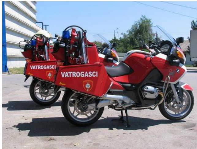
Slika 3. Ifex vatrogasni motocikl.[5]

IFEX vatrogasni motocikli osmišljeni su kao specijalno rješenje za brzu početnu navalu u urbanim područjima gdje klasična vatrogasna prometna sredstva imaju poteškoća u kretanju. Danas se upotrebljavaju za razne namjene na mjestima gdje je potrebna velika mobilnost i fleksibilnost vatrogasnih prijevoznih sredstava za svladavanje vatre u početnim fazama.[5]