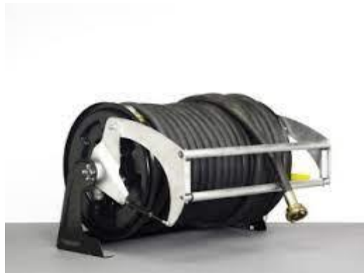
Slika 9. Vitlo za brzu navalu s polukrutom visokotlačnom cijevi.[14]

cijev mogu se direktno spojiti plosnate visokotlačne cijevi tipa H preko visokotlačne kovane spojnice ili preko visokotlačne dvodijelne razdjelnice \varnothing 38/2 \times \varnothing 38 mm. Vitla za brzu navalu mogu biti pokretana na mehanički ili električni pogon. Električni pogon može biti 12 V/140 W ili 24 V/ 100 W. Pogon je ugrađen u bubanj zbog uštede prostora i veće sigurnosti. Brzina namatanja vitla je ovisno o električnom pogonu 45 m/min pri 24 V napajanju i 33 m/min pri 12 V napajanju.[14]