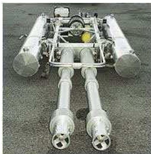
Slika 5. IFEX dual intruder pripremljen za montažu na Ecureuil Eurocopter AS350 jednomotorni helikopter.[16]