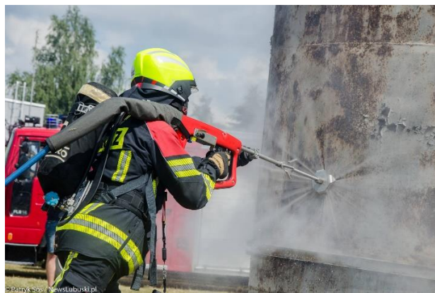
Slika 6. Rad s uređajem COBRA CCS.[4]

Kobra kao novi sistem gašenja i rezanja na visoki pritisak označava revoluciju u borbi protiv požara. KOBRA-SISTEM uz pomoć pritiska vode od otprilike 250 bara i uz dodatak abrazivne mješavine reže u roku od nekoliko sekundi rupu u vanjskom zidu gorućeg objekta. Na taj način je u mogućnosti u najkraćem vremenu uz pomoć rasprsnutog mlaza rashladiti dimne plinove koji se nalaze u prostoru. KOBRA-SISTEM bez problema probija ne samo zidne opeke, betonske zidove, krovove, slojeve nasipa, drvo, već i čelik, silose i sigurnosna vrata, i na taj način bez dovoda kisika djelotvorno gasi vatru. Istodobno se smanjuje mehanička šteta. Za napomenuti je da se na osnovu fine rasprsnute magle troši samo mala količina vode, što znači da se dodatne štete mogu spriječiti. Zbog brzog ishlapljivanja fine rasprsnute magle nastaje vodena para koja omogućuje brzo odvođenje topline. KOBRA-SISTEM u roku od nekoliko sekundi omogućava hlađenje do ispod 100°C.[4]