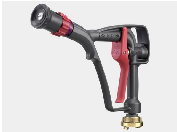
Slika 10. Visokotlačna mlaznica za vodu ROSENBAUER HP NEPIRO Ergo.[13]