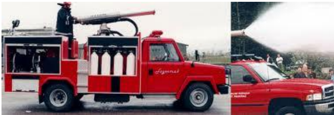
Slika 2. Visokotlačni monitor montiran na vozilo.[5]

Od 1994. do danas, više od 40.000 vatrogasaca u preko 60 zemalja širom svijeta, uključujući RH, koristi IFEX tehnologiju u svakodnevnoj borbi protiv požara u raznim verzijama i okolnostima. Do sada je razvijeno više različitih tipova ovih uređaja, za različite načine primjene: od prijenosnih uređaja i onih montiranih na motocikle, terenska ili standardna vatrogasna vozila, do instalacija na helikoptere za gašenje najnedostupnijih mjesta požara.[5]