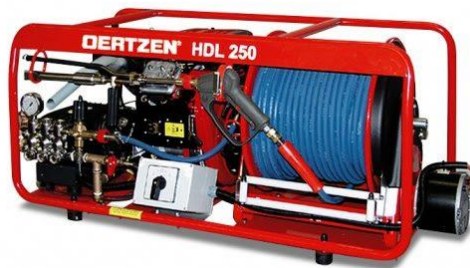
Slika 11. Visokotlačni uređaji OERTZEN HDL 250 s TRIPLEX mlaznicom i električnim namatanjem vitla.[12]

Navedeni HDL uređaj izrađuje se u više tipova npr. HDL 170, HDL 200 i HDL 250, amogu se isporučivati u nekoliko opcija: sa ili bez spremnika vode, različitih duljinacijevi, s jednim ili dva vitla, ugrađeni na vozilo ili kao zaseban uređaj, te kao prijevozni uređaj. Također su pogodni zbog svojih kompaktnih dimenzija za montažu u kombi vozila koja mogu služiti i za prijevoz ljudi, ali isto tako i za mala navalna vozila.