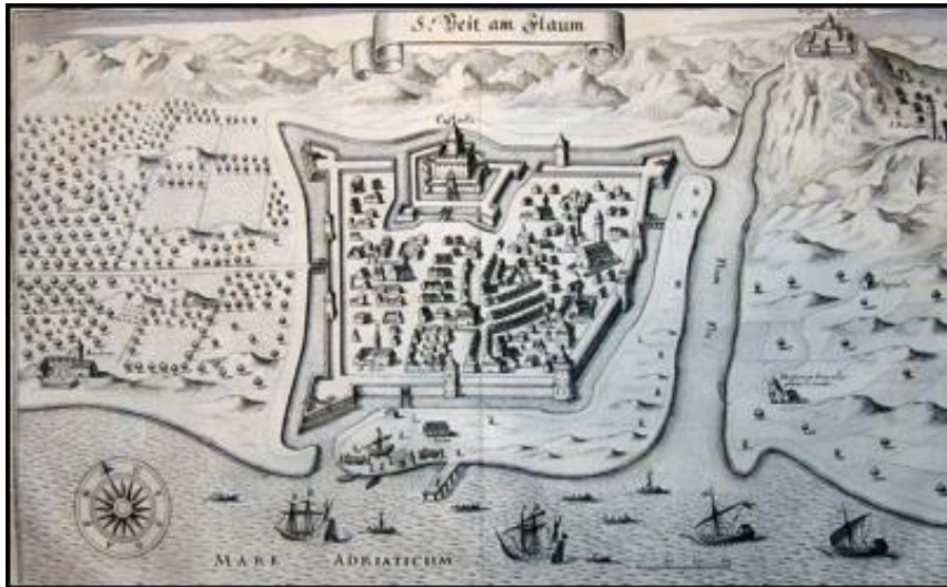
Slika 2. Rijeka 1650. g [3]

Tek 1848. grad je uključen u sastav Banske Hrvatske, ali unatoč tome, to nije doneslo mir. Borba za Rijeku između Hrvatske i Mađarske sve se više zaoštravala, te je 1868. donesena Hrvatsko-ugarskom nagodba, odnosno “riječka krpica”, kojom je postignut dogovor prema kojemu Rijeka dolazi pod neposrednu upravu. Tada se Rijeka ponovno ubrzano razvija i postaje najveći lučki i pomorski grad. 1918. godine, nakon raspada Austro-Ugarske i Rijeka i Sušak postaju sastavni dio Države Srba, Hrvata i Slovenaca, ali Rijeku ubrzo okupira Kraljevina Italija. To je prvi put da je Italija tražila Rijeku, već ju je prepuštala Hrvatskoj. Nastupa prijelazno razdoblje koje u konačnici dovodi da 1924. Rijeka ipak pripala Italiji. Opet se bilježi ubrzani gospodarski pad i Rijeka postaje periferni gradić, a Sušak, koji je ostao uključen u sastav Kraljevine SHS, ubrzano raste.