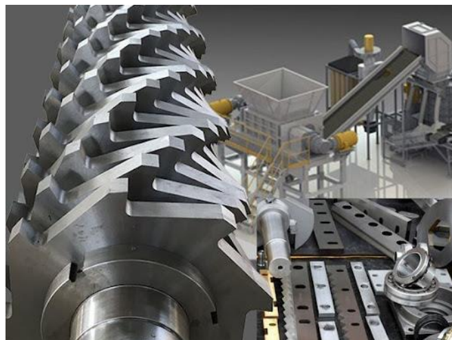
Slika 10. Drobilica (šreder) za obradu metalnih limenki