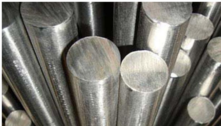
Slika 13. Aluminijske šipke

Šipke su poluproizvod namijenjen daljnjoj obradi, slika 13. prikazuje aluminijske šipke. Naši kupci ih koriste za izradu tuba i limenki u farmaceutskoj, prehrambenoj, kozmetičkoj i kemijskoj industriji te za potrebe automobilske i elektro industrije. Izrađuju se okrugle šipke sa ili bez rupe. Mogu biti ravni ili bombardirani (konusni ili sferni) ovisno o potrebama kupca. Šipke koje nude kupcu su debljine od 3 mm do 11 mm. Sve su meko žarene i površinski obrađene.