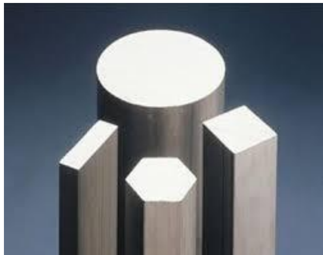
Slika 11. Oblici ingota

Limovi dvije pruge za valjanje, Luna i Marte (Mjesec i Mars), omogućuju ponudu potpunog asortimana proizvoda. Stalno provjeravaju usklađenost s parametrima grijanja te biraju tehnike valjanja pogodne različitim vrstama čelika nakon čega podvrgavaju limove najprikladnijim načinima hlađenja. Zadnje faze kontrole i obrade uključuju pregled cijelog proizvoda i njegovo moguće kondicioniranje. Ingoti, slika 11., komad metala koji se dobije izljevanjem iz taljevine u neki oblik, najčešće šipke ili bloka, prije daljnje obrade.