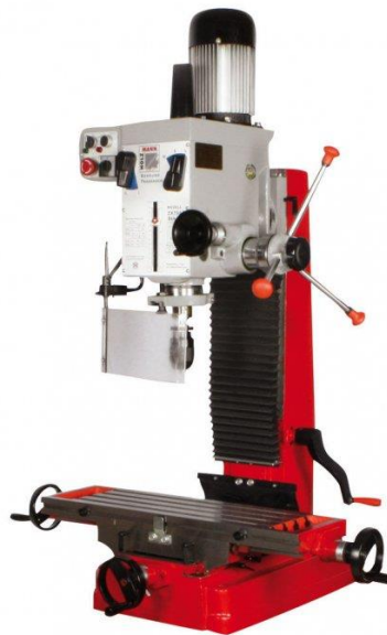
Slika 7. Glodalica za metal

Zubi glodala dolaze jedan za drugim u zahvat s materijalom i za vrijeme zahvata jako se mijenja opterećenje zuba.