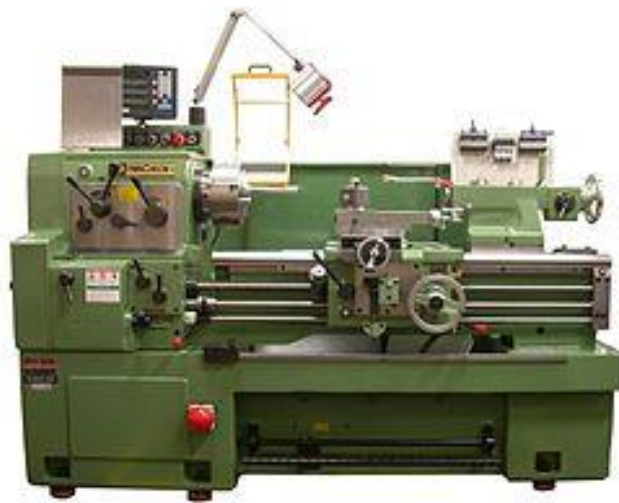
Slika 6. Tokarilica

Alatni strojevi za obradu odvajanjem čestica su; tokarilice, slika 6., su alatni strojevi za strojnu obradu odvajanjem čestica, pomoću kojih se rezanjem obrađuju i izrađuju dijelovi rotacijskog oblika. Tokarilice se dijele: jednostavne tokarilice, univerzalne tokarilice, kopirne tokarilice, planske tokarilice, karusel tokarilice, revolverске tokarilice, CNC tokarilice. Tokarenje je postupak strojne obrade skidanjem čestica kojim se proizvode obratci rotacijskih površina (valjkasti proizvodi). Izvodi se na alatnim strojevima tokarilicama. Obradak obavlja glavno gibanje, dok alat obavlja posmično, pripremno i dostavna gibanja.