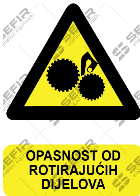
Slika 2. Opasnost od rotirajućih dijelova

Ogradu treba uvijek napraviti tako da se može lako skinuti i ponovo postaviti oko bi se olakšali radovi na održavanju. Vertikalna vratila ograđuju se do visine 5 m iznad poda, pri čemu se donji dio ograde, do visine 0,5 m izrađuje od lima i drva, jer je na tom dijelu veća mogućnost oštećenja vratila prilikom transporta materijala po radnom prostoru. Povrede od kružnog gibanja mogu biti vrlo ozbiljne, čak i smrtonosne. Najopasniji su oni slučajevi kad je zahvaćena kosa ili dio odjeće, koji se omotava i sve jače gnječi pojedine dijelove unesrećenoga, slika 2. prikazuje znak za opasnost od rotirajućih dijelova.