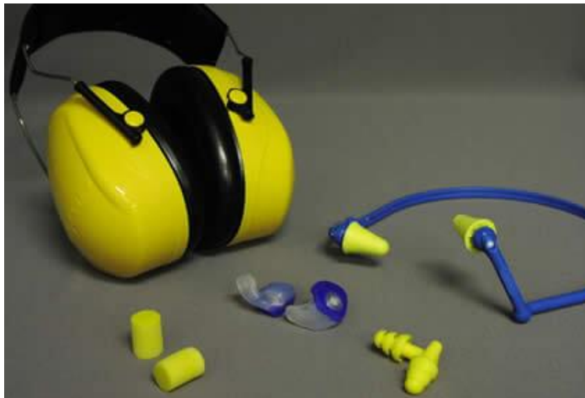
Slika 1. Sredstva za zaštitu sluha; antifon, čepići za uši

Vibracije su prateća pojava buke, a prenose se sa strojeva i uređaja na osobe koje njima rukuju. Vibracije smanjuju radnu sposobnost, oštećuju krvne žile, tetive, zglobove i kosti, a moguće su promjene u živčanom i probavnom sustavu. Zaštita se provodi izradom elastičnih sklopova, izoliranjem kao i skraćivanjem radnog vremena određenim strojevima i uređajima.