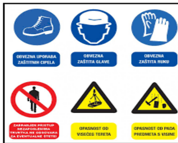
Slika 8. Znakovi zaštite kod rada na strojevima