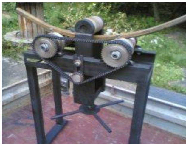
Slika 5. Stroj za savijanje cijevi

Isprešavanje ili ekstruzija služi u proizvodnji raznovrsnih profila, šipki, traka, cijevi konstantnog presjeka, od lakih i obojenih metala, te mekih čelika. Najveće prednosti su: mogućnost proizvodnje profila najsloženijih oblika te odlično stanje površine gotovog proizvoda. Gotovi proizvod može biti: kontinuirani (teoretski beskonačno dugi proizvod) ili polukontinuirani (proizvodnja rezanih ili kraćih predmeta).