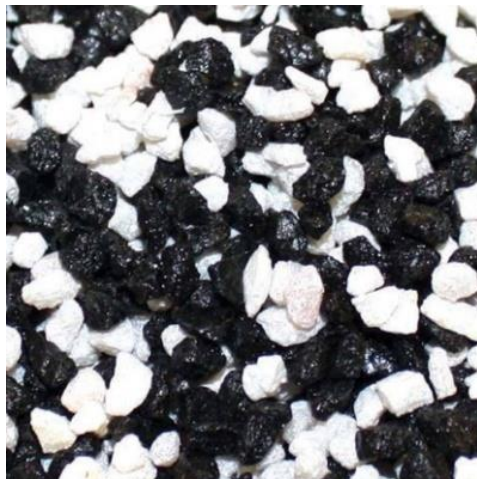
Slika 12. EcoGravel agregat

Agregati U ABS-u primjenjuju aktivnosti usmjerene gospodarenju otpadom i uporabi materijala koji potječu iz procesa proizvodnje čelika. Eco gravel slika 12., jedan je od tih: otpad crnog ili bijelog zrnatog pijeska koji transformiraju za primjenu u različitim sektorima. Eco gravel Black je komponenta visokih performansi pomiješana u betonu, miješanom cementu i bitumenskim konglomeratima, jednostavnije rečeno reciklirani asfalt, kojim je posljednjih godina u regiji Friuli Venezia Giulia i u Sloveniji izgrađeno preko 528 km cesta. Eco gravel White je pak namijenjen za upotrebu u cementima i stabilizaciji tla, posebno u temeljima cesta gdje je potrebno izbjegavati slijeganje. Za industrijsku proizvodnju Eco gravela, 2007. godine su otvorili pogon Global Blue: svake godine proizvode oko 200 000 tona Eco gravela. Primjer je to kružne ponovne upotrebe koja omogućuje da pridonose uštedi prirodnih resursa-