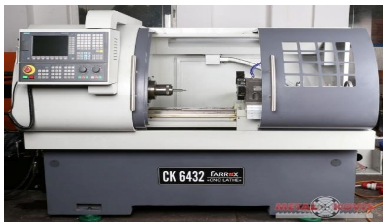
Slika 3. CNC stroj za obradu metala

Prednosti alatnih strojeva :zamjena fizičkog rada radnika, smanjenje broja radnika, bolja iskoristivost alatnog stroja, smanjenje vremena rada povećanje proizvodnosti, smanjenje troškova izrade, povećana ekonomičnost.