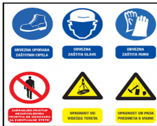
Slika 8. Znakovi zaštite kod rada na strojevima