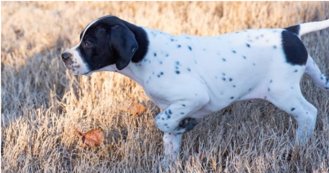
Slika 4. Štene engleskog pointera u fermi ( https://a-z-animals.com/animals/english-pointer/ )

pride divljači, pritom pazeći da ju ne zgrabi u usta. Cilj je pokazati psu kako da pronađe divljač, te da ju preplaši kako bi ona poletjela (ROEBUCK, 1983).