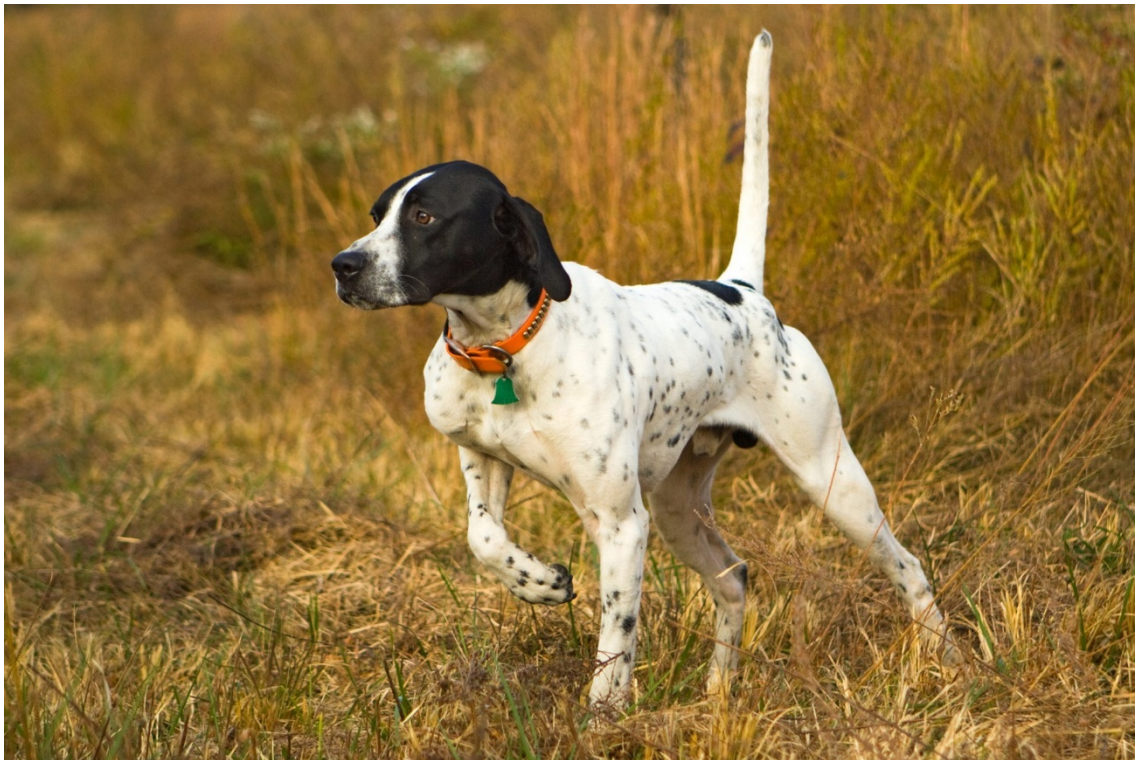
Slika 5 Engleski pointer markira ( https://www.all4shooters.com/en/hunting/passion/video-english-pointer/ )

Ferma ili marka je urođena osobina, engleskom pointeru, kao i svakom predatoru koji kada pronade plijen zastane, prije nego napadne plijen (ROBINSON, 2000). vježbe pokazivanje, ili markiranja divljači u početku ne bi trebale trajati dugo, nego kad pas pronade plijen pokaže ga neka ostane u tom položaju za početak 15-20 sekundi potom mu je potrebno dati naredbu da ju digne. Sa svakim sljedećim treningom vrijeme pokazivanje ili fermanja treba postepeno produživati. Osim klasične ferme kada pas pojedinac, pokazuje divljač jedna od vrsti pokazivanja je i tkz. sekundiranje. To je radnja kojom pas ne pokazuje izravno divljač jer ju nije osjetio, nego drugog psa koji je u fermi tj. koji je pronašao divljač.