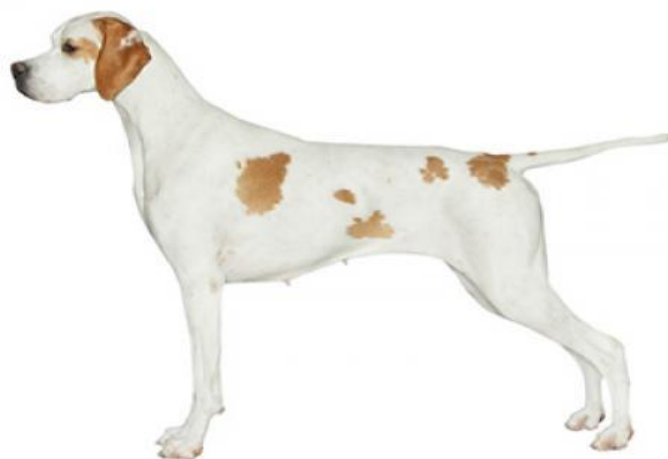
Slika 2. Engleski pointer ( https://www.purina.hr/psi/pasmine-pasa/katalog/pointer )

Promatrajući stražnji dio tijela zapaziti ćemo rep, srednje dužine no ne duži od skočnog zgloba, debeo u korijenu postupno se sužava prema vrhu, prekriven dlakom, postavljen u ravnini s leđima (ANONYMOUS, 1975). Stražnji udovi mišićavi i snažni, bedra duga, te dobro razvijena. Noga savijena u koljenu pod kutom od otprilike 130°, skočni zglob čvrst. Stražnje šape ovalne, čvrsto građene, savijeni prsti.