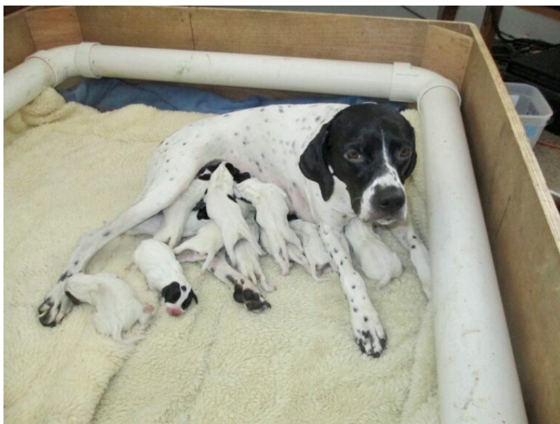
Slika 3 . Ženka engleskog pointera sa štencima

Štenad je kroz prvih deset do četrnaest dana gluha i slijepa (FABIJANIĆ, 2012), te im je potrebna toplina i hrana, mlijeko. Prelazak na „krutu hranu“, ovisno o pasmini započinje kada su štenci stari 3 do 4 tjedna, u toj dobi štenad počinje stajati, više se kretati ali i dobiva mliječne zube, te sisanja tada iritira ili šteti kuji koja se udaljava i ostavlja svoju obitelj na duži period (BOJANIĆ, 2020.).