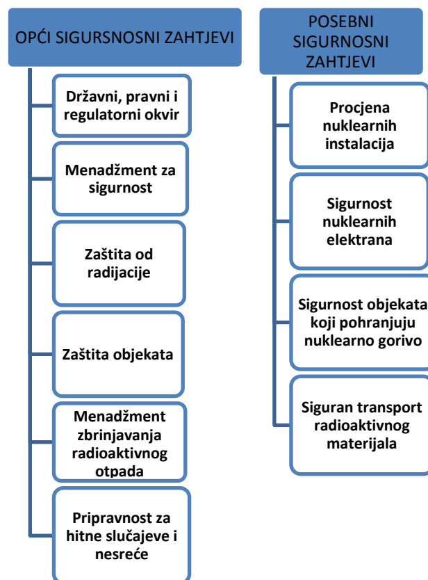
Prikaz 1 Osnovni sigurnosni elementi [14]

Prikaz 1 pokazuje osnovne sigurnosne elemente u jednom nuklearnom postrojenju.