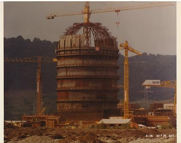
Slika 2 Završna montaža reaktorske zgrade u rujnu 1975. godine [17] PRISTUPLJENO 29.6.2022.