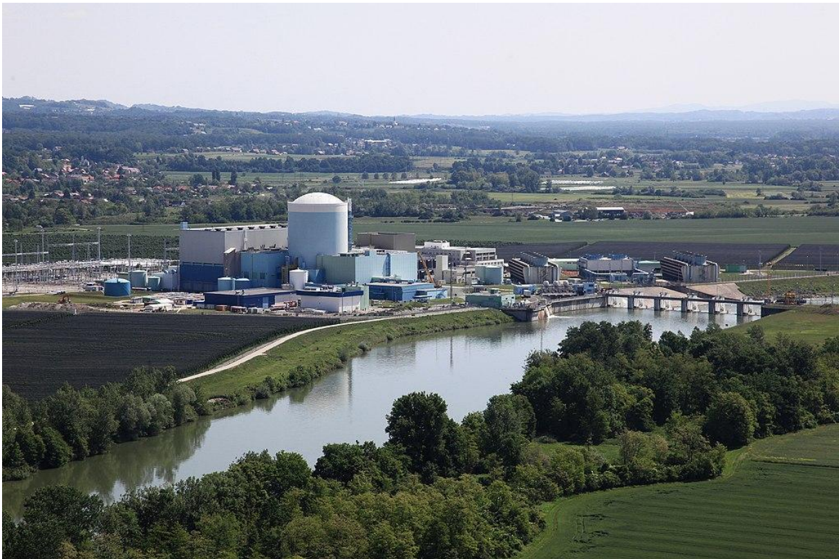
Slika 3 Nuklearna elektrana Krško [17] PRISTUPLJENO: 15.5.2022.

standardima sav neobrađeni nisko i srednje radioaktivni otpad (NSRAO) 1 , otpadni materijali i dotrajala oprema u radiološki kontroliranom području, koji je nastalo od početka pogona NEK-a 1981. godine pohranjen je u privremenom skladištu u elektrani. Ukupni volumen NSRAO-a iznosi 2405 m 3 (oko 20 m x 20 m x 6 m). Prema službenim stranica Nuklearne elektrane Krško volumen NSRAO-a smanjuje se sortiranjem, koncentriranjem, taljenjem i spaljivanjem. Spaljivanje i taljenje obavlja se u inozemstvu, a samo spaljivanje može smanjiti volumen otpada do 20 posto. U zadnjem desetljeću nastaje nešto više od 30 m 3 tog otpada godišnje. [17]