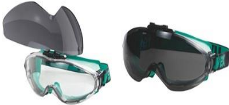
Slika 14. Zaštitne naočale [22]

Zaštitne naočale ili štitnici (slika 14) koji se koriste kod varenja služe za zaštitu očiju od odlijetanja čestica obrade ili od štetnog zračenja pri varenju [20].