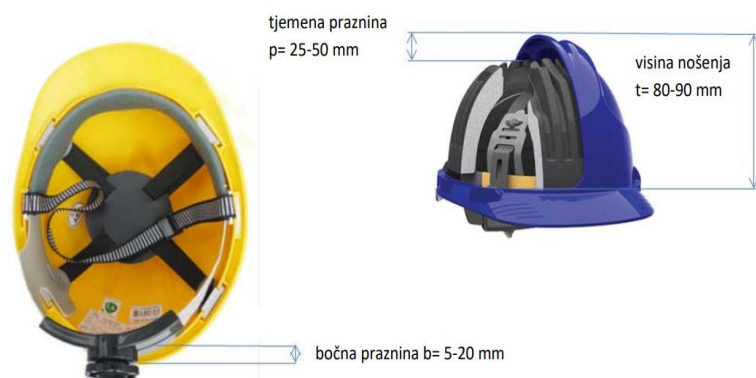
Slika 13. Zaštitna kaciga [21]

Zaštitna kaciga (slika 13) se koristi za zaštitu od pada predmeta. Zaštitna kaciga mora imati postavljenu kolijevku koja ima sposobnost podešavanja veličine s razmakom od kacige minimalno 2 do 4 cm [20].