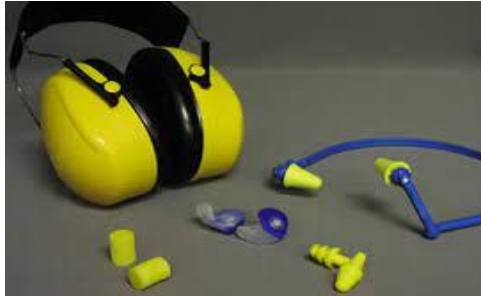
Slika 16. Zaštita sluha [24]

Koriste se na poslovima povećane buke (slika 16) gdje ju ne možemo smanjiti drugim mjerama zaštite. Najčešće se koriste zaštitne slušalice ili čepići [20].