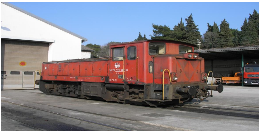
Slika 3. Manevarska lokomotiva [4]