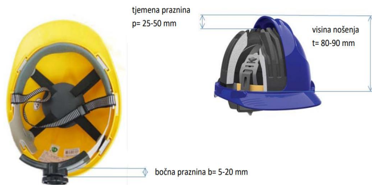
Slika 13. Zaštitna kaciga [21]

Zaštitna kaciga (slika 13) se koristi za zaštitu od pada predmeta. Zaštitna kaciga mora imati postavljenu kolijevku koja ima sposobnost podešavanja veličine s razmakom od kacige minimalno 2 do 4 cm [20].