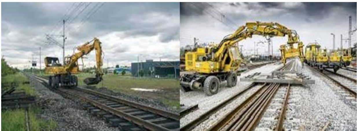
Slika 12. Dvoputni bager Atlas [18]

Bager (slika 12) je radni motorni stroj koji ima široki spektar obavljanja radova sa zemljom ili kamenom. Najčešće se koristi za radove su prijenos i podizanje tereta, iskopu, utovarivanju kamena, planiranje i grubo ravnanje terena. Osobina bagera je da se može okretati za 360°. Kupola je postavljena iznad podvozja koje može biti na gusjenicama ili gumenim kotačima, a za specijalne namijene dodaje im se željezni kotači koji se mogu kretati po tračnicama [18].