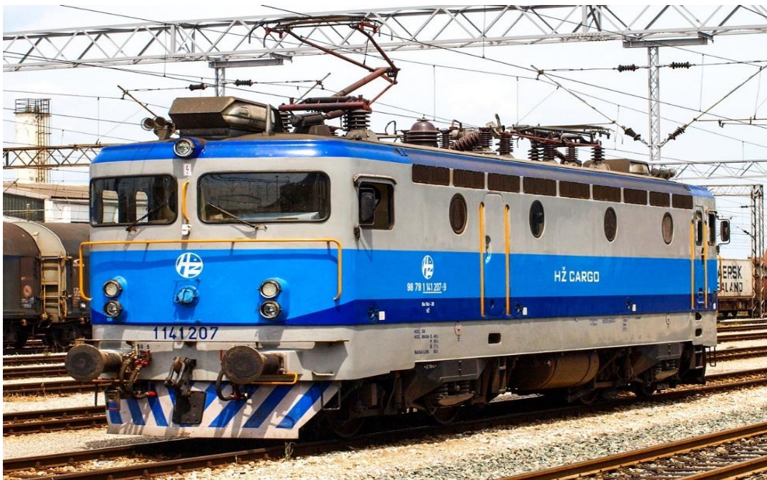
Slika 1. Putnička lokomotiva [2]