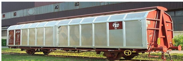
Slika 6. Specijalni vagon [7]