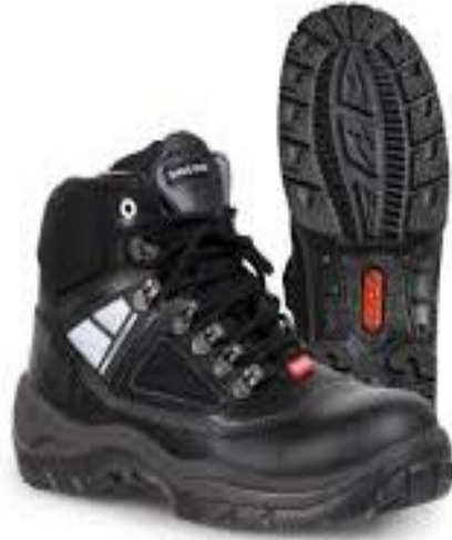
Slika 18. Zaštitne cipele [26]

Zaštitne cipele za rad, (slika 18) na kojem postoji mogućnost padanja predmeta moraju sadržavati zaštitnu kapicu koja mora biti otporna na silu od 200J. Zaštitne cipele za zaštitu od štetnog toplinskog djelovanja najčešće su napravljene od izolacijskog materijala kao što je drvo [20].