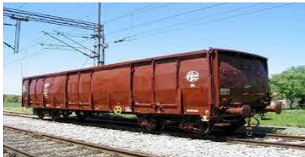
Slika 5. Teretni vagon [6]