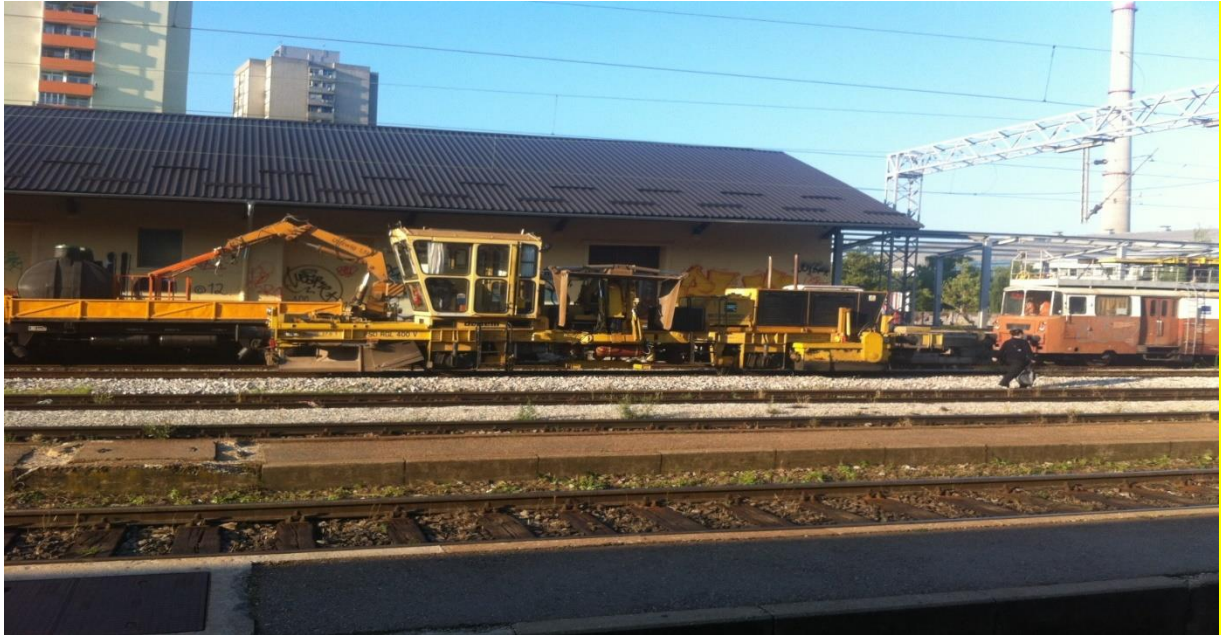
Slika 11. Plug planirka [18]

Planirka (slika 11) je stroj koji se koristi za iskrcavanje kamena i oblikovanja zastorne prizme. Planirka se koristi i kada imamo viška kamena na pragovima [18].