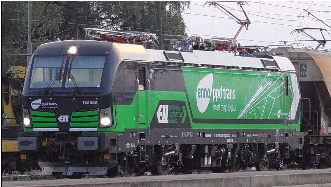
Slika 2. Teretna lokomotiva [3]