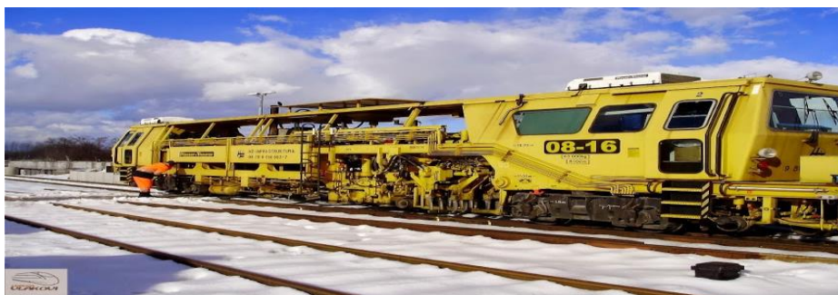
Slika 10. Podbijačica [18]

Podbijačica (slika 10) je stroj koji se koristi za reguliranje kolosijeka po smjeru i razini, a zamjenjuje rad velikog broja radnika. Postoje podbijačice za kolosijeke ili skretnice, a postoje i kombinirane. Rade na principu da krampovi na podbijačkim agregatima zbijaju kamen ispod pragova, pa se tako smanjuju rupe između kamenja, a to sprječava propadanje kolosijeka i veću stabilnost. U Hrvatskoj se redovno sve pruge podbijaju jednom godišnje [18].