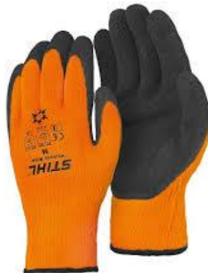
Slika 17. Zaštitne rukavice [25]

Sredstva za zaštitu ruku (slika 17) od topline i hladnoće, mehaničkih opasnosti, električne energije ili kemikalija. Rukavice napravljene od gume upotrebljavaju se za rad s kemikalijama ili za rad s uređajima pod naponom, a kod poslova zavarivanja koriste se rukavice napravljene od kože. Najčešće korištene rukavice napravljene su od bešavnih pletiva s premazima na dlanovima zbog boljeg osjeta i otpornosti na vlagu [20].