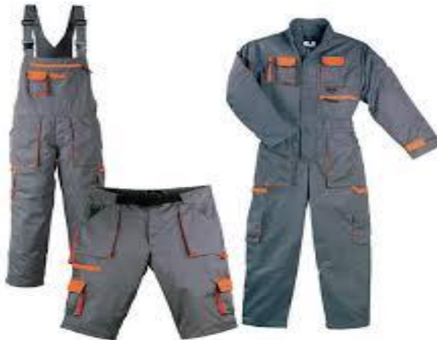
Slika 15. Zaštitno odijelo [23]

U zaštitnu odjeću (slika 15) ubrajamo zaštitu za cijelo tijelo kao što su kombinezoni ili odijela i zaštitu za neki dio tijela kao što su jakne, hlače, pregače, prsluci, kapuljače, štitnici za koljena. Radna odjeća služi za zaštitu od prljanja i prašine [20].