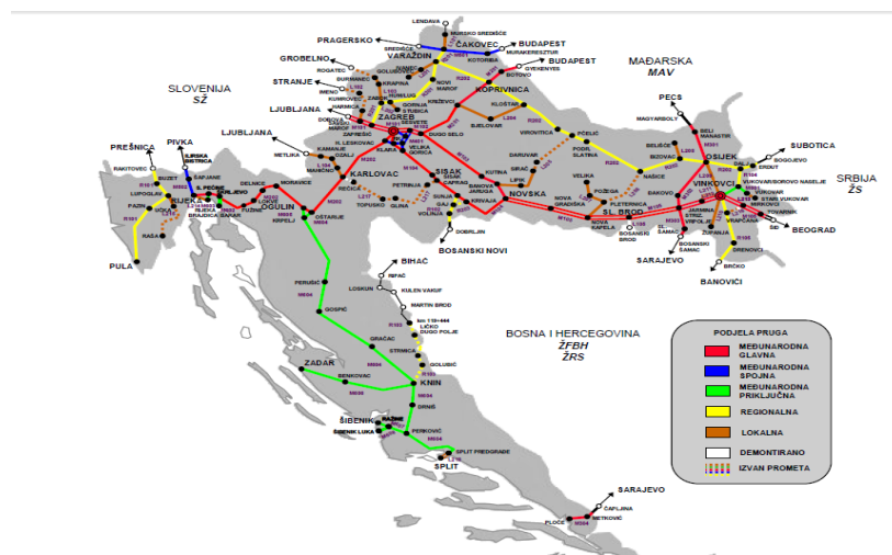
Slika 7. Prikaz željezničke mreže u Republici Hrvatskoj [9]

U današnjoj Hrvatskoj imamo više od 2970 kilometara željezničkih pruga, približno je oko 960 kilometara elektrificirano, a 248 km je s dva kolosijeka [8]. Na slici 7 prikazana je željeznička mreža u RH.