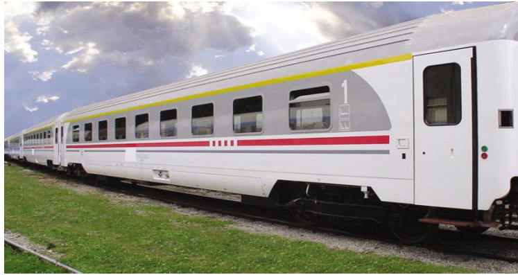
Slika 4. Putnički vagon [5]