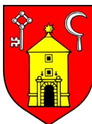
Slika 1. Grb Grada Ozlja