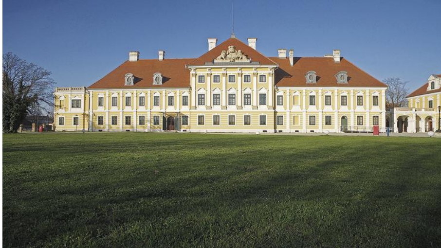
Slika 1 Dvorac Eltz u Vukovaru