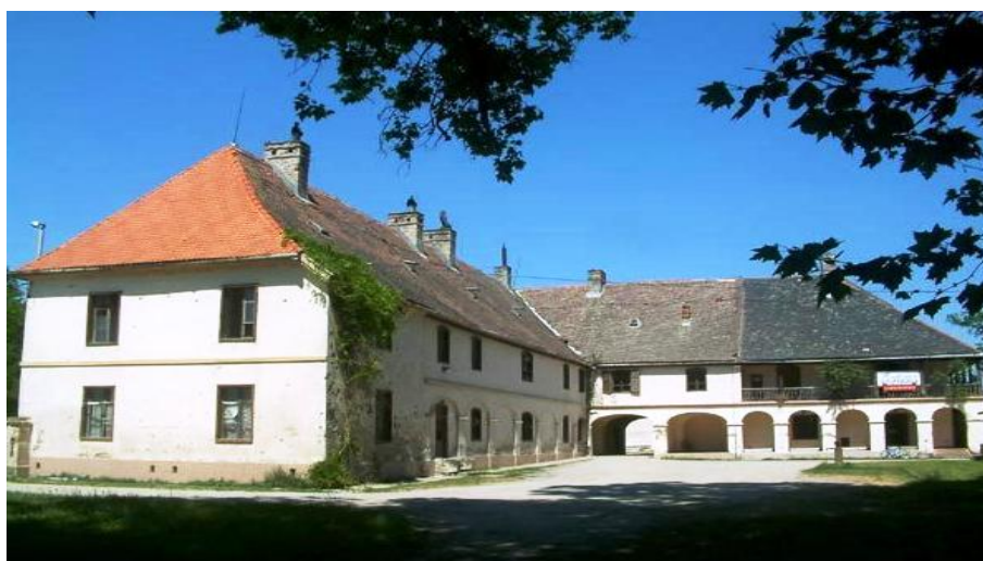
Slika 4 Dvorac Khuen-Belassi