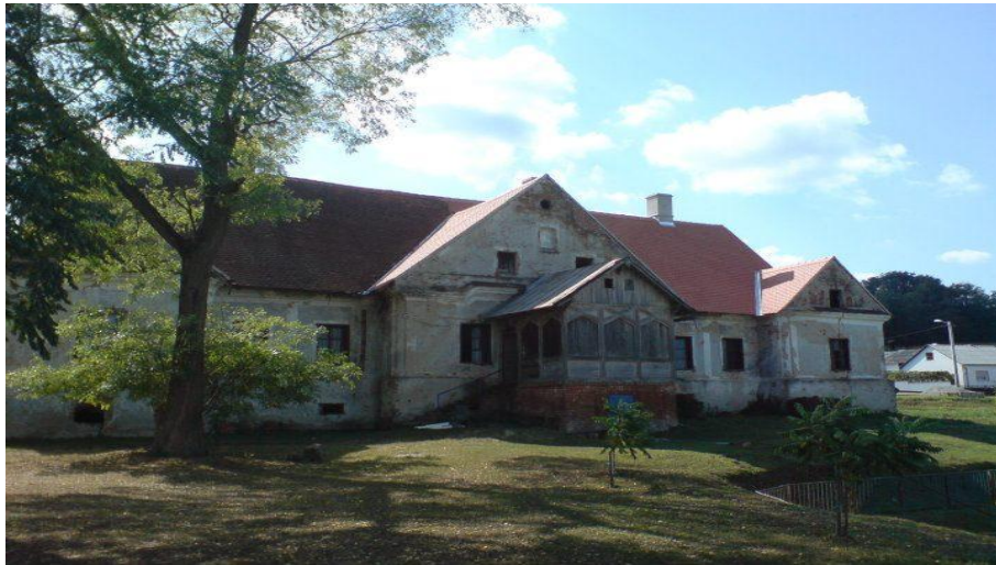
Slika 13 Kurija Kušević u Kuzmici