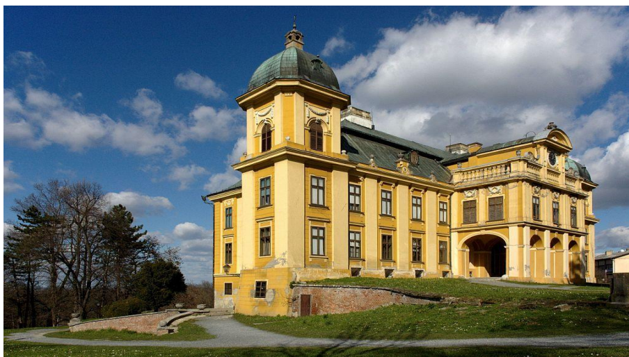
Slika 8 Veliki dvorac Pejačević u Našicama