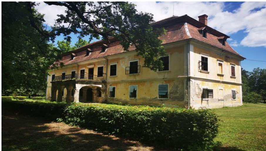
Slika 11 Trenkov dvorac u Trenkovu