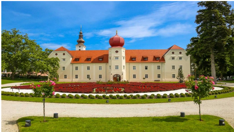
Slika 12 Dvorac Turković