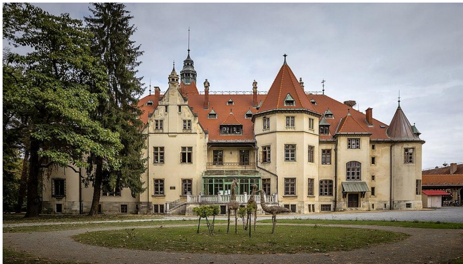
Slika 7 Dvorac Mailath

U prostorijama dvorca Mailath danas se nalaze uredi Općine te Gradsko poglavarstvo i geodetska uprava, tako da se unutrašnjost dvorca održava, ali nažalost nije dostupna za turistički pregled. No, dvorac je vrijedan posjeta i idealno je mjesto za vikend izlet, posebice u toplijim danima. 43