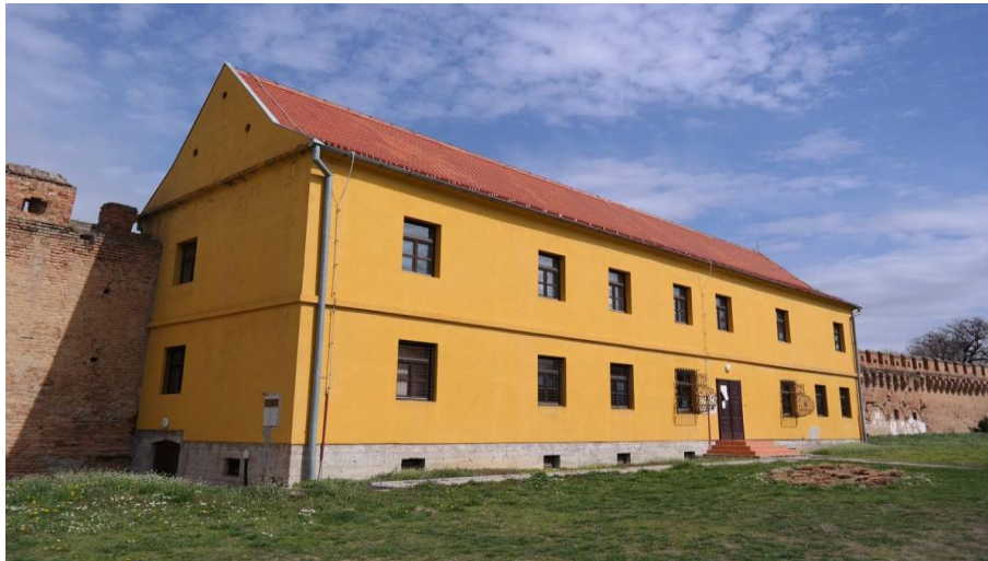
Slika 3 Kurija Brnjaković

Izvor: Metar Milimetar, https://metar-milimetar.hr/portfolio-item/interpretacijski-centar-ilok-vrata-hrvatske/ , 14.6.2022.