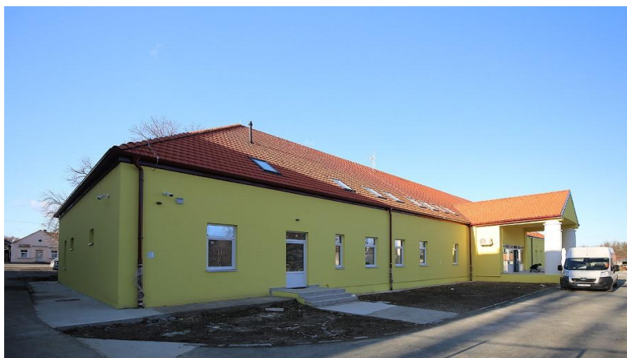
Slika 15 Kurija Mihalović u Orahovici