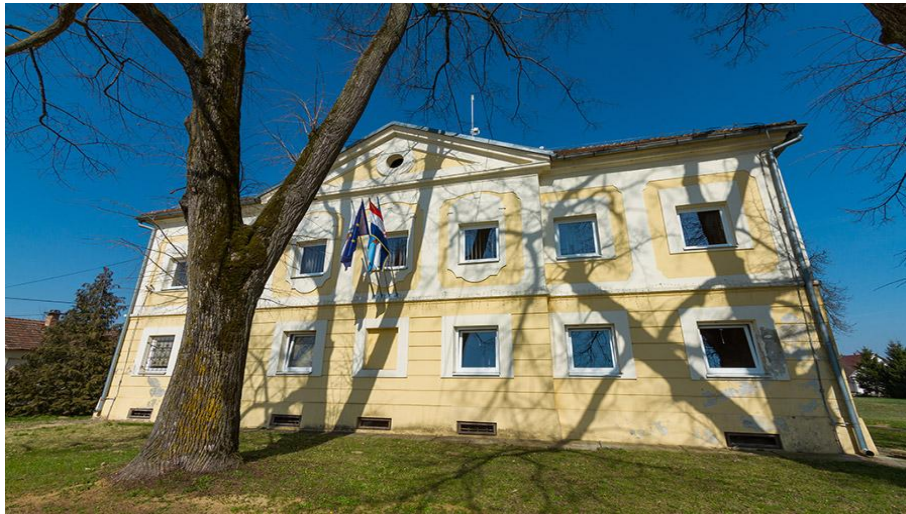
Slika 14 Kurija Špišić u Bukovici