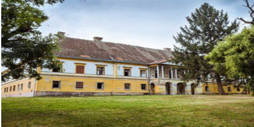
Slika 5 Dvorac Esterhazy u Dardi