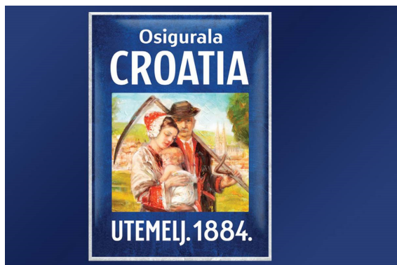
Slika 1: Croatia osiguranje 1884.

To je bila inovacija koja je obilježila osigurateljnu djelatnost i danas predstavlja temeljnu filozofiju osigurateljnog posla. 3 Edward Loyd je 1690. godine u svojoj kavani smještenoj u Tower Streetu privlačio trgovce i brodovlasnike nudeći im važne informacije iz njihova područja djelovanja i uz to osigurateljno pokriće, posebice pomorsko osiguranje. Danas je Loyd vodeći svjetski osiguravatelj i reosiguravatelj i pokriva golemo tržište od preko 200 zemalja svijeta. Osiguranje u Republici Hrvatskoj započelo je osnutkom osiguravajuće zadruge Croatia u Zagrebu 1884. godine za koju je temeljni kapital položilo zagrebačko gradsko poglavarstvo u sklopu borbe protiv ekonomske ovisnosti o strancima. U početku se zadruga bavila samo osiguranjem rizika od požara za grad Zagreb, a kasnije je proširila svoje poslovanje i na druge vrste osiguranja. 4