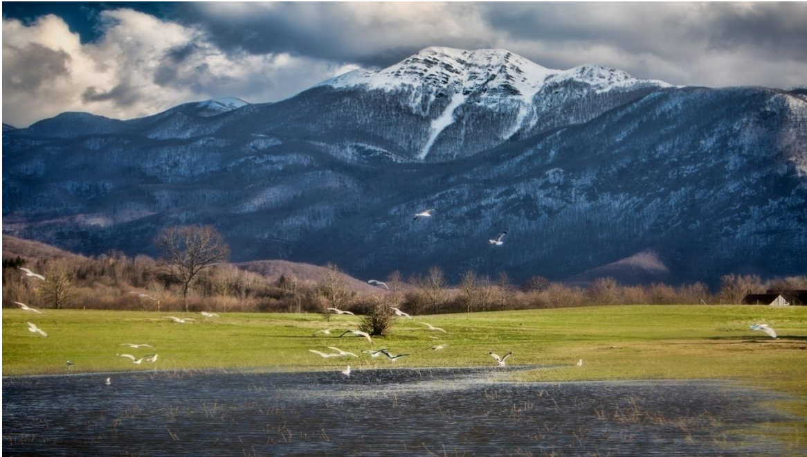
Slika 7: Velebitski vrh Visočica- Balerina