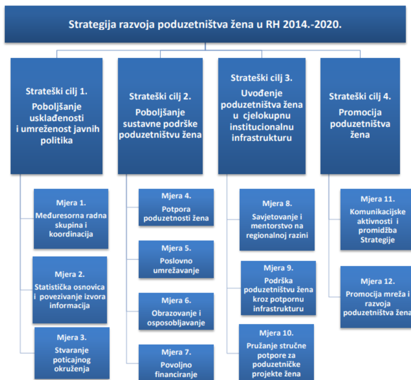
Slika 2:Strateški ciljevi Strategije razvoja poduzetništva