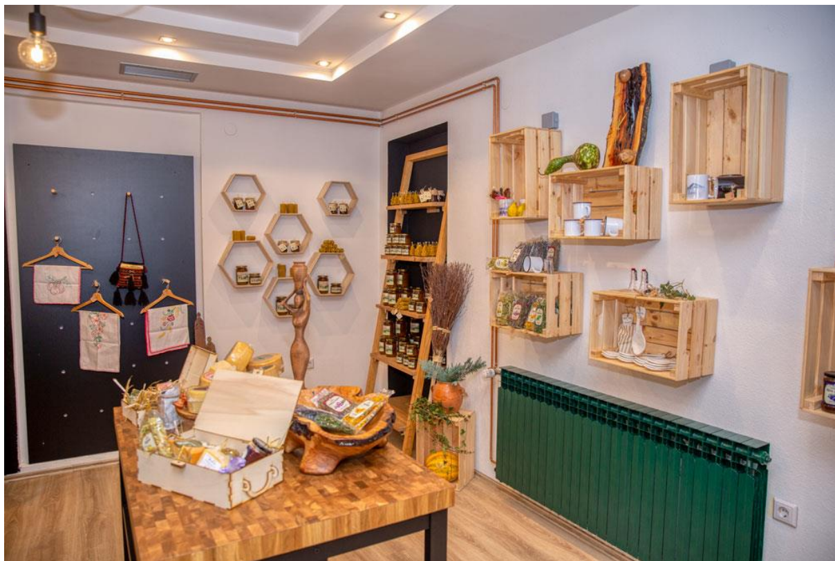
Slika 5: Ponuda suvenirnice ZERA