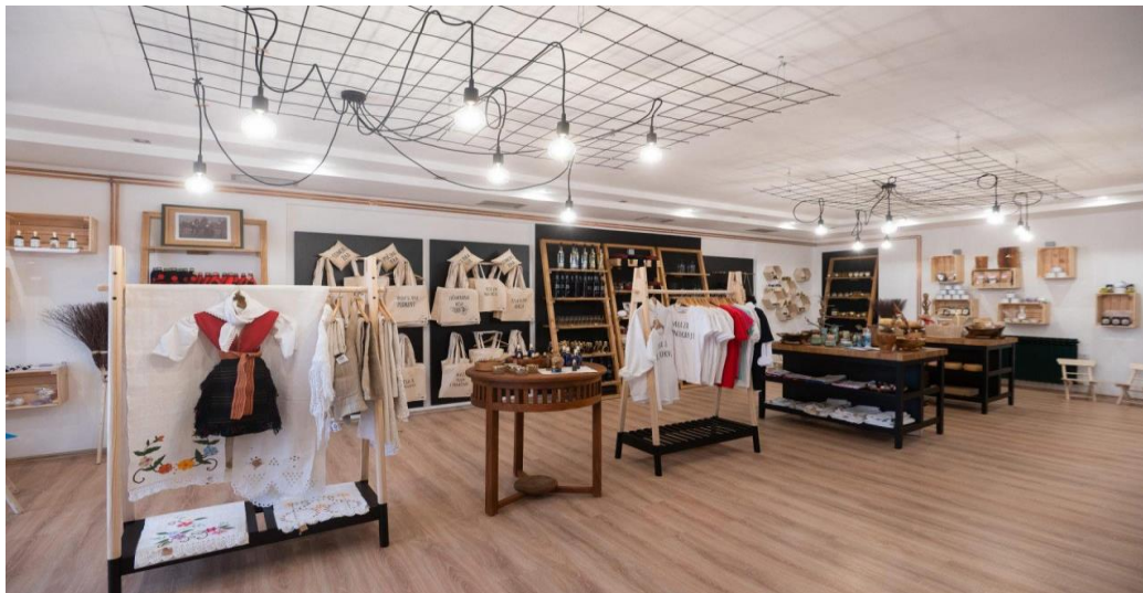
Slika 6: Ponuda lokalnih proizvoda