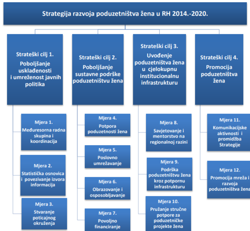
Slika 2:Strateški ciljevi Strategije razvoja poduzetništva