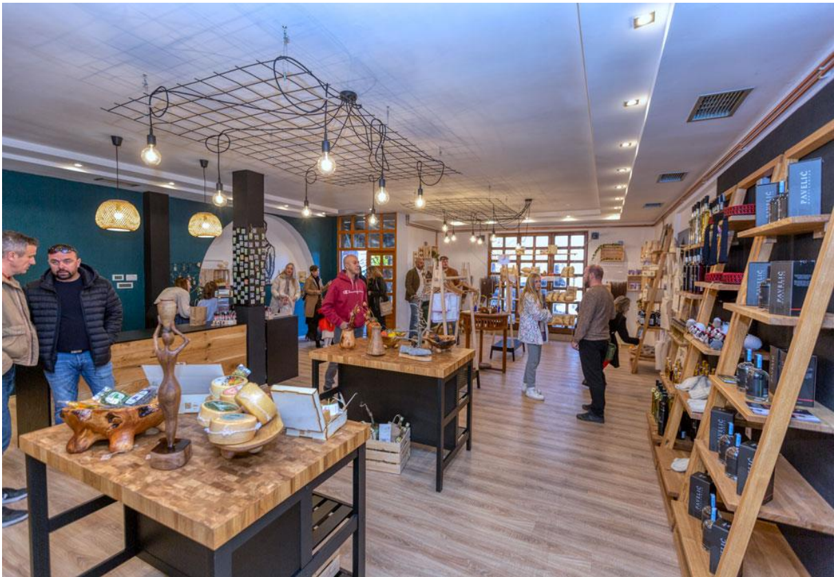
Slika 4: Izgled suvenirnice ZERA