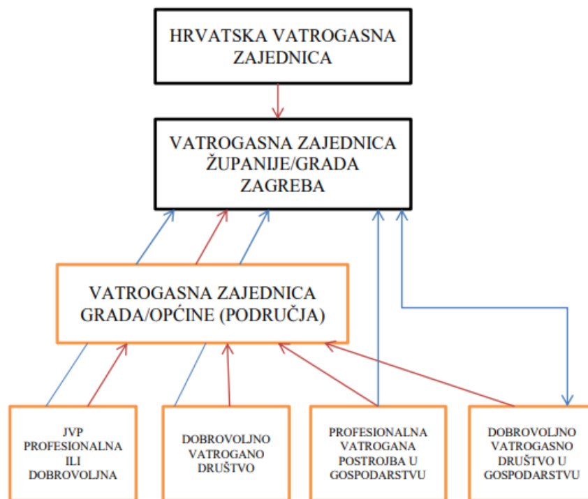
Sl. 3. Udruživanje vatrogasnih postrojbi i zajednica u RH [3]

Vatrogasna zajednica općine, grada, županije i Grada Zagreba te područna vatrogasna zajednica ima predsjednika i zapovjednika vatrogasnih postrojbi. Predsjednik vatrogasne zajednice predstavlja vatrogasnu zajednicu te skrbi o razvoju i promidžbi vatrogastva na području djelovanja vatrogasne zajednice, a bira se na način propisan općim aktom vatrogasne zajednice. Zapovjednik vatrogasnih postrojbi zajednica odgovoran je nadležnom vatrogasnom zapovjedniku za stanje organiziranosti, osposobljenosti i opremljenosti vatrogastva na području djelovanja vatrogasne zajednice. Zapovjednika i zamjenika zapovjednika vatrogasnih postrojbi zajednica imenuje nadležno tijelo vatrogasne zajednice a potvrđuje ga Načelnik ili Gradonačelnik općine, grada, županije i Grada Zagreba. Hrvatska vatrogasna zajednica ima predsjednika i načelnika. [3]