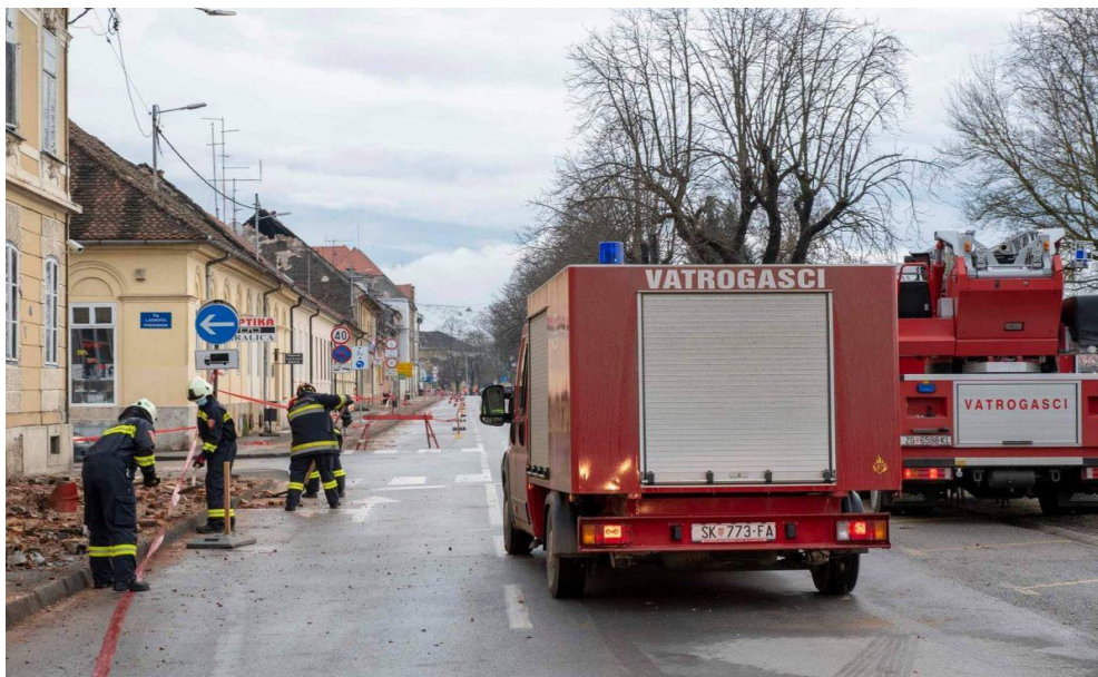
Sl. 7. Vatrogasci Javne vatrogasne postrojbe Sisak pomažu u Sisku neposredno nakon potresa 2020. godine [15]

Vatrogasne snage su odmah nakon potresa bile angažirane u izravna spašavanja ljudi zatrpanih pod ruševinama. Vatrogasci su, u suradnji s pripadnicima drugih službi, sudjelovali u spašavanju 30 osoba. Uz spašavanja osoba iz ruševina, vatrogasci su započeli s aktivnim radom na uklanjanju oštećenih dimnjaka, sanaciji krovišta, uklanjanju crjepova, osiguravanju ruševnih mjesta te drugim zadaćama u svrhu spašavanja i zaštite ljudskih života. Vatrogasne snage djeluju u 3 operativne zone (Sisak, Petrinja i Glina). Ustrojeno je i Operativno vatrogasno zapovjedništvo , koje uz koordinaciju snaga na terenu, služi kao poveznica sa svim ostalim operativnim snagama na području pogođenom potresom te kao centar za prikupljanje podataka o vatrogasnim aktivnostima.