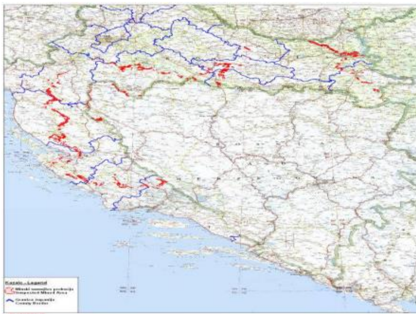
Sl. 6. Minska polja na području RH [4]

Minski sumnjivi prostor Republike Hrvatske obuhvaća 7 županija te 32 grada i općina koji su zagađeni minama i neeksploziranim eksplozivnim sredstvima, što je površina od ukupno 183.6km 2 . [7] Pretpostavlja se da je na tom prostoru oko 64.000 mina. Sva minska sumnjiva područja u Republici Hrvatskoj označena su na zemljopisnoj karti (Sl. 6) i oko svakog minskog polja nalaze se znakovi upozorenja kako bi građani i svi oni koji bi se našli u blizini takvog prostora znali udaljiti te spriječiti eventualno ozljeđivanje i pogibelj. Ukupno minski sumnjivo područje Republike Hrvatske obilježeno je s 6.912 oznaka upozorenja na minsku opasnost. [7]