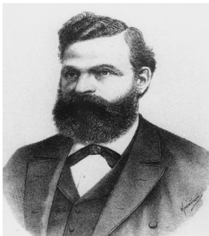
Sl. 1. Djuro Stjepan Deželić [3]

Gjuro Stjepan Deželić (Sl. 1) bio je vrlo zanimljiva ličnost te jedna od najangažiranijih osoba u brojnim područjima, a posebice u području vatrogastva u razdoblju druge polovice 19. i početka 20. stoljeća u Zagrebu. Smatra se ocem hrvatskog vatrogastva. Gjuro Stjepan Deželić rođen je u Ivanić Gradu 25. ožujka 1838. godine. Pučku školu završio je u Ivanić Gradu, gimnaziju u Zagrebu, a 1862. godine studirao je pravo te obnašao dužnost počasnog bilježnika Županije zagrebačke. Godine 1869. postao je gospodarski izvijestitelj u Zagrebačkom gradskom poglavarstvu. [2]