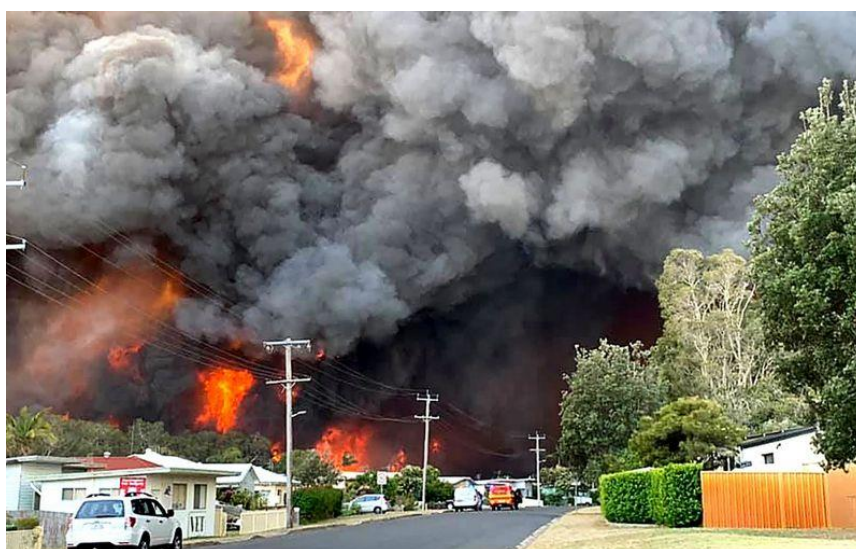
Slika 4. Požar u Australiji 2019 [16]

Gotovo svake godine Australiju zahvate katastrofalni požari, jednim od uzrok takvih požara smatra se izrazito sušna i topla razdoblja, gdje temperature prelaze 40°C. Uslijed klimatskih promjena temperature i suše su svakom godinom sve izraženije, a požari sve većih razmjera. Dva požara koji su imali najgore posljedice dogodili su se tijekom veljače i ožujka 2009. te 2019./2020. godine. (slika 4.)