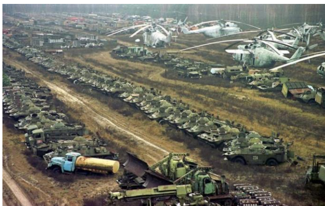
Slika 7. Pohranjena mehanizacija [24]

U radijusu oko 30 kilometara od elektrane proglašena je zona isključenja gdje i danas nakon 36 godina postoji rizik za zdravlje. Sva mehanizacija koja je korištena na sanaciji područja nuklearne nesreće, pohranjena je unutar zone isključenja radi velikog ozračenja.[21] (slika 7.)