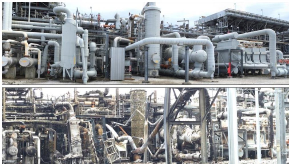
Slika 2. Usporedba požarom stradale kompozicije (dolje) i identične požarom netaknute kompozicije (gore) za preradu sirovog plina [9]

Posljedice tehnoloških akcidenata kritične infrastrukture mogu biti značajne od oštećenja imovine, onečišćenja okoliša, obustave proizvodnje i distribucije određenih proizvoda i usluga do ozljeda, bolesti i smrtnih stradanja zaposlenika, okolnog stanovništva te drugih osoba.