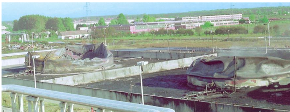
Slika 3. Spremnici goriva u TE-TO Osijek nakon požara uzrokovanog ratnim razaranjem [10]

Posljedice namjernih razaranja mogu biti stvaranje straha i panike među stanovništvom, ugrožavanja opstojnosti i sigurnosti funkcioniranja presudno važnih sustava koji čine dijelove kritične infrastrukture što uzrokuje nemogućnost proizvodnje, prometa i isporuka životnih namjernica, vode, električne energije, plina, nemogućnost komunikacije, nemogućnost djelovanja žurnih službi te ostalih za život bitnih sustava.[4] (slika 3.)