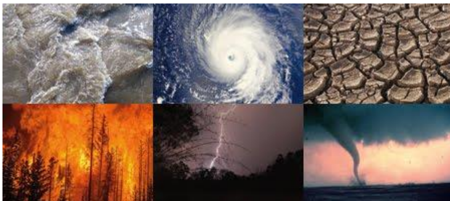
Slika 1. Prirodne katastrofe [6]

Prirodne katastrofe nastaju djelovanjem prirodnih sila te djelovanjem tih sila mogu nastati: požar, potres, poplava, suša, olujna nevremena, orkanski vjetrovi, odroni i klizanje tla, vulkanske erupcije, snježne lavine i slično.[5] (slika 1.)