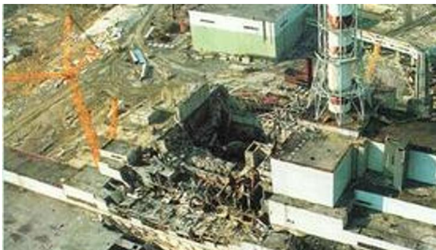
Slika 6. Nuklearna elektrana u Černobilu nakon nesreće [22]

Najveća nuklearna nesreća, odnosno eksplozija uzrokovana tehnološki akcident kritične infrastrukture, dogodila se 26. 04. 1986. u nuklearnoj elektrani „Memorijalnoj elektrani Vladimir Iljič Lenjin“ koja se nalazi u blizini grada Černobil, te je nakon nesreće poznata kao Černobilska elektrana.[21] (slika 6.)