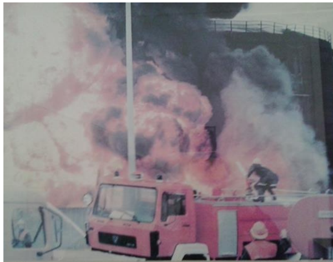
Slika 8. Požar na spremniku goriva u TE-TO Osijek uslijed ratnih razaranja [26]

Ratna razaranja i terorizam su najznačajnija namjerna razaranja kritične infrastrukture, isto se odnosi i na namjerno uzrokovane požare. Cilj ratnih razaranja i terorizma, u koje se ubraja i uzrokovanje požara, je onesposobljavanje protivnika i uništavanje njegove kritične infrastrukture, odnosno vitalnih i ključnih sustava, kako bi ga se što prije i što lakše onesposobilo. Najčešće mete ratom i terorizmom izazvanih požara su: skladišta goriva, vojna skladišta, zračne luke, proizvodni pogoni električne i toplinske energije i slično. (slika 8.)