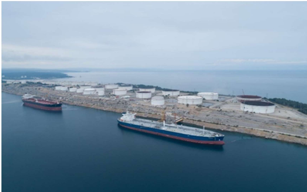
Sl. 2. Terminal Omišalj [2]