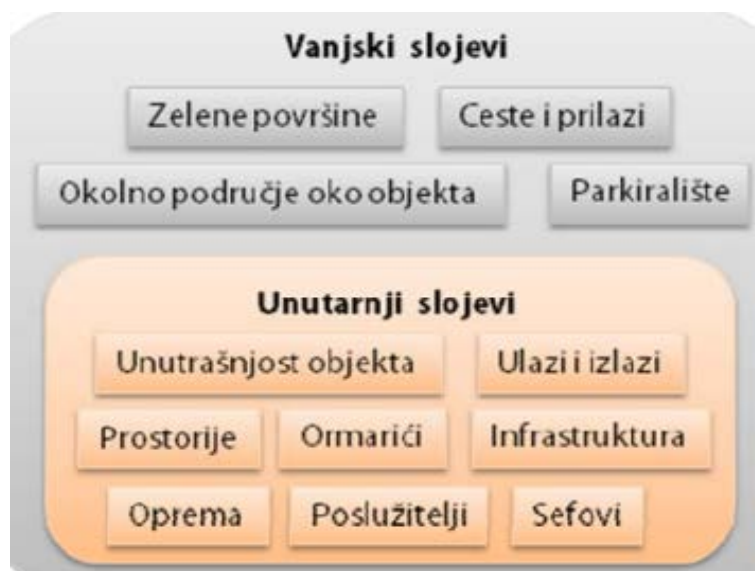
Slika 6. Slojevita fizička sigurnost [6]

slojevi zaštite uključuju mjere primijenjene u uredima, na ulazu u objekt i sl. Usmjeravaju se na zaštitu svih unutarnjih dijelova objekata i imovine. [6]