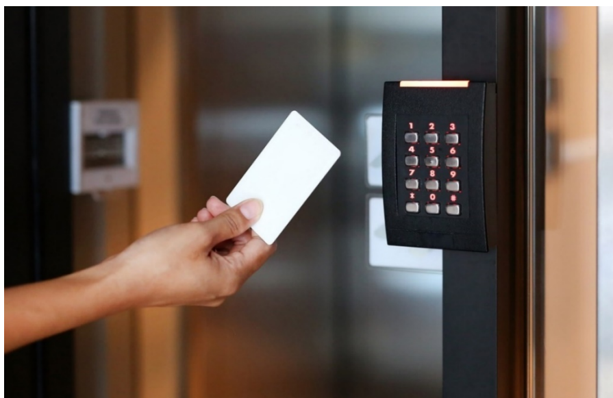
Slika 10. Kontrola pristupa autentifikacijskom pametnom karticom [14]

pristupne kartice su elektroničke kartice koje identificiraju nositelja kartice za fizički sustav kontrole pristupa. Pristupni mehanizam za uređaje ili sobe osigurane čitačem kartica provjerava valjanost korisničke kartice u bazi podataka koja ima skup valjanih kartica i nakon toga otvara brave na sustavu ili sobi. Kartice se mogu opremiti magnetnim trakama, crtičnim kodovima, čipovima ili drugim sustavima za povezivanje s čitačem kartica. Fizičke pristupne kartice uglavnom koriste firme organizacije, uključujući sveučilišta i vladine organizacije, a mogu imati prednost korištenja postojeće infrastrukture za podršku stvaranja sigurnih pristupnih soba za istraživače koji primaju administrativne podatke. Za razliku od biometrijske autentifikacije, pristupne kartice se mogu lako izgubiti ili dati drugima pri čemu imaju veći potencijal za zloupotrebu. Stariji sustavi također mogu biti osjetljivi na napade kloniranja u kojima se magnetska traka kopira na neovlaštenu karticu. Zaštita samih pristupnih kartica prvenstveno je pitanje politike i obuke. [2] Takav postupak je vrlo jednostavan i široko raširen upravo zbog lakoće korištenja pametnih kartica. Osim karticama, identifikacija zaposlenika može se provoditi nekim sofisticiranijim načinima, kao što je biometrijska kontrola pristupa. Tu spadaju metode skeniranja otiska prsta, primjer otiska prsta prikazan na slici 10, prepoznavanja lica, šarenice oka ili glasa te skeniranje rasporeda vena na ruci. [6]