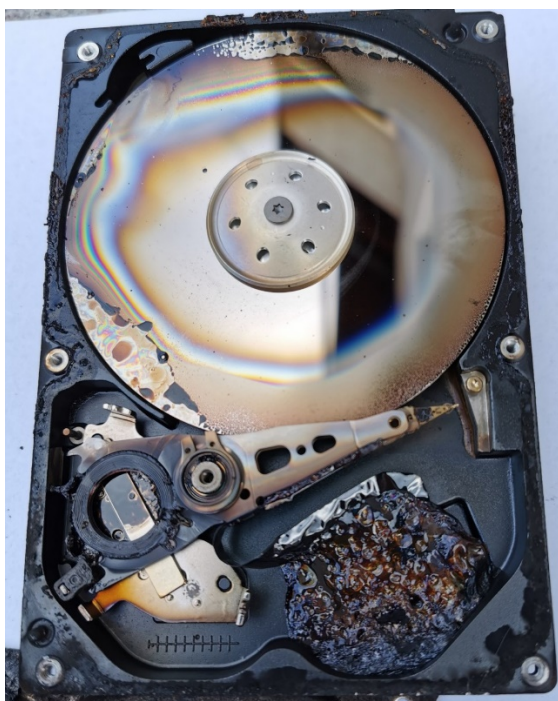
Slika 1. Oštećenje tvrdog diska pod utjecajem visoke temperature [9]

Širok raspon pogrešaka može izazvati fizičko oštećenje medija za pohranu. CD/DVD mediji mogu imati izgrebenu podlogu, tvrdi disk može biti oštećen prilikom pada, nedopušteno visoka temperatura može oštetiti tvrde diskove (slika 1), a trake za pohranu mogu jednostavno puknuti. Ipak, kao jedan od najčešćih problema u računalima javlja se oštećenje tvrdog diska glavom za čitanje/pisanje. [7]