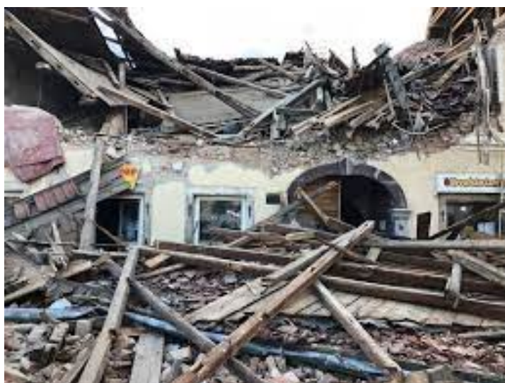
Slika 3. Prikaz potresa [10]