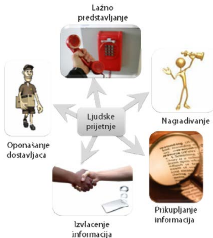
Slika 5. Vrste napada u domeni socijalnog inženjeringa [6]

Općenito, napadi su uspješniji ako ne postoji definirana sigurnosna politika te nije provedena edukacija zaposlenika o opisanim opasnostima. Ukoliko su uspješno izvedeni, mogu uzrokovati velike gubitke za neku organizaciju poput otkrivanja osjetljivih podataka o zaposlenicima, partnerima i kupcima, zatim gubitka nacrti i planova za nova poslovanja i proizvode i sl. [6]