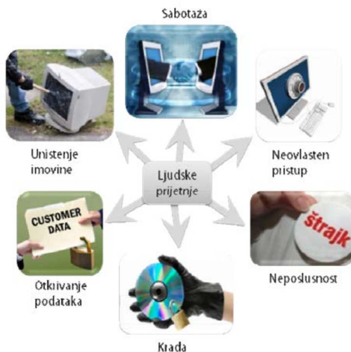
Slika 4. Ljudske prijetnje [6]

špijunaže i sl. Ljudski faktor čini ključnu ulogu u postizanju sigurnosti, a kako bi se ostvarila zaštita od navedenih prijetnji potrebno je brojne mjere implementirati i na samoj fizičkoj razini. [6]