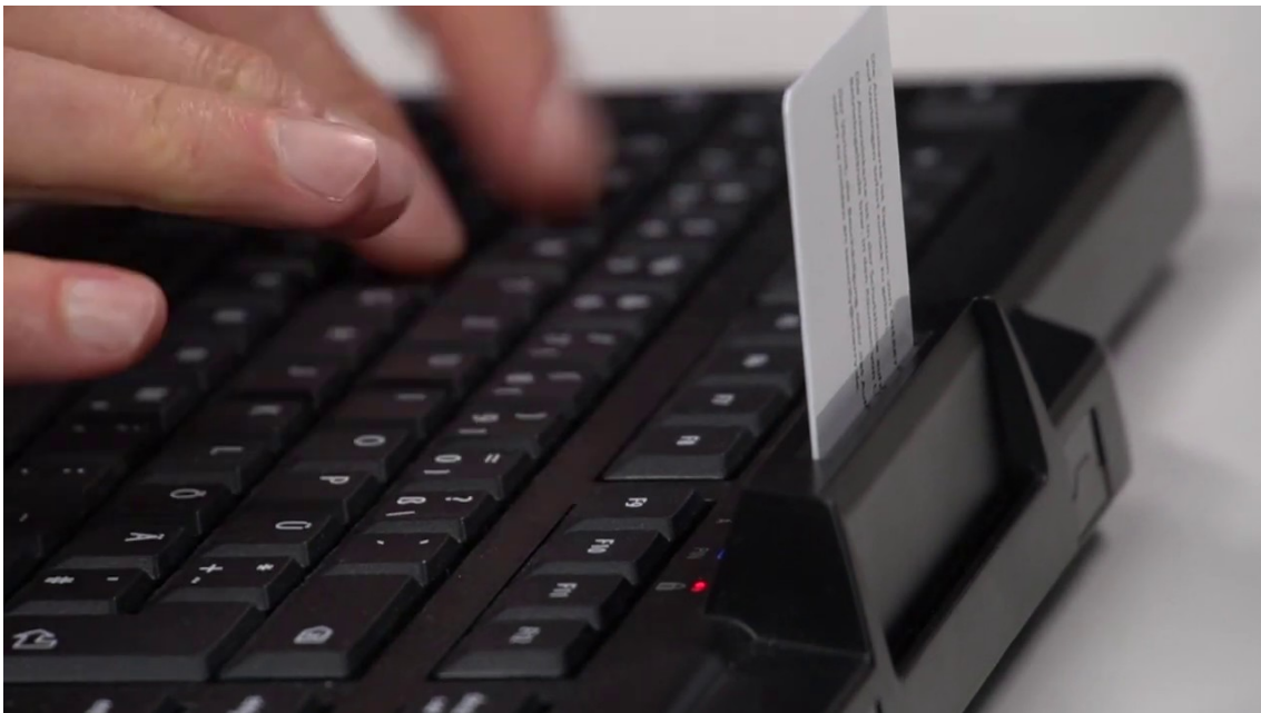
Slika 13. Kontrola pristupa s pametnim karticama [17]

Osim pametnih kartica razvijeni su uređaji koji obavljaju kontrolu pristupa identificiranjem osoba preko određenih bioloških karakteristika. Riječ je o