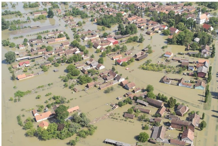
Slika 2. Prikaz poplave [10]