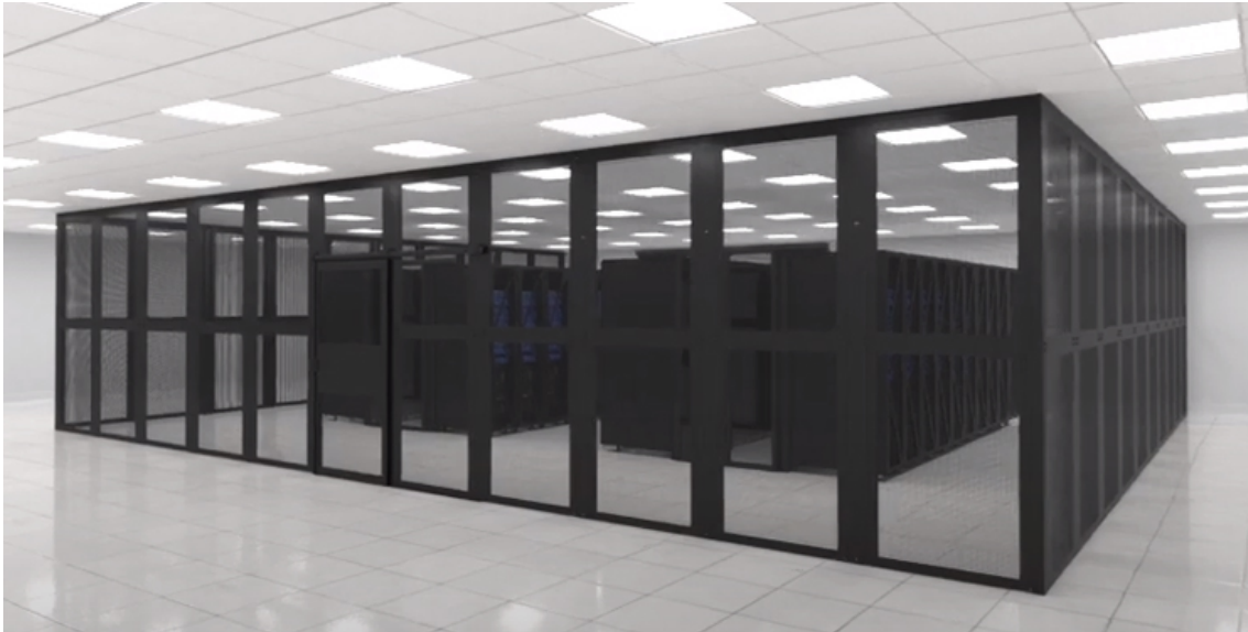
Slika 8. Zaštita poslužitelja [12]