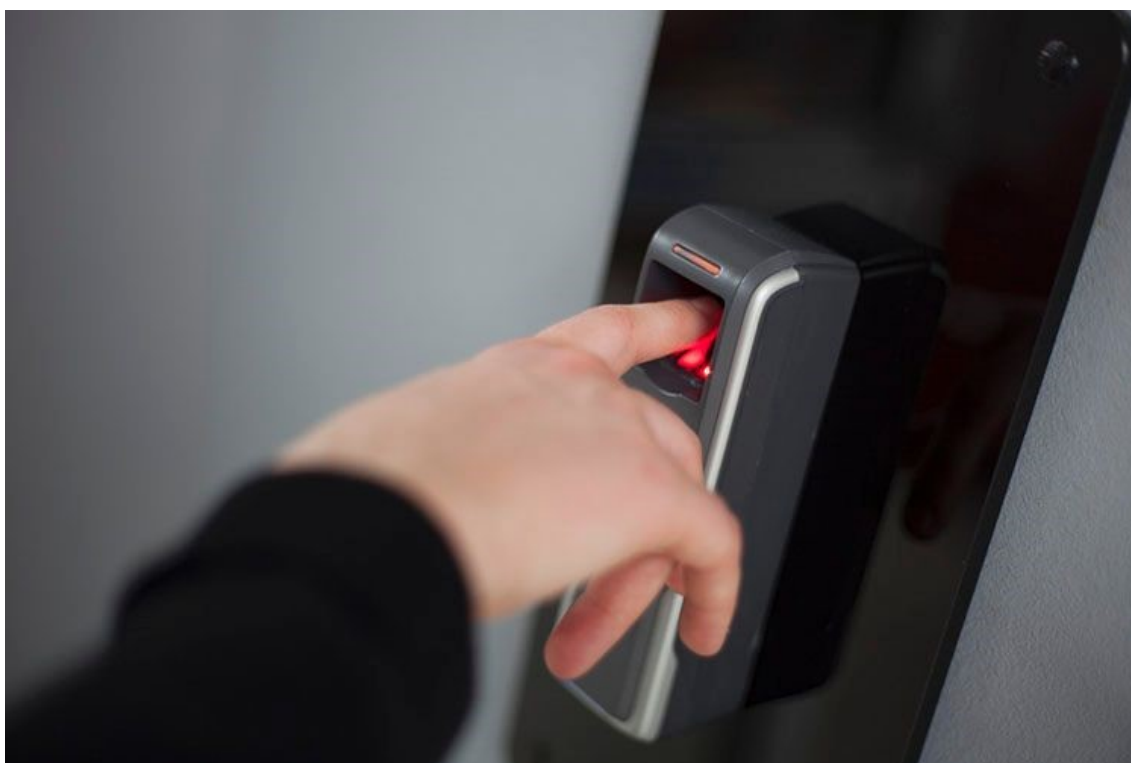
Slika 14. Kontrola pristupa preko biometrije [18]

2. Ponašajne – odnose se na ponašanje osoba, a uključuju ritam, hod ili glas. Uređaji za kontrolu pristupa zasnovani na biometriji uključuju provjeru jedne ili više fizioloških i ponašajnih osobina. [6]