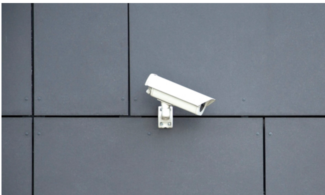
Slika 7. Nadzorna kamera [11]

potencijalni prijestupnici imaju osjećaj povećane kontrole i ograničenja na mogućnost bijega. Mjere prirodnog pristupa kontroliraju granice kako bi se jasno razlikovao prostor javnog i privatnog vlasništva. Selektivnim postavljenjem ulaza i izlaza, ograda, rasvjete i krajobraza ograničava se pristup i pregled područja. Teritorijalno pojačavanje promiče društveni nadzor kroz definiranje vlasničke zbrinutosti. Stvaranjem razdvojenosti javnog i privatnog prostora, postiže se osjećaj vlasništva nad privatnim. Vlasnici imaju interes zaštititi svoju imovinu, a uljeze je lakše identificirati. [6]