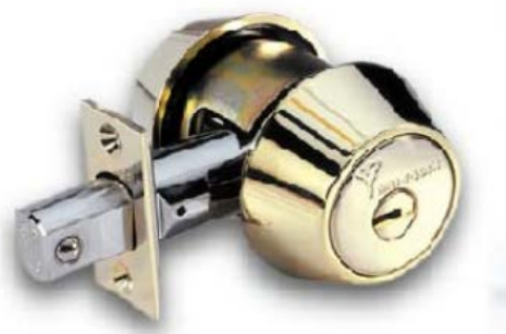
Slika 15. Mehanički lokot [20]

Lokoti su mehanički ili elektronički uređaji koji se otvaraju fizičkim objektom poput ključa, kartica i sl., tajnom informacijom poput lozinke ili njihovom kombinacijom. Osnovna namjena im je sprječavanje fizičkog pristupa nekom dobru ili imovini, a mogu se koristiti na vratima, prozorima, ormarićima ili uređajima. Ovisno o njihovom dizajnu i implementaciji moguće je pružiti različitu razinu sigurnosti. Mehanički lokoti, primjer mehaničkog lokota prikazan na slici 15, imaju pomične dijelove kojima se rukuje bez električnog pogona. Za razliku od njih, elektronički lokoti, primjer elektroničkog lokota prikazan na slici 16, sadrže skenere koji služe za očitavanje kodova te komponente za provjeru identiteta. Postoje brojne inačice spomenutih vrsta lokota.