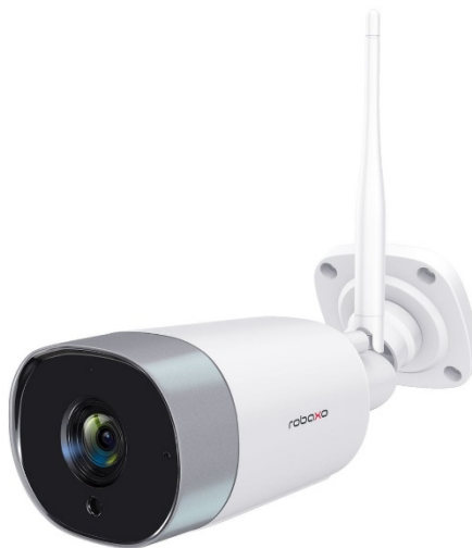
Slika 12. IP nadzorna kamera [16]