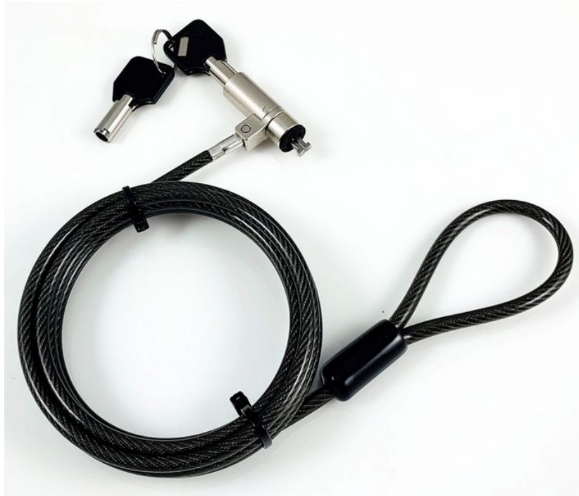
Slika 17. Zaštitna sajla za zaključavanje [21]

Pri odabiru takvih ormarića potrebno je voditi računa o: