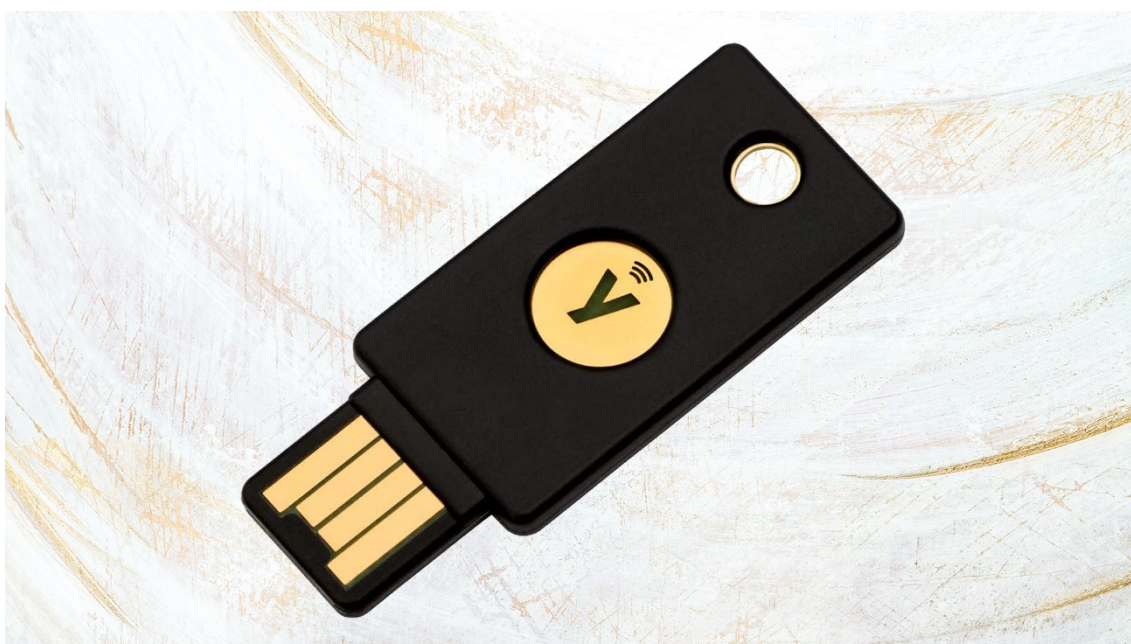
Slika 9. USB sigurnosni ključ [13]

korisnici upotrebljavaju isti prijenosni uređaj za pohranu podataka. Sprječavanje krađe može se postići i nekim sofisticiranim uređajima. Neki od njih su lokoti za zaključavanje kabela te sustavi za praćenje i otkrivanje lokacije ukradenih ili izgubljenih stvari. Također, postoje posebni držači za prijenosna računala koji imaju mogućnost zaključavanja. Ukoliko takvi uređaji nisu dostupni, moguće je ugraditi ormariće s lokotima za sigurnu pohranu prijenosnih računala. Sigurnost digitalnih podataka dodatno se može povećati implementacijom zaključavanja USB priključaka, kako bi se spriječilo preuzimanje podataka ili onemogućilo umetanje zlonamjernih programa USB sigurnosni ključ prikazan na slici 9. [6]