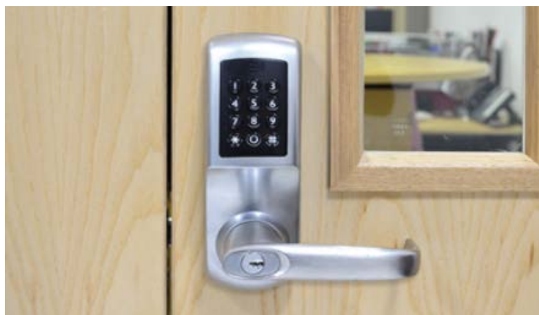
Slika 16. Električni lokot [19]