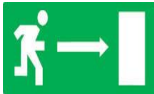
Slika 2. Plan evakuacije i spašavanja