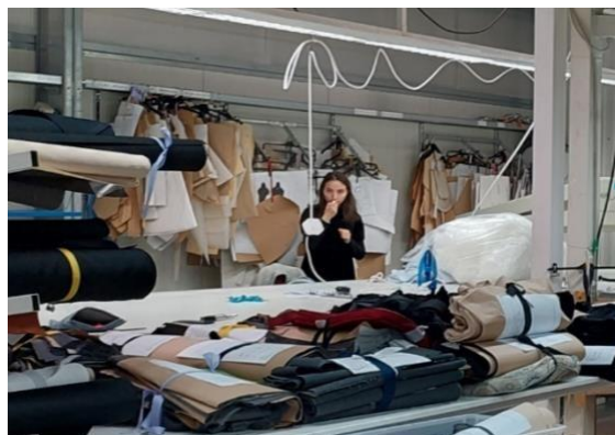
Slika 8. Radnica na radnoj poziciji slaganja

Radnica na radnoj poziciji slaganja prikazana je na slici 8.