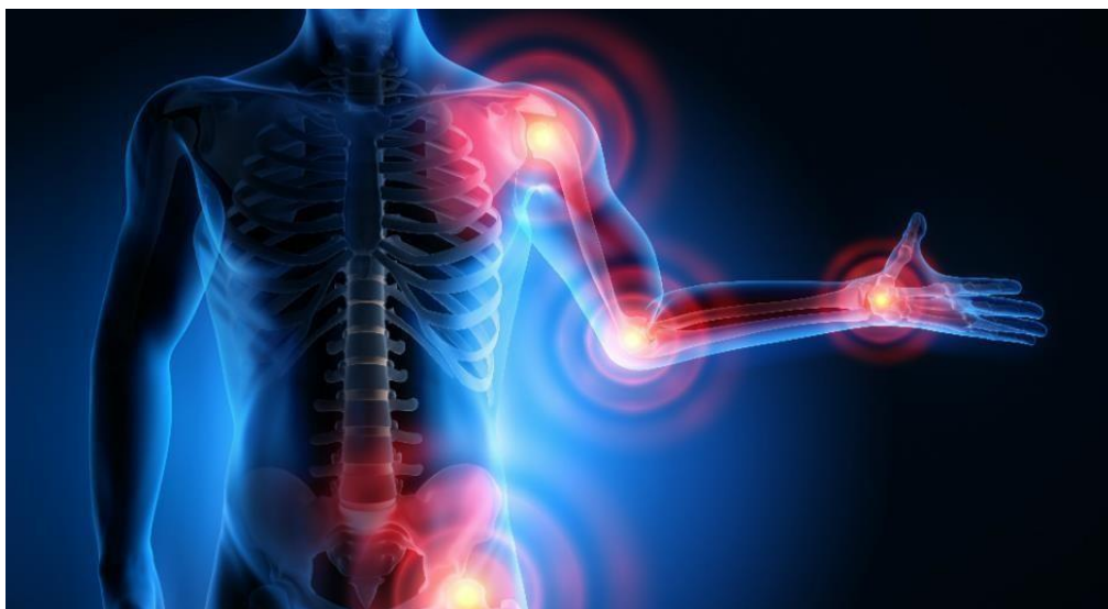
Slika 3 - Prikaz najčešćih mjesta nastanka mišićno-koštanih oboljenja

tehnologije, ergonomije i zdravstvene zaštite. Na slici 3. prikazana su najčešća mjesta nastanka mišićno-koštanih oboljenja.