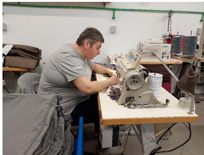
Slika 5. Radnica na radnoj poziciji šivanja

Šivanje je, pak, tehnika povezivanja dijelova materijala pomoću igle i konca. Radnica na radnoj poziciji šivanja prikazana je na slici 5.