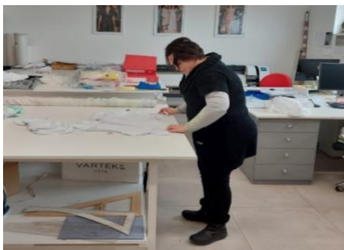
Slika 4. Radnica na radnoj poziciji krojenja

Krojenje je prva faza u procesu, a obuhvaća polaganje krojenih naslaga te izrezivanje krojenih dijelova i njihovo sortiranje. Pri krojenju se koriste stabilni loženi i ručni prijenosni nož. Na slici 4. prikazana je radnica na radnoj poziciji krojenja.