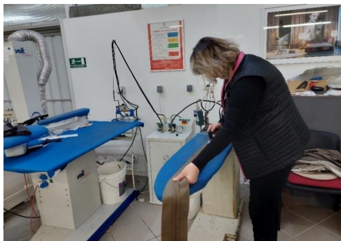
Slika 7. Radnica na radnoj poziciji peglanja

Sljedeća je radna pozicija peglanje. Radnica na radnoj poziciji peglanja prikazana je na slici 7.