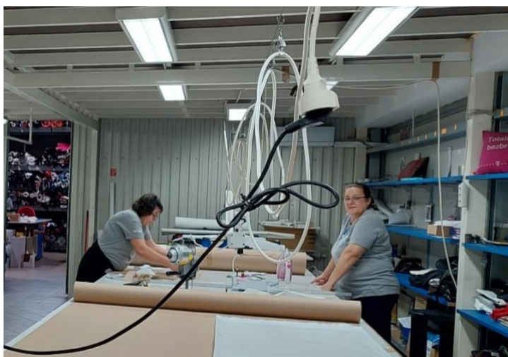
Slika 6. Radnice na radnoj poziciji kontrole

Kontrola kvalitete su postupci kojima se detaljno preispituje kvaliteta svih čimbenika u proizvodnji. Radnice na radnoj poziciji kontrole prikazane su na slici 6.