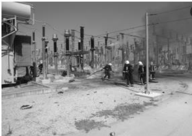
Slika 5. Požarište na visokonaponskom postrojenju TS 110/10710 kV Dubovac [7]

postrojbi. Tijekom procesa gašenja strogo poštivana su pravila i mjere vezane uz radnu disciplinu te sva interna pravila pri radu na elektroenergetskim postrojenjima, konkretno trafostanicama, a u skladu s odredbama zakona te podzakonskih propisa koji vrijede na području Republike Hrvatske.