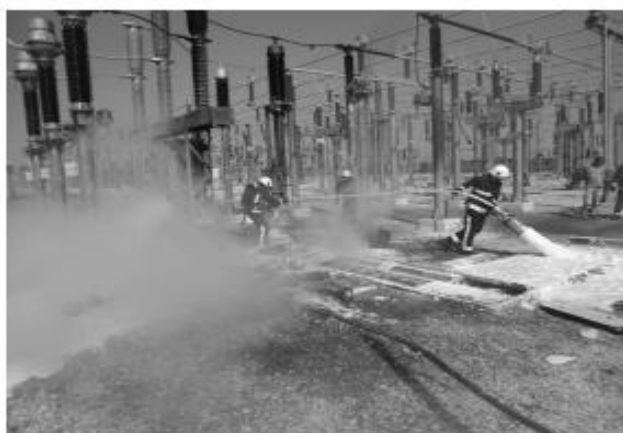
Slika 6. Gašenje požara energetskih kabela na TS 110/10/10 kV Dubovac pjenom [7]

Nakon što se požar uspješno lokalizirao, ubrzo se ponovno razbuktio jer gašenje požara suhim prahom kategorije ABC ipak nije bilo u dovoljnoj mjeri učinkovito, pa se pristupilo pregledu kanala s energetskim kabelima. Pregledom istog je uočena tekućina nepoznatog sadržaja. Pripadnici vatrogasne postrojbe Grada Karlovca pretpostavili su da se radi o tekućini koja je dijelom voda, a dijelom transformatorsko ulje proliveno uslijed eksplozije mjernog transformatora. Odlučeno je da se kao sredstvo za gašenje požara upotrijebi pjena Foam-pro u ekspanziji 200. Slika 6 prikazuje gašenje požara energetskih kabela na TS 110/10/10 kV Dubovac pjenom.