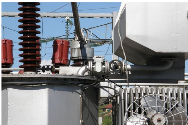
Slika 4. Buchholz relej na TS 110/10/10 kV Dubovac [4]

Buchholz relej na transformatoru TS 110/10/10 kV Dubovac ima ugrađen konzervator koji služi kao prostor za redovno pogonsko „disanje“ transformatorskog ulja koje nastaje zbog promjene volumena ulja uvjetovanog njegovim zagrijavanjem i hlađenjem. Relej ima funkciju signalizacije (alarmiranja) te isključenja transformatora iz pogona (blokada). Do alarmiranja dolazi uslijed porasta volumena plinova u gornjem dijelu kućišta releja tijekom vremena, koji se zatim stvaraju u kotlu transformatora i na putu prema konzervatoru budu zarobljeni u kućištu releja. Plinovi nastaju kao posljedica vrtložnih struja, parcijalnog izbijanja i lokalnog pregrijavanja [4].