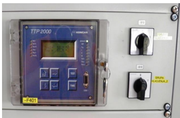
Slika 3. Termo slika na TS 110/10/10 kV Dubovac [4]

Energetski transformatori na TS 110/10/10 kV Dubovac zaštićeni su nadstrujnom zaštitom u tri stupnja, na primarnoj i sekundarnoj strani, autonomnom nadstrujnom zaštitom, diferencijalnom zaštitom te Termo slikom (slika 3), Buchholz relejom (slika 4) te stabilnim sustavom za gašenje požara CO 2 . S aspekta protupožarne i protueksplozijske zaštite najvažniji su Termo slika i Buchholz relej. Termo slika prati iznos temperature u normalnom pogonskom stanju, dok druga reagira na brzo podizanje ulja u kotlu transformatora uslijed kvara i predstavlja zadnju liniju obrane od požara i eksplozija [9].