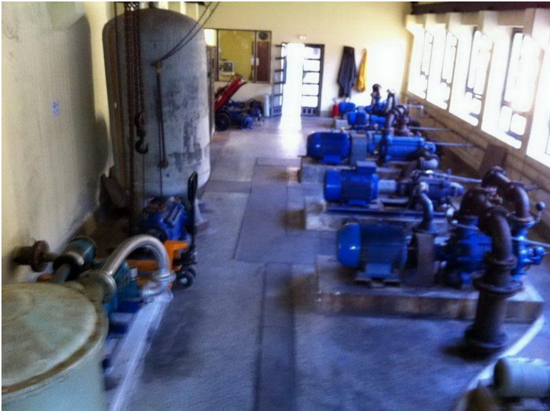
Slika 2: Crpna stanica iznutra