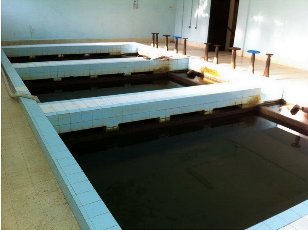
Slika 3: Filtrirna