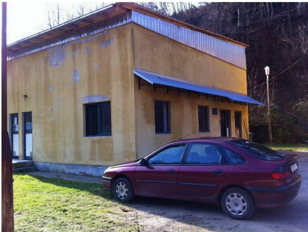
Slika 1: Crpna stanica izvana

Temelji zgrade i zidovi su od betona MB-160. Strop je od monta opeke, pokriven odozgo betocelom i premazima bitumena sa uložcima krovne ljepenke i jute, sve posuto sa pjeskom. Temelji cprki su izrađeni samostalno u betonu MB-160. Stijena podzemnih kanala su od betona MB-110. Pokrovna ploča spremnika je od armiranog betona MB-220m, a iznad nje se nalazi 40cm visoki zemljani nasip. Pod strojarnice, sanitarne prostorije i prostor za klor pokriveni su keramičkim pločama.