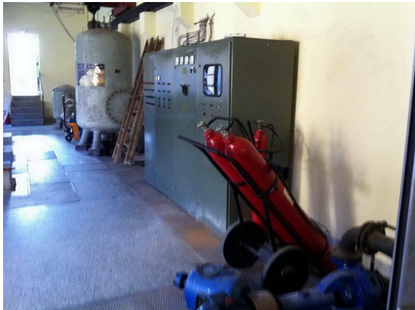
Slika 6: Niskonaponski upravljački ormar

Od trafostanice do strojarnice je ugrađen podzemni kabel za dovod nisko naponske energije i proveden u strojarnicu u predviđeni prostor.