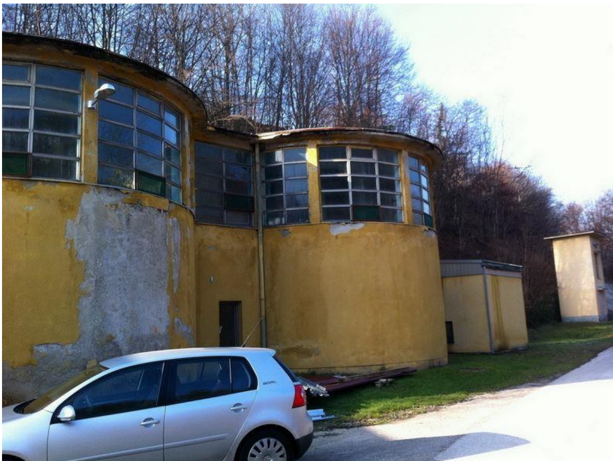
Slika 4: Zgrada taložnice