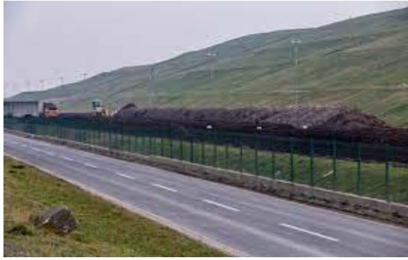
Slika 8 Odlagalište otpada Jakuševac