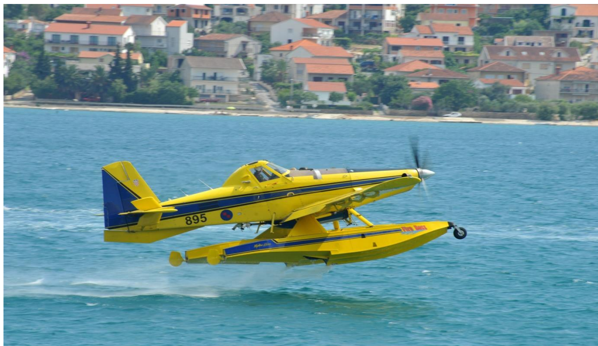
Slika 26. AIR TRACTOR AT-802 A Fire Boss [13]