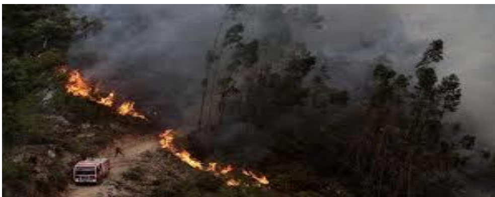
Slika 17. Paljenje predvatre [10]

Uz pomoć konfiguracije terena i vegetacijskim pokrovom odabire se područje u blizini požara koje ima prirodnu granicu, potok, prosjek, cestu i slično kao liniju obrane od širenja paljenja predvatre. Paljenje predvatre (slika 17.) vrši se paljenjem gorive mase u uskoj liniji u smjeru vjetra. Potom se pali druga i treća linija također u smjeru požara. Spajanjem kontravatre koja gori nasuprot smjeru širenja fronte požara i gorenja predvatre u smjeru širenja požara, stvara se prostor koji onemogućava širenje glavnog požara. [11]