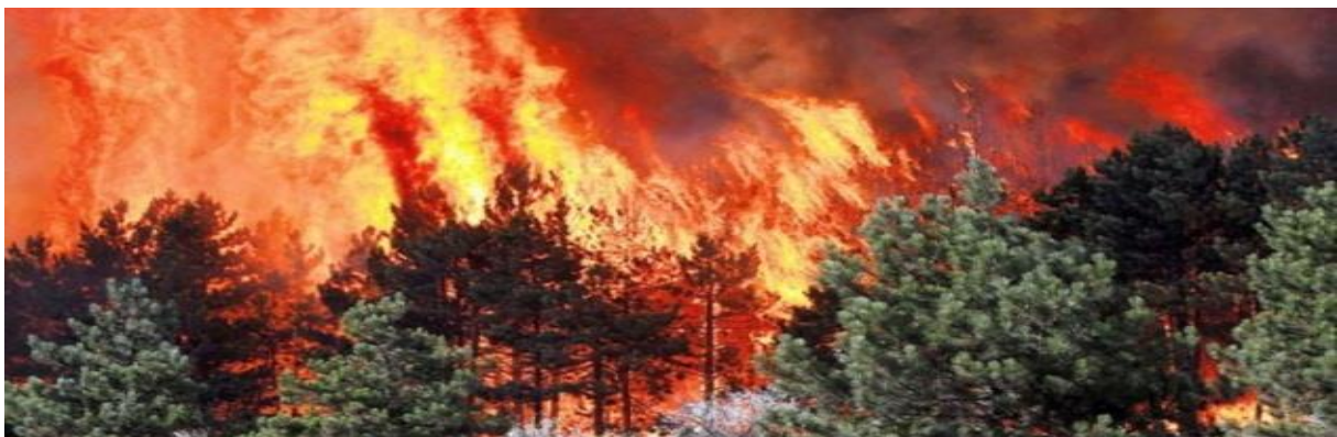
Slika 5. Požar otvorenog prostora [10]

Protupožarna eskadrila osposobljena je za učinkovito gašenje požara na kopnu, priobalju i otocima. Postrojba je u operativnoj uporabi od 1990. godine do danas. Svojim izuzetnim visoko osposobljenim posadama i raspoloživom tehnikom predstavljaju velik oslonac u gašenju velikih požara otvorenog prostora. (slika 5.)