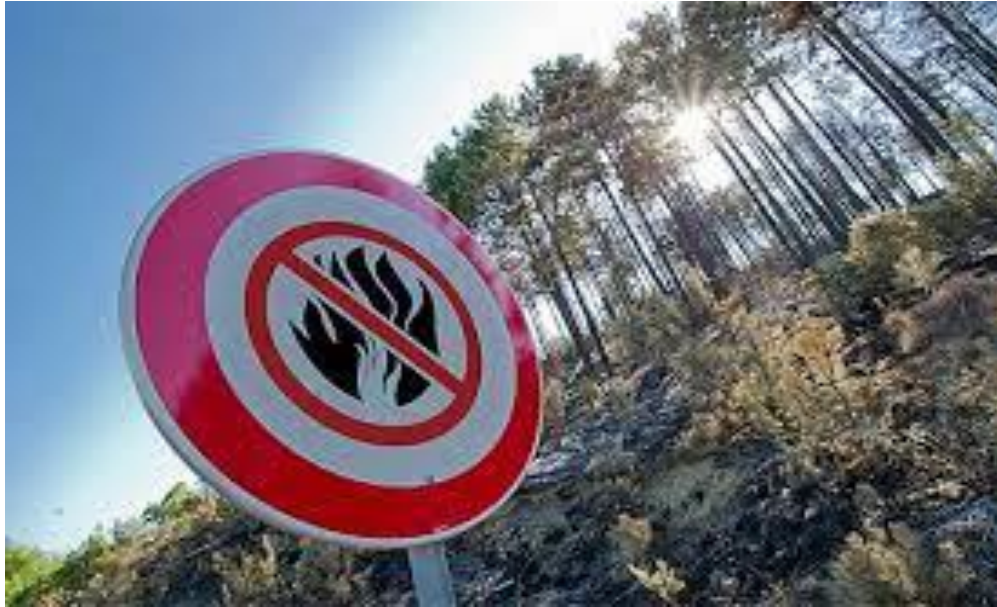
Slika 6. Preventivne tehničke mjere zaštite od požara [10]