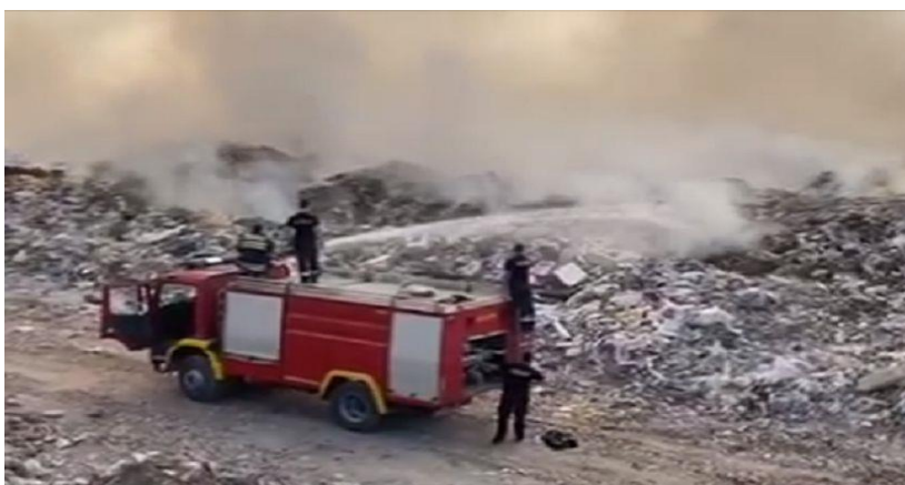
Slika 1. Požar smetlišta [1]

Pod pojmom otvorenog prostora u vatrogastvu drže se svi prostori koji nemaju zatvorene fizičke ograde i gdje ima dovoljne količine kisika iz zraka za potpuno sagorijevanje gorive tvari. Požarima otvorenog prostora podrazumijevaju se poljski požari, šumski požari i ostali požari na otvorenom prostoru. U požare na otvorenom prostoru uvrštavaju se i požari kod plinskih i naftnih postrojenja, požari otvorenih skladišta, požari smetlišta. Kod požara smetlišta (slika 1.) kao požara na otvorenome, osobito se pridaje pozornost preventivi i sigurnosti od požara jer su te lokacije iznimna potencijalna mjesta stvaranja i širenja požara.