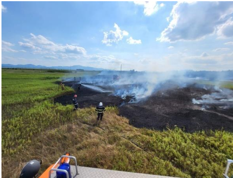
Slika 33. Lokaliziranje požara i privođenje intervencije kraju [14]

Taktika zaokruživanja požara pokazala se uspješnom te se intervencija s padom mraka privodila kraju (slika 33.), kad je zahvaljujući brznoj reakciji zapovjedništva, uočen dim na odlagalištu otpada (slika 34.).