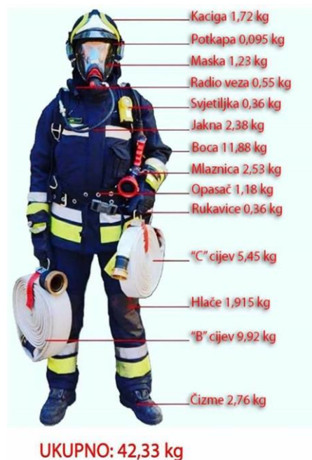
Slika 19. Osobna zaštitna protupožarna oprema [3]