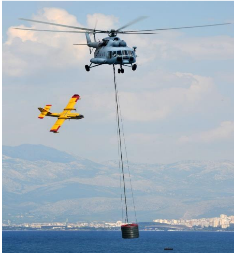
Slika 28. Helikopter MI-8 [9]

MI-8 je transportni helikopter s osnovnom namjenom za prevoženje ljudstva i materijalno-tehničkih stvari i za gašenje požara s pomoću „kruške“. Vrlo je učinkovit u dopremi ljudstva i sredstava na teško pristupne lokacije. (slika 28.)