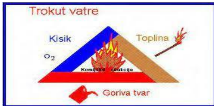
Slika 2. Uvjeti gorenja – požarni trokut [2]