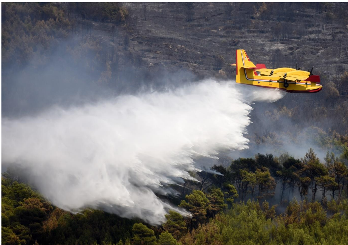
Slika 24. CANADAIR CL-415 – izbacivanje vode na opožareni prostor [13]