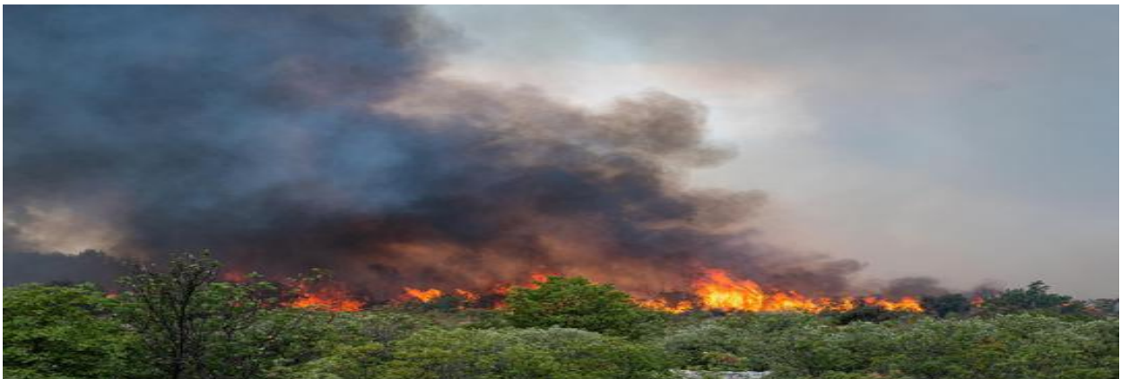
Slika 13. Utjecaj vjetra na požar [10]

Vjetar je faktor koji najviše utječe na brzinu i način širenja požara na otvorenom (slika 13.). Vjetar se podrazumijeva kao iznimni faktor širenja požara jer vjetar gura plamen prema naprijed i omogućava direktan kontakt plamena i novog neizgorjelog raslinja i povećava zračenje topline s izvora na prijemnike topline. [11]