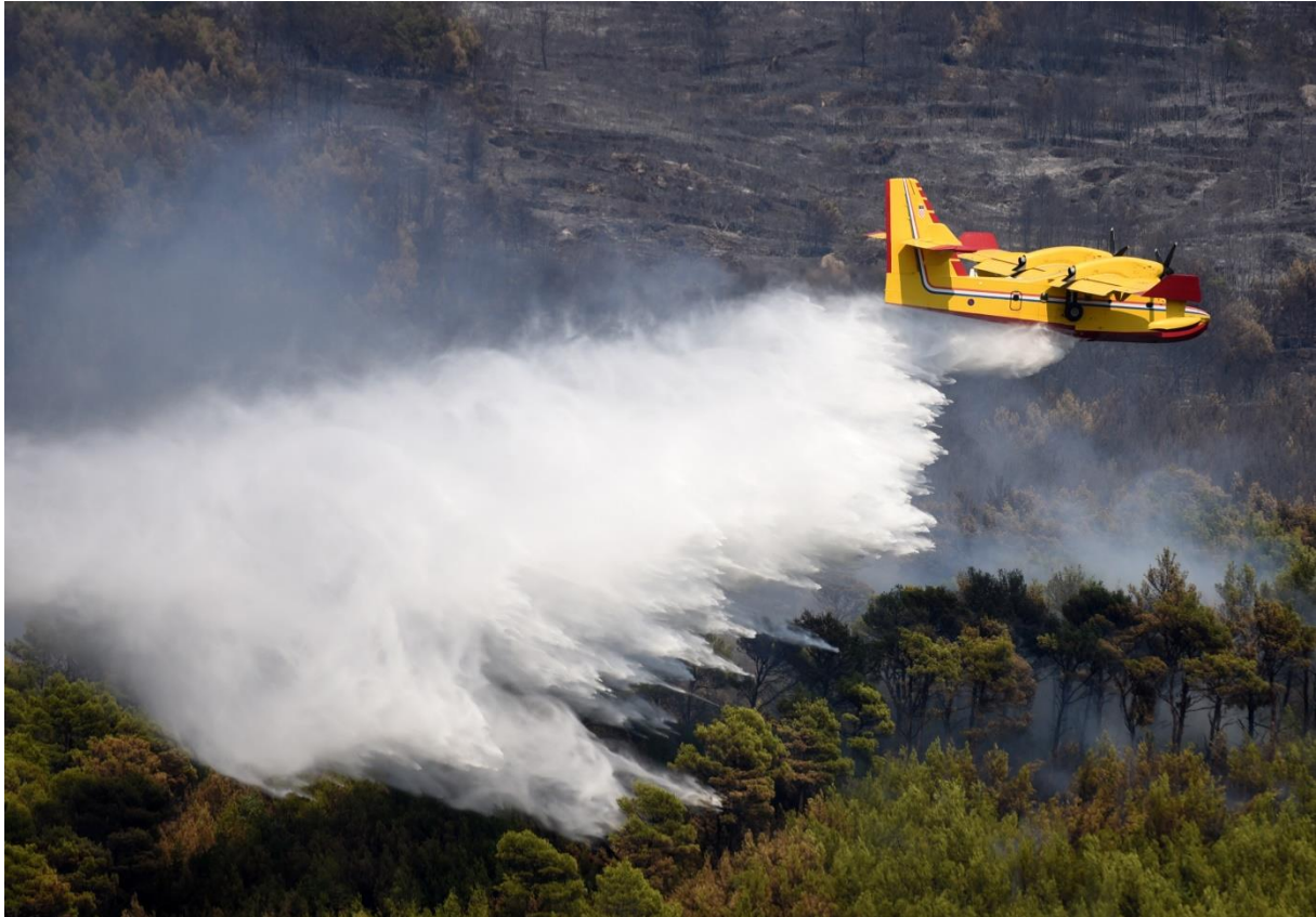
Slika 24. CANADAIR CL-415 – izbacivanje vode na opožareni prostor [13]