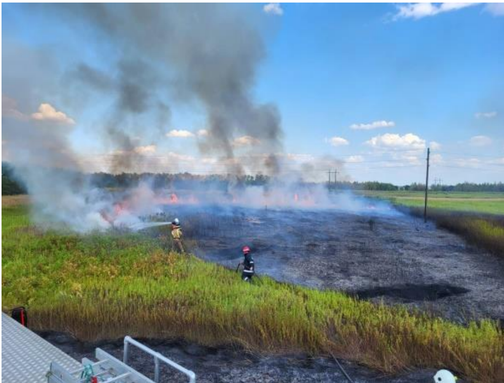
Slika 32. Gašenje prizemnog požara [14]

Vizualnim pregledom požara i okoline u posrednoj i neposrednoj blizini ustanovljeno je da se radi o požaru tipa A, požaru čvrstih zapaljivih materijala. U našem slučaju požar je nekontrolirano gorenje postrnih ostataka ratarske kulture na poljoprivrednoj čestici (slika 32.) koja graniči s komunalnim odlagalištem građevinskog otpada. To odlagalište mještani okolnih naselja koriste i za nepropisno zbrinjavanje otpada svih vrsta. [15]