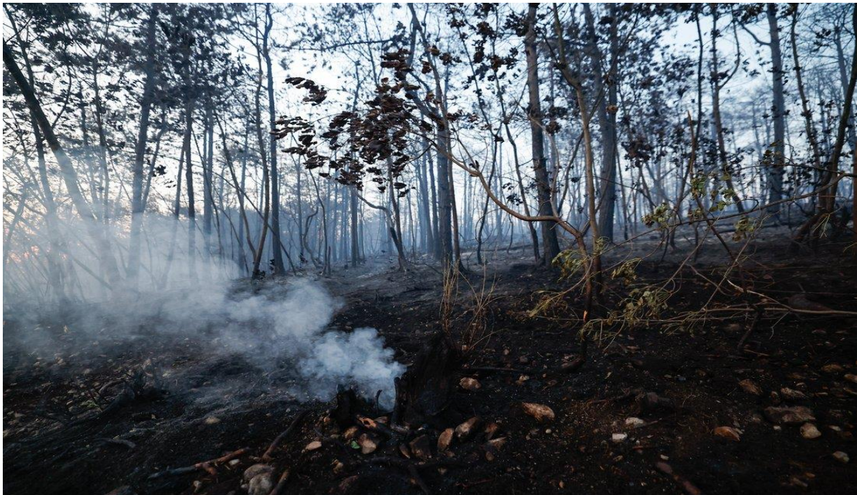
Slika 9. Podzemni požar [10]

Gorenjem treseta ili gorenjem listinca u tlu nastaje podzemni požar (slika 9.). Takva vrsta požara teško se uočava pa se neopaženo lako širi i može obuhvatiti veće površine i učiniti velike materijalne štete. Gašenje i sprječavanje širenja podzemnog požara vrši se kopanjem jaraka ispod razine gorenja gorive tvari. U krškom terenu podzemni požari duže gore i veća je opasnost od širenja u šumski požar. U ovakvim slučajevima gašenje podzemnog požara vršimo obilnim polijevanjem vodom. [11]