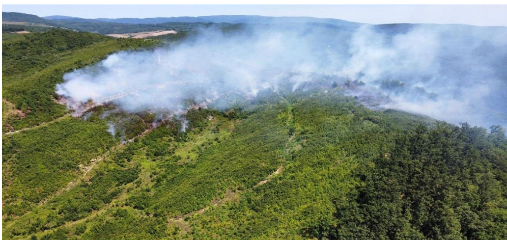
Slika 8. Požari otvorenog prostora [11]

Požari otvorenog prostora predstavljaju vatru na otvorenim prostorima koji nemaju zatvorene fizičke ograde i gdje ima dovoljno kisika iz zraka za kemijsku reakciju gorenja. (slika 8.) Prilikom požara na otvorenom prostoru isprepleću se različite aerodinamičke i termodinamičke reakcije, na koje bitno utječe konfiguracija terena, karakteristike vegetacije, klimatski i meteorološki uvjeti. [11]