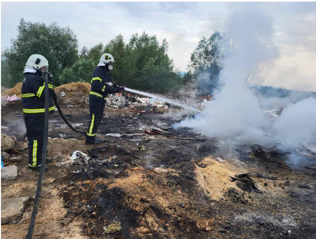
Slika 31. Gašenje požara smetlišta [14]

Dana 28. 8. centralno društvo zajednice zaprima dojavu o požaru otvorenog prostora na području Nove Vesi. Prvotne informacije su snažan dim s polja. U koordinaciji zapovjednika DVD-ova na razini Vatrogasne zajednice Petrijanec, na intervenciju izlazi DVD Petrijanec kao središnje društvo te DVD Nova Ves, DVD Strmec, DVD Majerje s tri navalna vozila, dva tehnička vozila i tridesetak vatrogasaca. Na temelju ograničenih informacija o samom požaru vatrogasci su se opremili svom opremom koja bi se mogla koristiti na gašenju otvorenog prostora. (slika 31.)