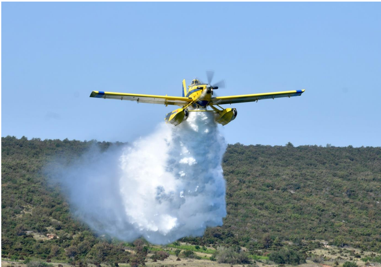
Slika 27. AIR TRACTOR AT-802 A u izbacivanju vode na požarište [13]

Potrebna duljina poletne staze je 600 metara, a slijetne staze 670 metara. Vodu može uzimati s vodenih površina mora, rijeka i jezera uz osnovne tehničke uvjete. Zrakoplovi se mogu koristiti u područjima priobalja, otoka i na kontinentu gdje postoje uvjeti za punjenje zrakoplova vodom.