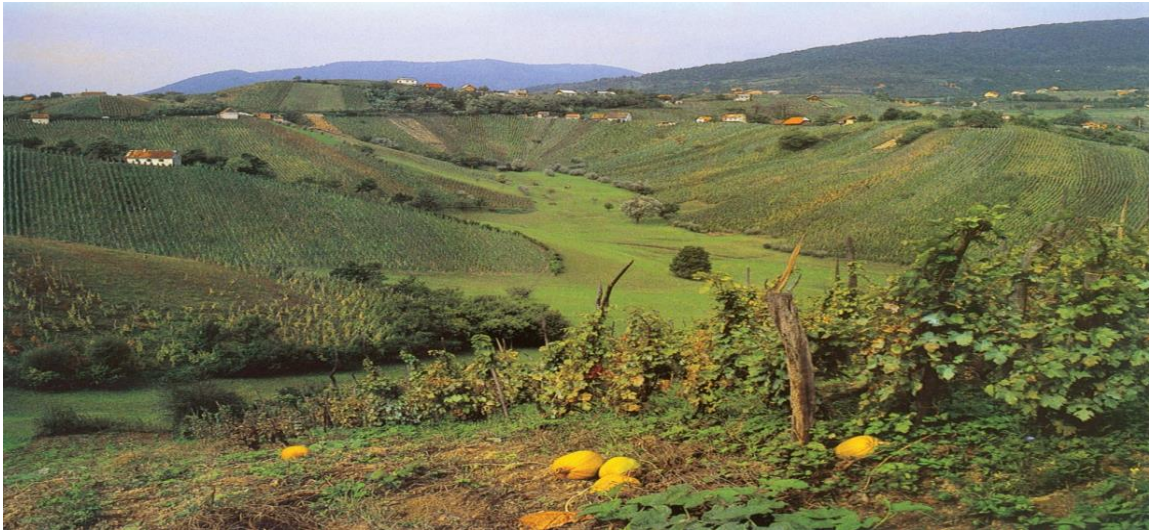
Slika 14. Reljef [11]

Reljef (slika 14.) svojim geografskim položajem, svojom razvedenošću, kao i površinom uz svoje karakteristike kroz nadmorsku visinu, izloženost meteorološkim pojavama, insolaciji – Sunčevoj toplini, utječe na pojavu i ponašanje požara otvorenog prostora.