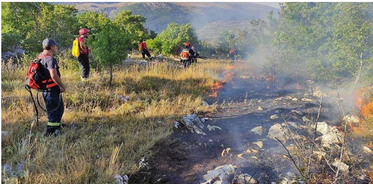
Slika 18. Formiranje i održavanje požarnih linija [10]

Tijekom zauzimanja protupožarne linije mora se voditi računa da linija mora biti dovoljno čista za uspješno djelovanje protupožarnih snaga. U slučaju širenja požarne linije horizontalno duž obronka gdje gori visoko raslinje, treba zemljanu liniju požarne linije načiniti u obliku žlijeba ili jaraka s dovoljnim nasipom prema donjoj strani obronka, kako bismo mogli zaustaviti i ugaziti goruću žeravicu i češere. Potrebno je formirati skupinu iskusnih vatrogasaca koji će prelaziti preko opožarenog područja i u njemu rušiti suharke i gasiti sve tinjajuće vatre. Ovim principom treba postupati kod suzbijanja svih šumskih požara.