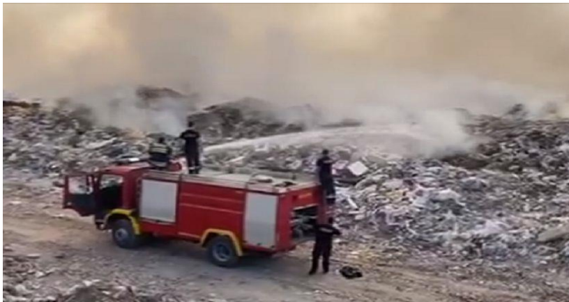
Slika 1. Požar smetlišta [1]

Pod pojmom otvorenog prostora u vatrogastvu drže se svi prostori koji nemaju zatvorene fizičke ograde i gdje ima dovoljne količine kisika iz zraka za potpuno sagorijevanje gorive tvari. Požarima otvorenog prostora podrazumijevaju se poljski požari, šumski požari i ostali požari na otvorenom prostoru. U požare na otvorenom prostoru uvrštavaju se i požari kod plinskih i naftnih postrojenja, požari otvorenih skladišta, požari smetlišta. Kod požara smetlišta (slika 1.) kao požara na otvorenome, osobito se pridaje pozornost preventivi i sigurnosti od požara jer su te lokacije iznimna potencijalna mjesta stvaranja i širenja požara.