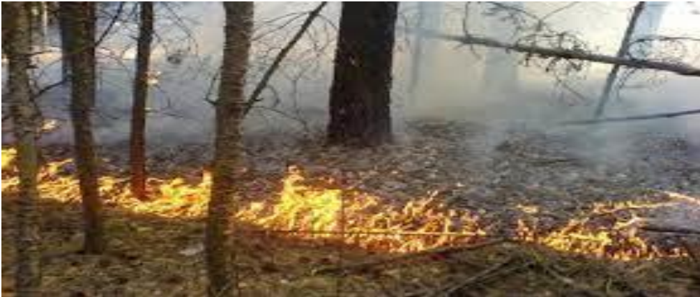
Slika 16. Paljenje kontravatre [10]

Taktika paljenja kontravatre (slika 16.) primjenjuje se isključivo u slučaju kada nema vjetra ili kod promjene smjera vjetra prema fronti požara. U slučaju primjene ove taktike mora se voditi računa da paljenje kontravatre ne bude predaleko od fronte požara i da vjetar ne bi promijenio smjer i time iz protuvatre stvorio dodatni požar. Tijekom paljenja kontravatre potrebno je rasporediti dovoljne vatrogasne snage iza linije obrane kako bismo u slučaju bilo kakvog obrata smjera požarne linije, mogli uspješno intervenirati. [10]