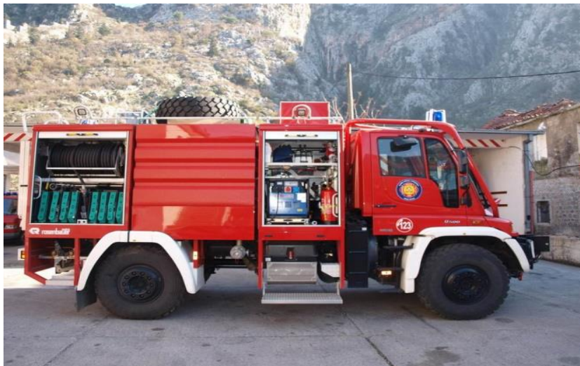
Slika 22. Unimog [12]

Unimog vozilo predstavlja navalno protupožarno vozilo (slika 22.) za gašenje šumskih požara i požara otvorenog prostora, prilagođeno zahtjevnim terenskim uvjetima.