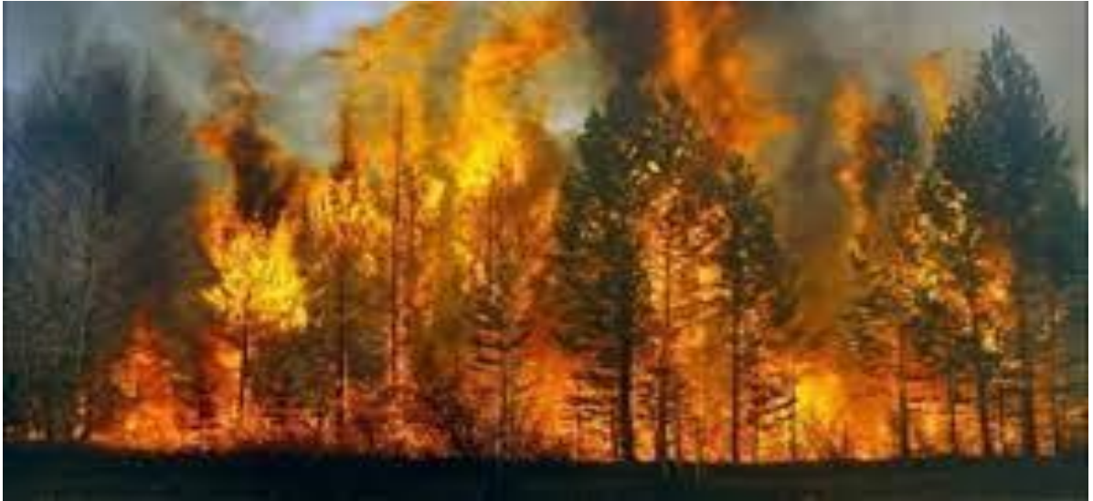
Slika 12. Požar krošnje ili ovršni požar [10]

Vegetacijski pokrov područja predstavlja osnovu nastanka požara na otvorenom jer on predstavlja gorivu tvar. Klimatski i meteorološki faktori omogućavaju stvaranje uvjeta za poticanje kemijske reakcije gorenja, a uz pomoć reljefa i topografije terena stvaraju se dodatni uvjeti za brzinu širenja požara.