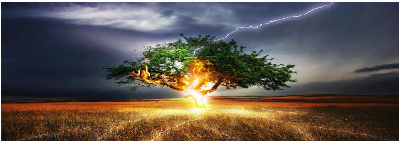
Slika 11. Požari pojedinačnih stabala [11]

Požari pojedinačnih stabala obično nastaju udarom groma u osamljena stabla koja se zapale i kao takva izgore u obliku buktinje. Rjeđe se dogodi da prenese požar na šire okolno područje. (slika 11.) [11]