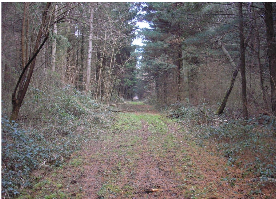
Slika 7. Preventivne biološko-prirodne mjere zaštite od požara [10]

Planskim sagledavanjem potencijalnih opasnosti otvorenog prostora, organizirati i provesti organizaciju obilaska prostora od strane organiziranih protupožarnih skupina, po mogućnosti pratiti stanje preko promatračnica, videokamera, prelijetanje bespilotnim letjelicama. Izraditi procjenu ugroženosti od požara, izraditi planove gašenja i osigurati ljudstvo i sredstva za brzo sprječavanje i gašenje požara. Time se bitno umanjuje mogućnost nastajanja požara otvorenog prostora i smanjuju materijalne štete od požara i moguće stradanje ljudi.