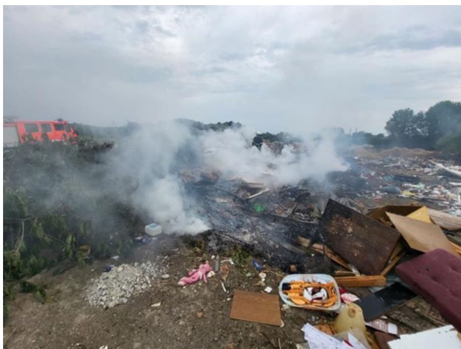
Slika 34. Sekundarno požarište [14]