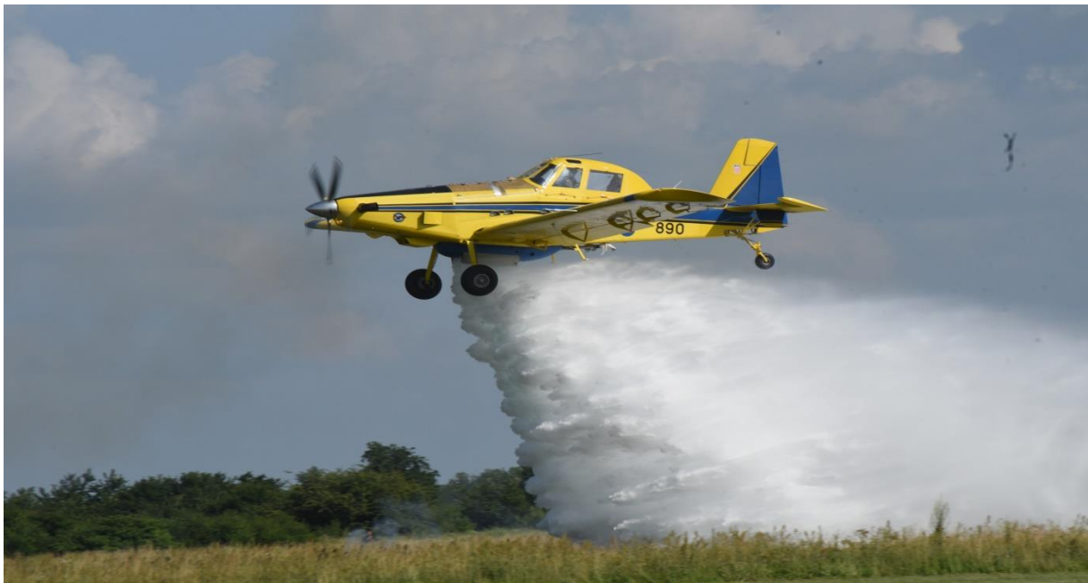
Slika 25. AIR TRACTOR AT-802 [13]