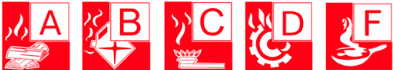
Slika 3. Klase požara [4]

Požari klase F predstavljaju gorenje biljnih i životinjskih ulja i masti. Požari ove klase predstavljaju najčešće požare.