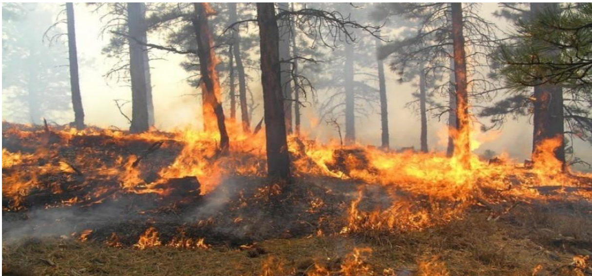
Slika 10. Prizemni požar [10]