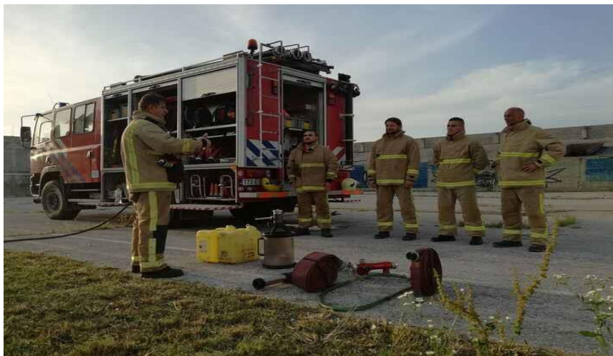
Slika 20. Skupna oprema vatrogasnih snaga [3]