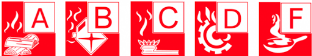
Slika 3. Klase požara [4]

Požari klase F predstavljaju gorenje biljnih i životinjskih ulja i masti. Požari ove klase predstavljaju najčešće požare.