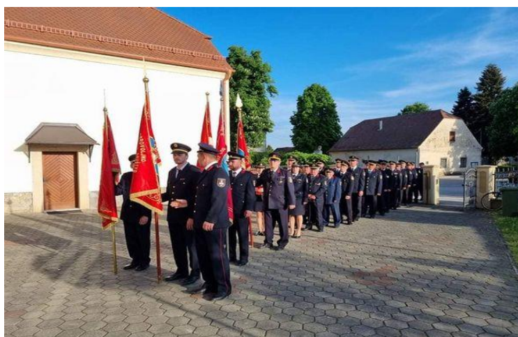
Slika 30. Svečani mimohod s obljetnice 110 g. djelovanja DVD-a Petrijanec [14]

Osim primarne uloge spašavanja ljudi i imovine od požara i tehničkih intervencija, dobrovoljna vatrogasna društva su i nositelji kulture u svojoj zajednici. [14]