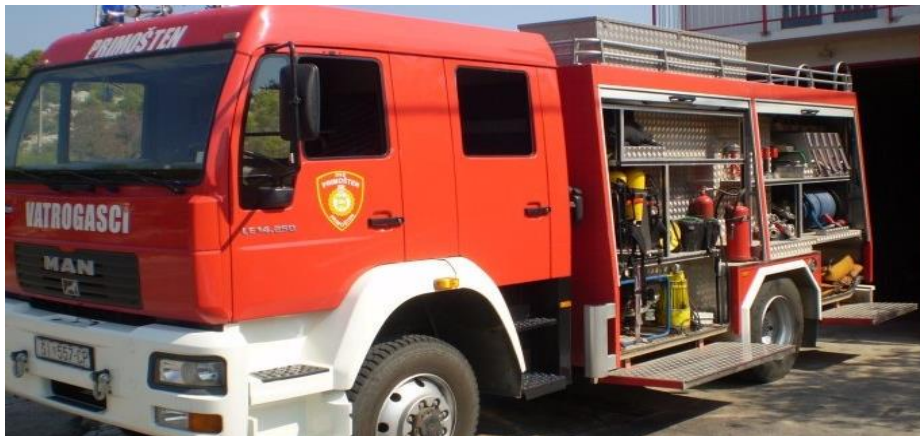
Slika 21. Vatrogasna cisterna MAN 5000 [12]

Vatrogasna cisterna (slika 21.) je kamion sa rezervoarom za vodu kapaciteta 5000 l, opremljen visokotlačnim pumpama i opremom za gašenje požara, mlaznicama ili topovima za izbacivanje vode. Svrha vatrogasne cisterne je doprema vode na požarište s mogućnosti gašenja mlaznicama ili vodenim topom, po potrebi za opskrbu vodom manjih protupožarnih navalnih vozila.