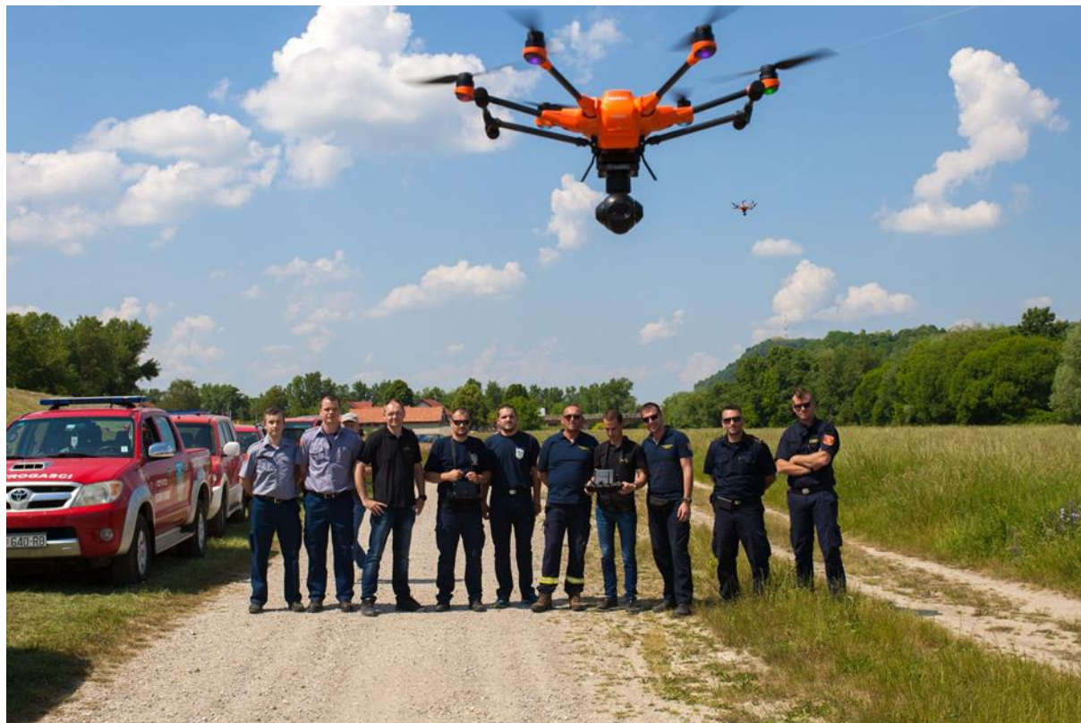
Slika 29. Беспилотна летјеліца – дрон [9]

kojom se opskrbljuje vodom. Penje se na visinu od 300 m za 6 min i doseže nepristupačna mjesta, što je pogodno za gašenje požara visokih objekata.