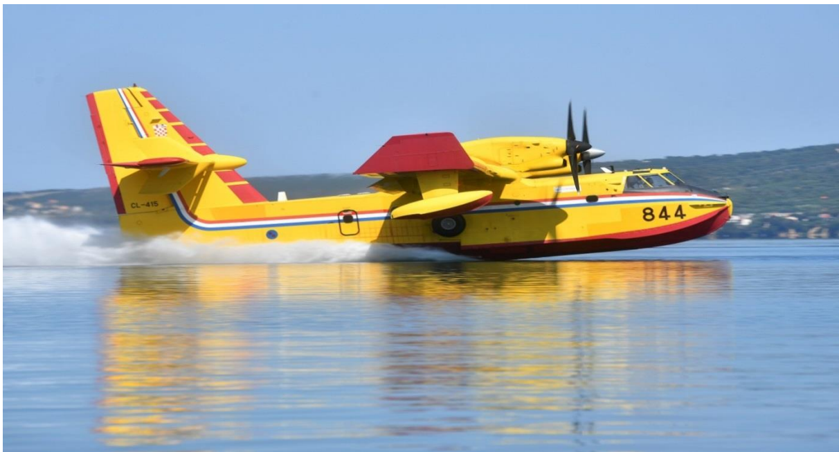
Slika 23. Canadair CL-415 [13]

Po potrebi za gašenje požara angažiraju se i helikopteri za višestruku potporu protupožarnim snagama u obliku prebacivanja na određena područja, pregled opečarenog područja, dopremu tehnike i opreme, dovoz vode na za navalna vozila i samo gašenje požara s pomoću „kruške“.