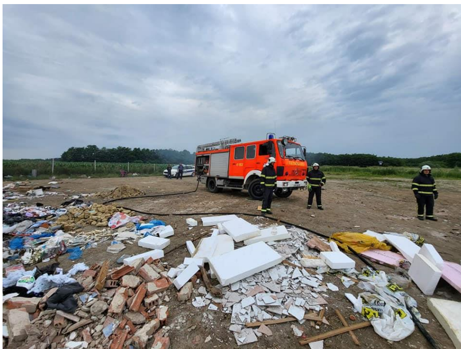
Slika 35. Završetak intervencije [14]

DVD Nova Ves je dobio zadatak postaviti nove cijevne pruge do novonastalog požara na odlagalištu kako bi se spriječilo daljnje širenje požara. U blizini centra požara pripadnici DVD-a Nova Ves uočili su nepropisno odložene spremnike opasnog otpada. U nedostatku informacija o vrsti otpada te jesu li spremnici potencijalni izvor eksplozija i daljnjeg širenja požara, žurno se pristupa gašenju sekundarnog požara kako bi se izbjegla dalja šteta. Korištena je ista taktika zaokruživanja požara te se pravodobnom intervencijom uspješno izbjeglo širenje sekundarnog požara (slika 35.)