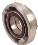
(Slika 1. Stabilna spojnica)