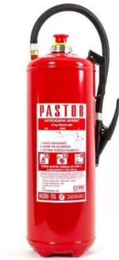
(Slika 15. Ručni aparat za gašenje)