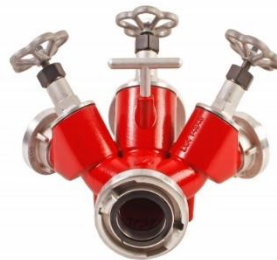
(Slika 9. Razdjelnica trodijelna sa slavinama)