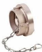
(Slika 2. slijepa spojnica)