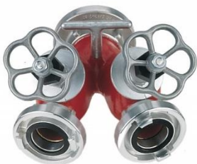
(Slika 8. Razdjelnica dvodijelna s ventilima)