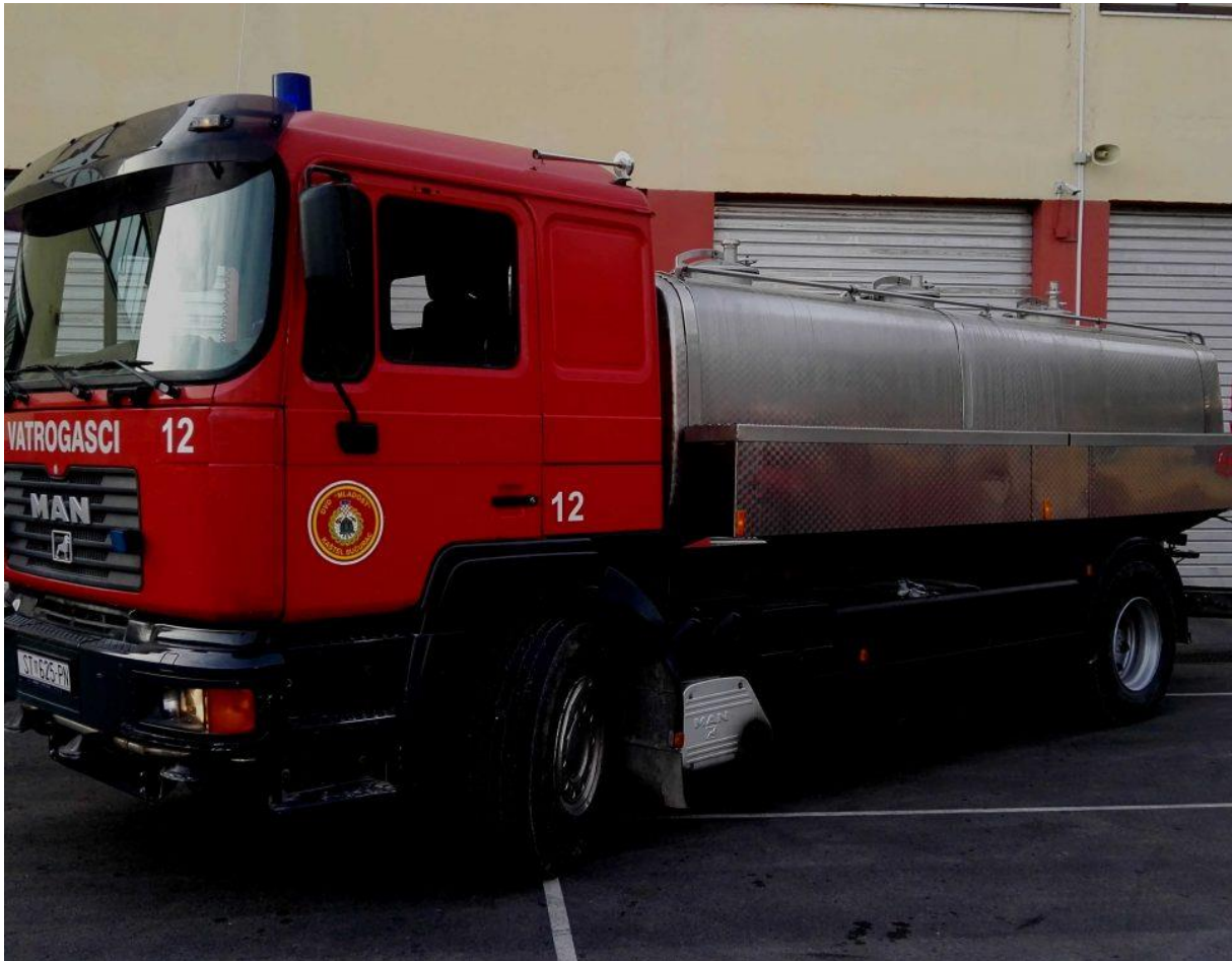
(Slika 14. Autocisterna DVD-a „Mladost“)

Vozilo namijenjeno opskrbi vodom na mjestu intervencije. Opremljeno je s manje vatrogasne opreme, ali unatoč tome može samostalno odrađivati intervencije. Ima veći spremnik vode od navalnog vozila ( 5000 do 6000 litara). Opremljeno je centrifugalnim vatrogasnim pumpama, tlačnim i usisnim cijevima, visokotlačnim vitlom, vatrogasnim armaturama za vodu i pjenu, razdjelnicama, sabirnicama, usisnim košarama i sličnom opremom.