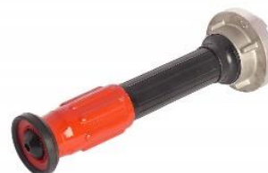
(Slika 5. Univerzalna mlaznica)

preuzeto sa: Popović, Knežević, Posavec, Župančić, Merćep, Gauš, Blaha; Priručnik za osposobljavanje vatrogasaca, Hrvatska vatrogasna zajednica, Zagreb, 2010.