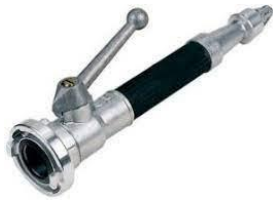
(Slika 6. Mlaznica sa zatvaračem)