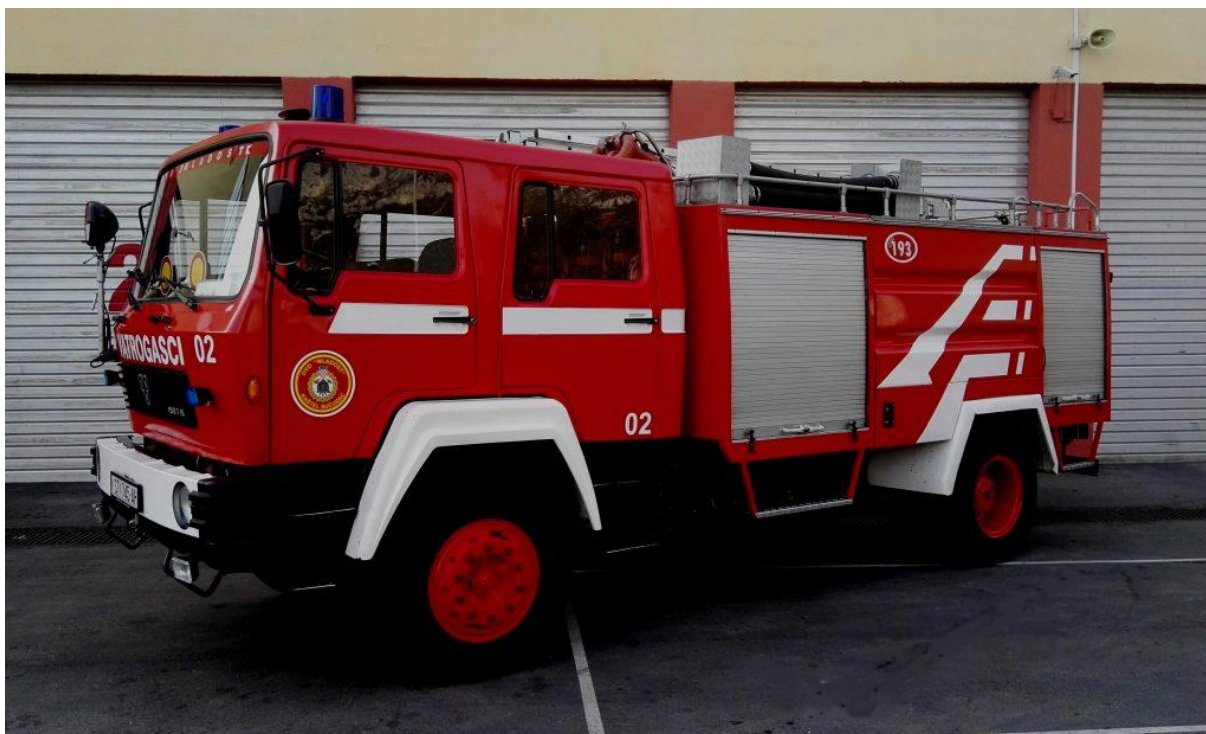
(Slika 13. Navalno vozilo DVD-a „Mladost“)

Namijenjeno je prijevozu osnovne vatrogasne jedinice na mjesto intervencije. Posjeduje određenu vatrogasnu tehniku, sredstva i opremu za gašenje požara. Opremljeno je spremnikom za vodu ( 2000 do 3000 litara), spremnicima za pjenilo, centrifugalnom vatrogasnom pumpom, mješačem vode i pjenila, sustavom za gašenje pjenom, bacačem vode, visokotlačnim vitlima, prijenosnim vatrogasnim ljestvama, tlačnim i usisnim cijevima, vatrogasnom armaturom za vodu, hidrantskim nastavkom i ključem, mlaznicama za gašenje pjenom i sličnom opremom.