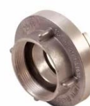
(Slika 3. prijelazna spojnica)

preuzeto sa: https://vatropromet.hr/stabilna-spojnica-fi-52-mm-c-unutarnji-navoj-2-proizvod-64/