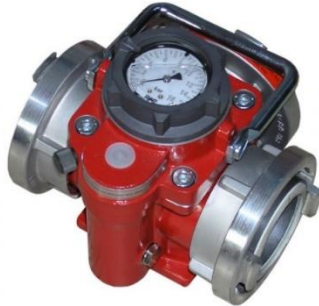
(Slika 11. Uređaj za ograničenje tlaka); preuzeto sa: Popović, Knežević, Posavec, Župančić, Merćep, Gauš, Blaha; Priručnik za osposobljavanje vatrogasaca, Hrvatska vatrogasna zajednica, Zagreb, 2010.