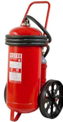
Slika 16. Prijevozni aparat za gašenje