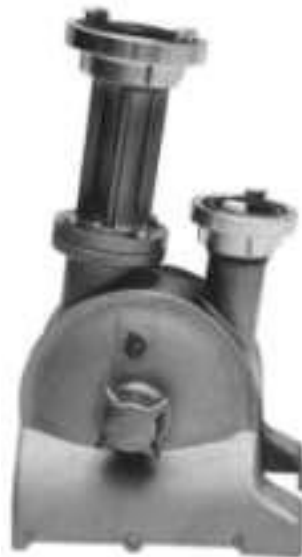
(Slika 12. Dubokosrkač)