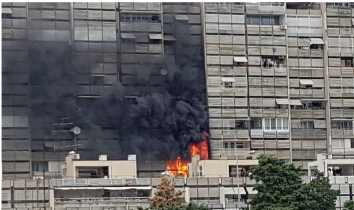
Slika 20. Prikaz požara zgrade iz navedene intervencije