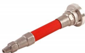
(Slika 4. Obična mlaznica)