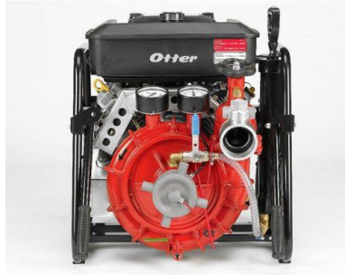
Slika 17. Pumpa s vakuum uređajem)

Norma HRN EN 14710-1:2008 obuhvaća centrifugalne vatrogasne pumpe bez vakuum uređaja. To su pumpe koje ne moraju izvršiti početno dobavljanje vode. Takve pumpe mogu biti izvedene kao plutajuće pumpe i uranjajuće pumpe.