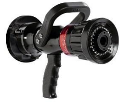
(Slika 7. Specijalna mlaznica)