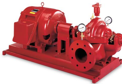
(Slika 18. Pumpa bez vakuum uređaja)

Norma HRN EN 14710-1:2008 obuhvaća centrifugalne vatrogasne pumpe bez vakuum uređaja. To su pumpe koje ne moraju izvršiti početno dobavljanje vode. Takve pumpe mogu biti izvedene kao plutajuće pumpe i uranjajuće pumpe.