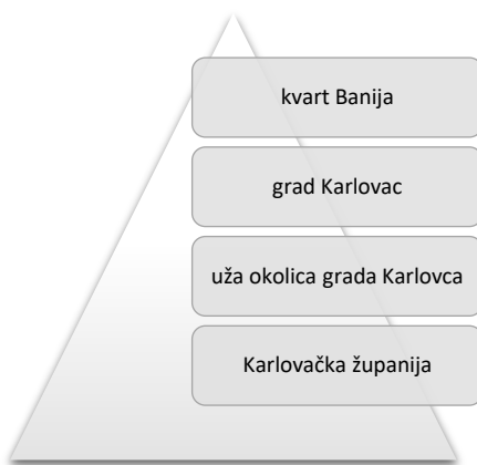
Slika 1. Zemljopisna identifikacija ciljnih tržišta

Ovisno o poslovanju i profitu salona kroz neko buduće razdoblje, ako se pokaže povećanje potražnje, postoji mogućnost širenja usluga otvaranjem novih radnih mjesta i salona, pod istoimenim nazivom u gradu Zagrebu pa kasnije i na ostalom teritoriju Republike Hrvatske.