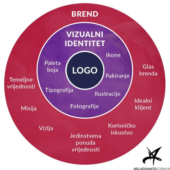
Slika 6. Vennov dijagram odnosa brenda

Izvor: https://neladunato.com.hr/clanci/brend-logo-vizualni-identitet/ (08.01.2022.)