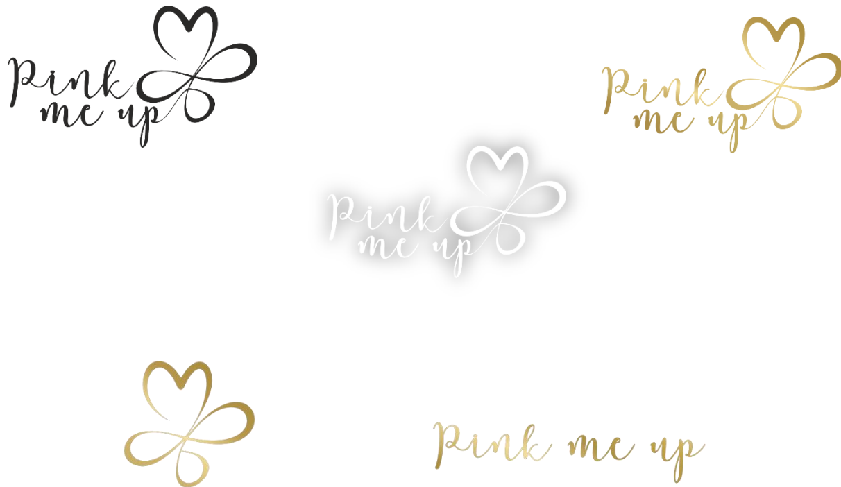
Slika 4. Primjeri loga Pink me up studia

U dizajnerskoj praksi većina logotipa osim osnovne varijante u boji sadrži i neke ostale boje u različitim kombinacijama. Sve se takve dizajnirane varijante smatraju jednim logotipom.