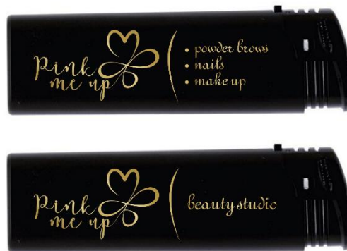
Slika3. Primjer reklamnog uzorka