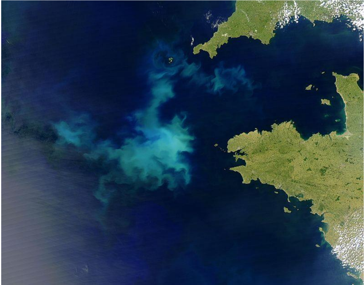
Slika 5: Cvjetanje algi u Atlantiku

Posebnu štetu tlu pa i cjelokupnom ekosustavu nanose brojni i raznoliki pesticidi, tj. preparati za zaštitu kojima se u poljoprivrednoj proizvodnji uništavaju nametnici i štetnici, tj. uzročnici različitih bolesti, korov i drugo.