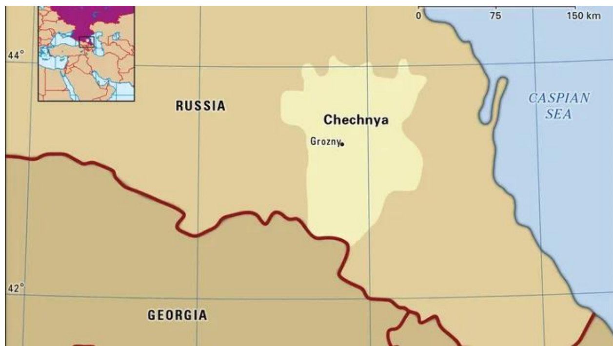
Slika 1. Čečenija [21]

Čečenija je republika u jugozapadnoj Rusiji, smještena je na sjevernom krilu lanca Velikog Kavkaza (Slika 1), a početkom 21. stoljeća postala je područje ogorčenih sukoba koji su je opustošili, gospodarski unazadili, te izazvali masivni egzodus izbjeglica. [21]