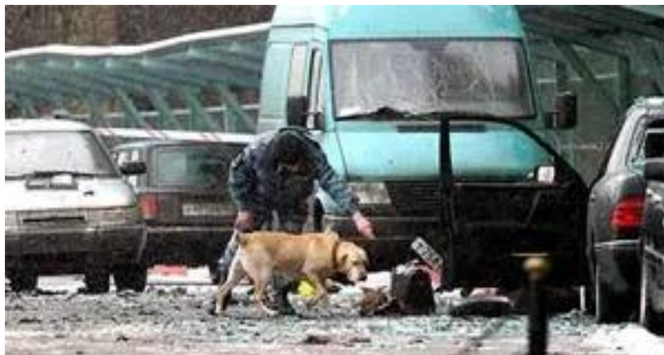
Slika 10. Napad ispred hotela National, 9. prosinca 2003. [50]

25. kolovoza 2004. u zraku su eksplodirala dva zrakoplova TU-134 (Moscow-Volgograd) i TU-154 (Moscow-Sochi), a oba napada izvele su žene samoubojice bombaši, koje su ušle u zrakoplove u moskovskoj luci Domodedovo. Napad na zrakoplov koji je putovao iz Moskve za Volgograd izvršila je Aminat Nogaeva, a Sazita Jebirhanova izvršila je napad na zrakoplov koji je iz Moskve putovao za Sochi. Obje žene su iz Čečenije, a prema rezultatima istrage, napade je organizirao Shamil Basayev. Zrakoplovi su nestali s radarskih ekrana kontrolora zračnog prometa u razmaku od nekoliko minuta, a TU-154, sa 46 putnika i članova posade, poslao je alarm za otmicu prije nego što se srušio. Na letu za Volgograd ubijeno je 43 osobe, uključujući osam članova posade. Zrakoplov se srušio u regiji Tula, u blizini sela Buchalka. Na letu za Sochi ubijeno je 45 osoba, uključujući osam članova posade, a zrakoplov se srušio oko 140 km od grada Rostova na Donu, u blizini ukrajinske granice. [38, 46, 51]