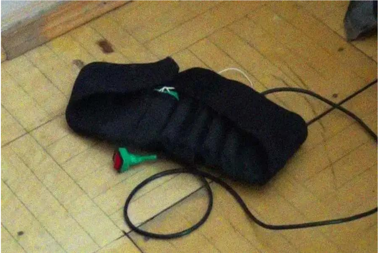
Slika 8. Samoubilački pojas (48)

5. prosinca 2003. dogodio se napad u kojemu je poginulo 47 osoba, a ranjeno je ih više od 186. Eksplozija se dogodila u električnom vlaku „ Kislovodsk-Mineralnye Vody “ (Slika 9). Prema istrazi, počinio ga je bombaš samoubojica. Eksplozija se dogodila u jutarnjim satima ispred stanice Yessentuki u južnoj Rusiji. [38, 46]