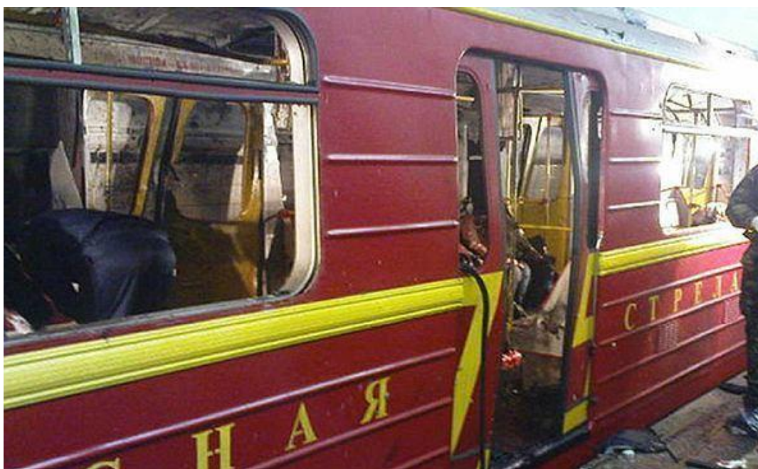
Slika 12. Napad žena samoubojica bombaša na stanicama metroa u Moskvi, 2010 [54]

29. ožujka 2010. u Moskvi su istovremeno izvršena dva napada na stanicama metroa. Prva eksplozija dogodila se u 07:56 po moskovskom vremenu na stanici metroa Lubyanka. Druga eksplozija dogodila se u 08:40 po moskovskom vremenu na stanici metroa Park Kultury. Prema FSB-u, ove terorističke napade počinile su žene bombaši samoubojice. U dvije eksplozije u moskovskom metrou poginulo je 40 osoba, a ozlijeđeno je više od 100 osoba. Eksploziju na stanici metroa Lubyanka počinila je Maryam Sharipova, rodom iz Dagestana, supruga Magomedala Vagabova, jednog od vođa dagestanskih militanata. Još jedna žena samoubojica, koja se raznijela na stanici metroa Park kulture, identificiran je kao 17-godišnja Djennet Abdurakhmanova, udovica Umalat Magomedova, vođe dagestanskih militanata, koji je ubijen krajem prosinca 2009. Dokku Umarov, vođa sjevernokavkaskih militanata, preuzeo je odgovornost za napade, koji su prema njegovim riječima bili osveta za ruske vojne operacije u Čečeniji.