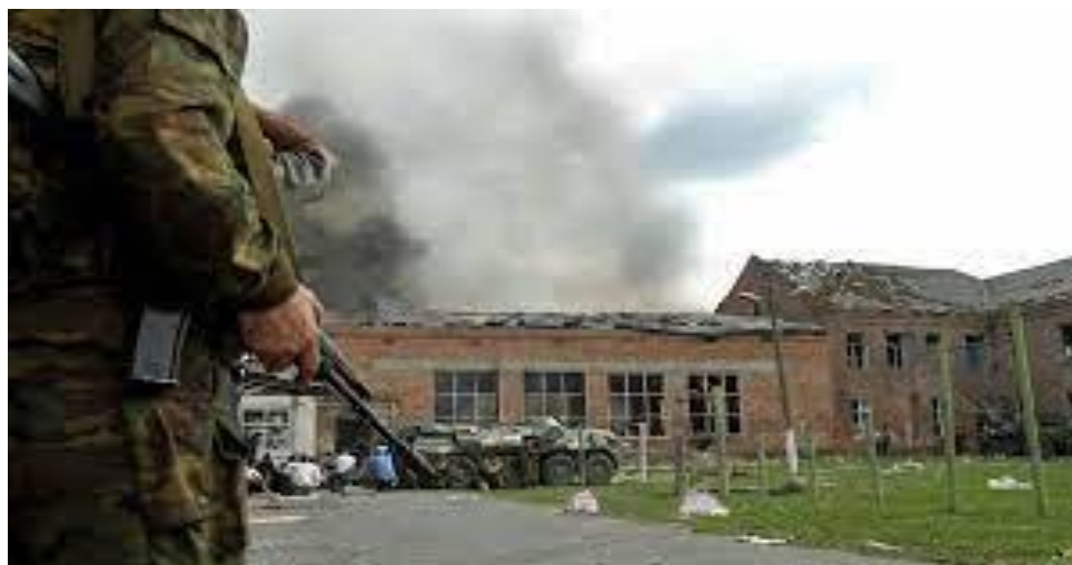
Slika 11. Napad na školu u Beslanu (sjeverna Osetija) [53]

obrazovnu ustanovu dogoditi, no nisu proveli mjere sigurnosti unutar ustanova, upozorili javnost ili spriječili napad. Odgovor vlasti na incident pokazao je sve nedostatke formalnog vodstva, što je rezultiralo ozbiljnim nedostacima u donošenju odluka i koordinaciji. U nedostatku odgovarajućih pravila koja reguliraju kako se snage sigurnosti trebaju baviti teroristima, na zgradama u kojima su još uvijek držani taoci korišteno je neselektivno oružje, što je uključivalo je bacače plamena, bacače granata i tenkovske topove, što je pridonijelo teškim žrtvama među taocima. [46, 52]