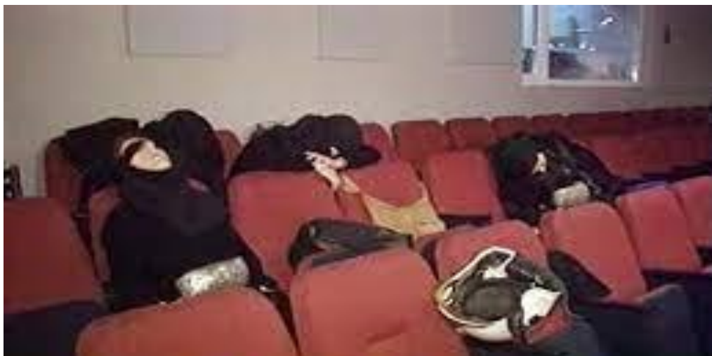
Slika 6. Dubrovka, ubijene žene bombaši nakon talačke krize [45]

27. prosinac 2002. dogodio se napad u Groznom u kojemu su dva vozila napunjena bombama probila kordon zgrade čečenske vlade u posebno zaštićenoj zoni i eksplodirala na njezinom teritoriju. Vozilima u kojima je bilo više od tone eksploziva upravljali su bombaši samoubojice među kojima je bila i djevojka stara 15 godina. Bombaši samoubojice svi su bili članovi jedne čečenske obitelji (Tumrievs): 43-godišnji otac vozio je kamion, kći je sjedila do njega, a sin od 17 godina vozio je automobil. Krater eksplozije bio je oko sedam metara, 83 osobe su poginule, a više od 200 osoba je zadobilo ozljede različite težine. [38, 41, 46, 47]