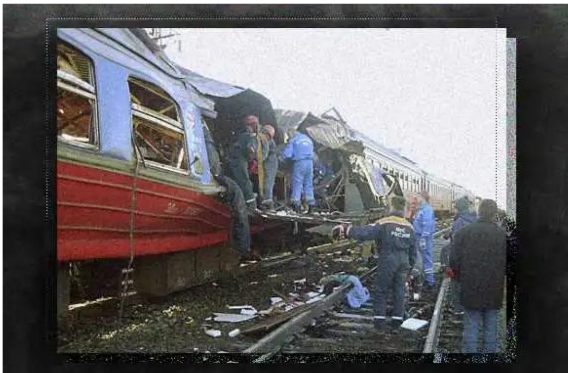
Slika 9. Napad bombaša samoubojice na električni vlak 5. prosinca 2003. [47]

15. rujna 2003. dogodio se napada na Ured FSB-a (Ingushetia), u kojemu je sudjelovala jedna žena. Kamion s eksplozivom uletio je u ulaz regionalne zgrade FSB-a, uništio je zgradu i oštetiio administrativne urede u blizini. Poginulo je ukupno dvije osobe, a ranjena 31. [38]