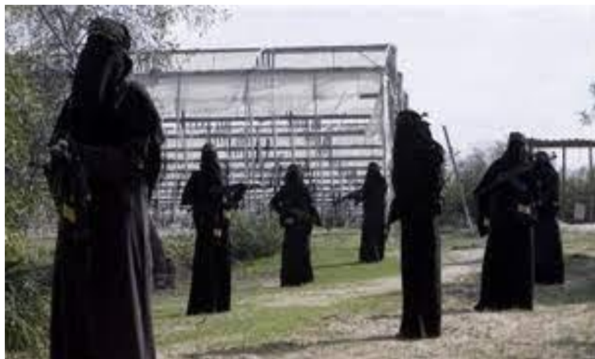
Slika 4. Čečenske „Crne udovice“ [42]