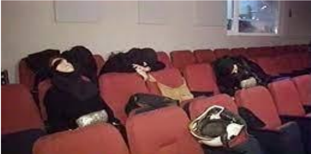
Slika 6. Dubrovka, ubijene žene bombaši nakon talačke krize [45]

27. prosinac 2002. dogodio se napad u Groznom u kojemu su dva vozila napunjena bombama probila kordon zgrade čečenske vlade u posebno zaštićenoj zoni i eksplodirala na njezinom teritoriju. Vozilima u kojima je bilo više od tone eksploziva upravljali su bombaši samoubojice među kojima je bila i djevojka stara 15 godina. Bombaši samoubojice svi su bili članovi jedne čečenske obitelji (Tumrievs): 43-godišnji otac vozio je kamion, kći je sjedila do njega, a sin od 17 godina vozio je automobil. Krater eksplozije bio je oko sedam metara, 83 osobe su poginule, a više od 200 osoba je zadobilo ozljede različite težine. [38, 41, 46, 47]