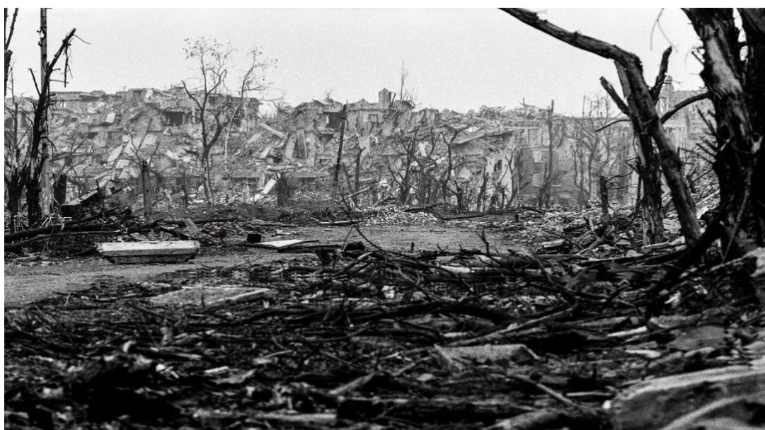
Slika 2. Razaranja u Groznom u siječnju 1995. godine [30]