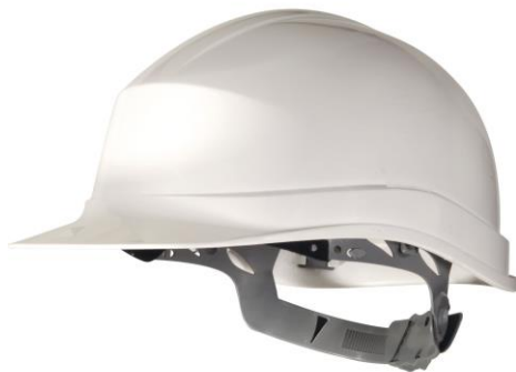
Sl. 5 Primjer zaštitne kacige [18]

Na slici 5. prikazana je Delta Plus industrijska zaštitna kaciga bijele boje.