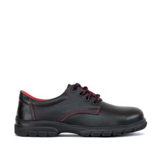
Sl. 6 Zaštitna cipela, niska [19]

Osobna zaštitna oprema za zaštitu nogu i stopala služe za zaštitu od hladnoće, uboda, sklizanja, kemikalija te padova teških predmeta.