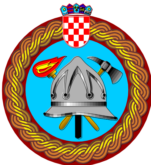
Sl. 4 Znak Dobrovoljne vatrogasne postrojbe u gospodarstvu Nexe d.d. [15]