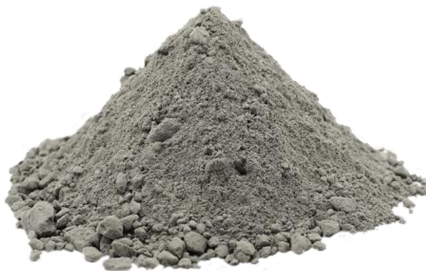
Sl. 1 Cement [2]

Cement, u suvremenom graditeljstvu, predstavlja osnovno vezivo kod izrade betona. Prema Vrkljanovu mišljenju, cement predstavlja naziv za sva ona veziva s hidrauličkim svojstvima što znači da takva se veziva u dodiru s vodom povezuju i stvrdnjavaju, bez obzira nalaze li se na zraku ili pod vodom jer u reakciji s vodom daju stabilne produkte (hidraulično vapno i sve vrste cementa). Za razliku od hidrauličnih, nehidraulična se veziva vežu i stvrdnjavaju djelovanjem vode na zraku, a pod vodom ne mogu očvrnuti jer su im u reakciji s vodom produkti topljivi i nestabilni u vodi (glina, vapno i gips). Naziv cement dolazi iz latinskih riječi „caedere“- lomiti i „lapidem“- kamen. To je glavno mineralno vezivo koje u miješanju s vodom i agregatom proizvodi beton. [2]. Na slici 1 prikazan je cement.