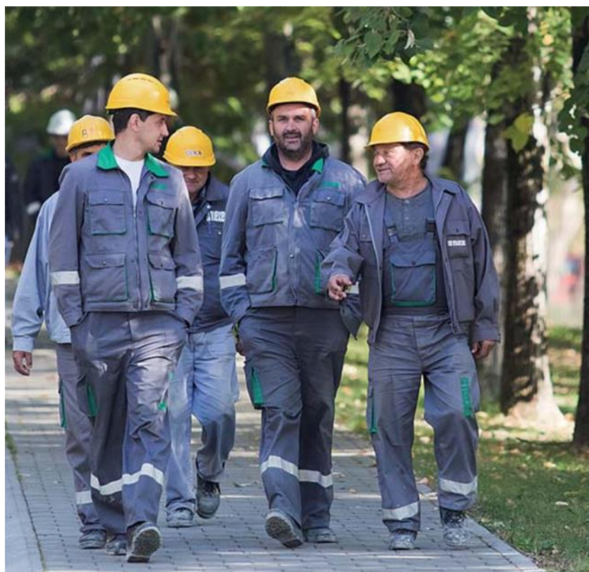
Sl. 7 Obična radna odijela [21]

Obična radna odijela služe za zaštitu osobne odjeće radnika od prašina i raznih nečistoća bez neke druge zaštite. To su uglavnom kompleti hlača i gornjeg dijela, polukombinezoni i kombinezoni. [17]