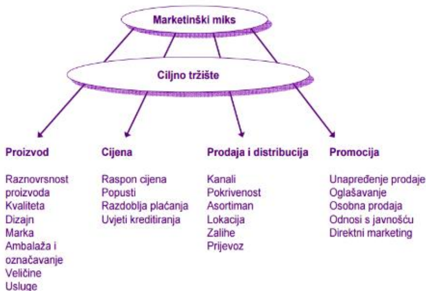
Slika 1: Koncept marketinškog miksa