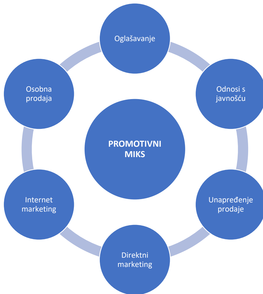
Tablica 3: Elementi promotivnog miksa