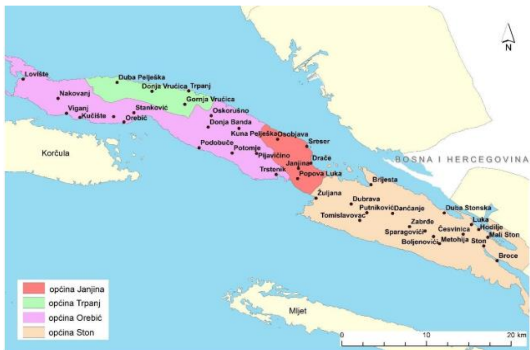
Slika 4. Demografski prikaz Pelješca podijeljenog na općine