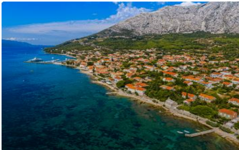
Slika 6. Panoramski pogled na Orebić