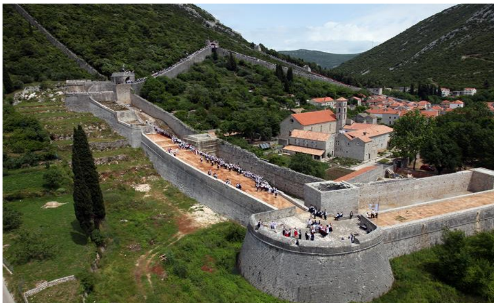
Slika 7. Pogled na Stonske zidine