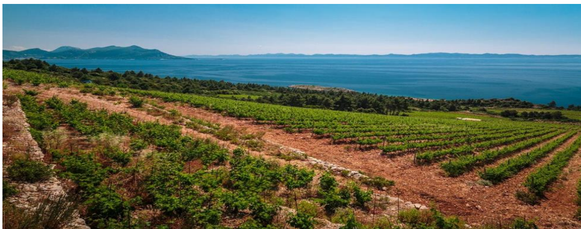
Slika 3. Vinova loza peljeških brda