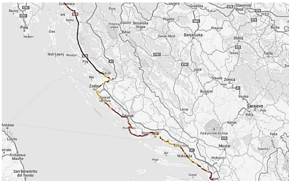
Slika 11. Prikaz Jadranske magistrale

Dosadašnji intenzitet prometa na cestama poluotoka Pelješca rezultat je prijašnje kompleksne situacije. Kao posljedicu ovakve prometne situacije može se istaknuti to kako je Pelješac godinama ostvarivao kontakt s ostalim dijelovima Hrvatske na dva načina: preko ceste D414, kao prometno rješenje primarne važnosti te trajektnom vezom Trpanj-Ploče kao prometno rješenje sekundarne važnosti. Ukupna duljina državne ceste D414 iznosi 64,7 km, te se nalazi na potezu trajektna luka Orebić-Ston-Zaton Doli, smjerom zapad istok, povezuje sva važna naselja Pelješca, osim Trpnja. Ova cesta se često naziva i Pelješkom magistralom., te se kod mjesta Zaton Doli priključuje na cestu D-8, tj Jadransku magistralu koja vodi prema Pločama ali i Dubrovniku.