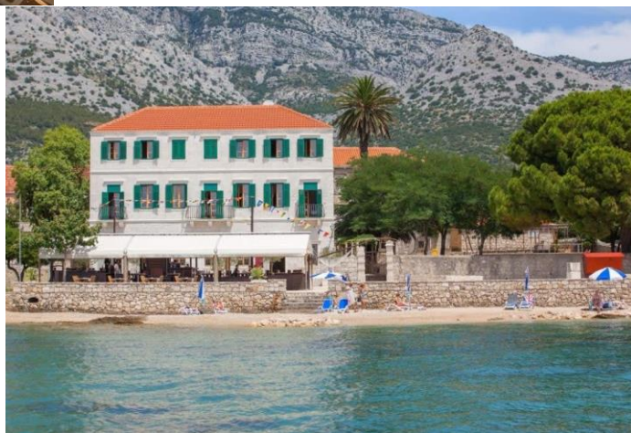
Slika 10. Hotel Adriatic