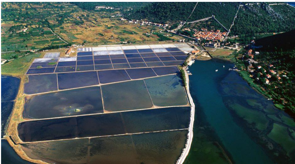
Slika 8. Najstarija solana u Europi-Ston

Pelješac, također, obilježava i najstarija solana u Europi kao i najstarija aktivna solana na svijetu. Njena površina je 450 000 metara kvadratnih. Tradicija branja soli se prenosi već 4 tisuće godina, a sve do danas se sol u njoj proizvodi na isti uz pomoć mora, sunca i vjetra. U solani je 58 bazena koji su podijeljeni u pet skupina jer cijeli proces treba proći pet faza, a traje jedan do dva mjeseca, ovisno o vremenu. 49