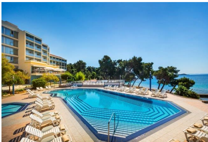
Slika 9. Aminess Grand Azur Hotel

Naime, od ukupno raspoložive 5.946 smještajne jedinice (sobe), njih 3.834 odnosi se na sobe odmarališta i sličnih objekata. Kamp jedinice su u strukturi smještajne ponude Pelješca zastupljene s ukupno 1.722 smještajnih jedinica, dok hotela i sličnih smještaja ima najmanje, samo 390. Zasigurno najisplativiji oblik smještaja su odmarališta, te slični objekti kao apartmani za kraći odmor, te su najpristupačniji korisnicima stoga ih i ima u najvećem broju. Također, kao što je već prije navedeno, zbog prepoznatljivosti, ali i broja stanovnika i naseljenosti najveći broj smještajnih jedinica nalazi se u općini Orebić, dok najmanji broj smještajnih jedinica broji općina Janjina. 50