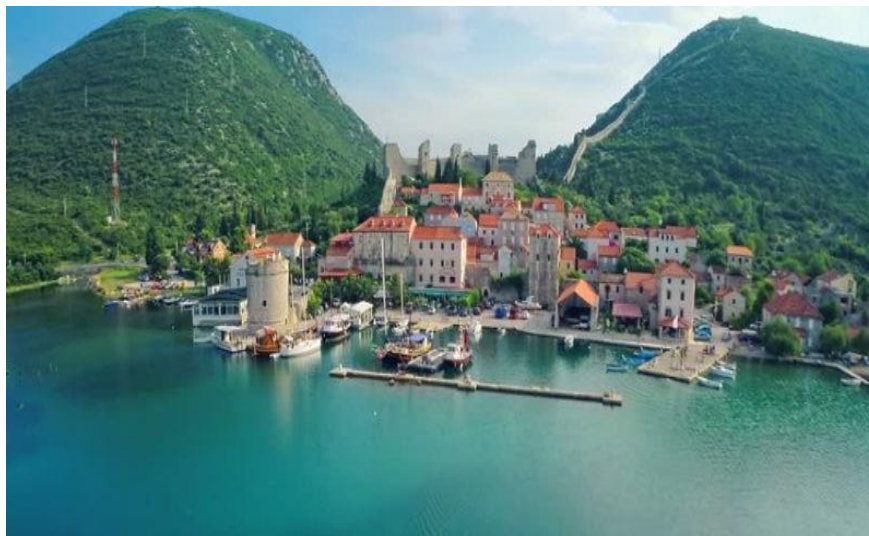
Slika 5. Panoramski pogled na Ston u zaljevu

U 14.st. također je nastao i Mali Ston koji je predložen u listu svjetske kulturne baštine UNESCO-a. Uz brojne kupališne goste naročito privlači i organizirane skupine izletnika radi razgledavanja zidina i gastronomskih delicija u Malostonskom zaljevu. Kao poznato uzgajalište školjkaša zaljev se smjestio između poluotoka Kleka i Pelješca.