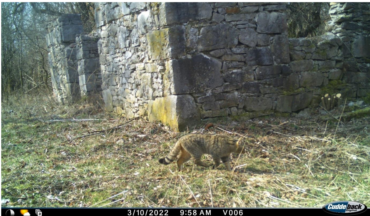
Slika br. 4 Divlja mačka ( Felis silvestris )