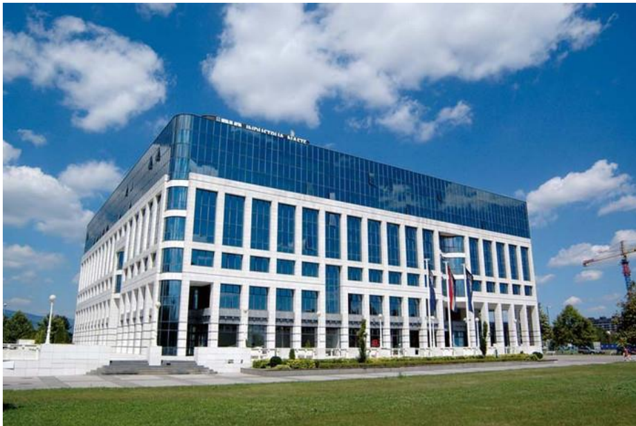
Sl.1.- Sjedište INE u Zagrebu

Današnja INA jedna je od najvećih kompanija u Hrvatskoj s vodećim ulogom u naftnom poslovanju i srednje velika europska naftna kompanija koja ima značajnu ulogu u regiji u istraživanju i proizvodnji nafte i plina, preradi nafte te distribuciji nafte i naftnih derivata. U sustavu INA Grupe su CROSCO, STSI, Maziva, Hostin, TRS i Osijek Petrol, kao i neke kompanije koje posluju u inozemstvu. Iako je u posljednje vrijeme bila suočena s izazovnim tržišnim uvjetima, Inino poslovanje ostalo je stabilno. Nastavljene su značajne investicije koje omogućavaju očuvanje konkurentnosti, prate se svjetski tehnološki trendovi i postavljaju visoki ciljevi kako bi se dodatno podigla ljestvica izvrsnosti.[3]