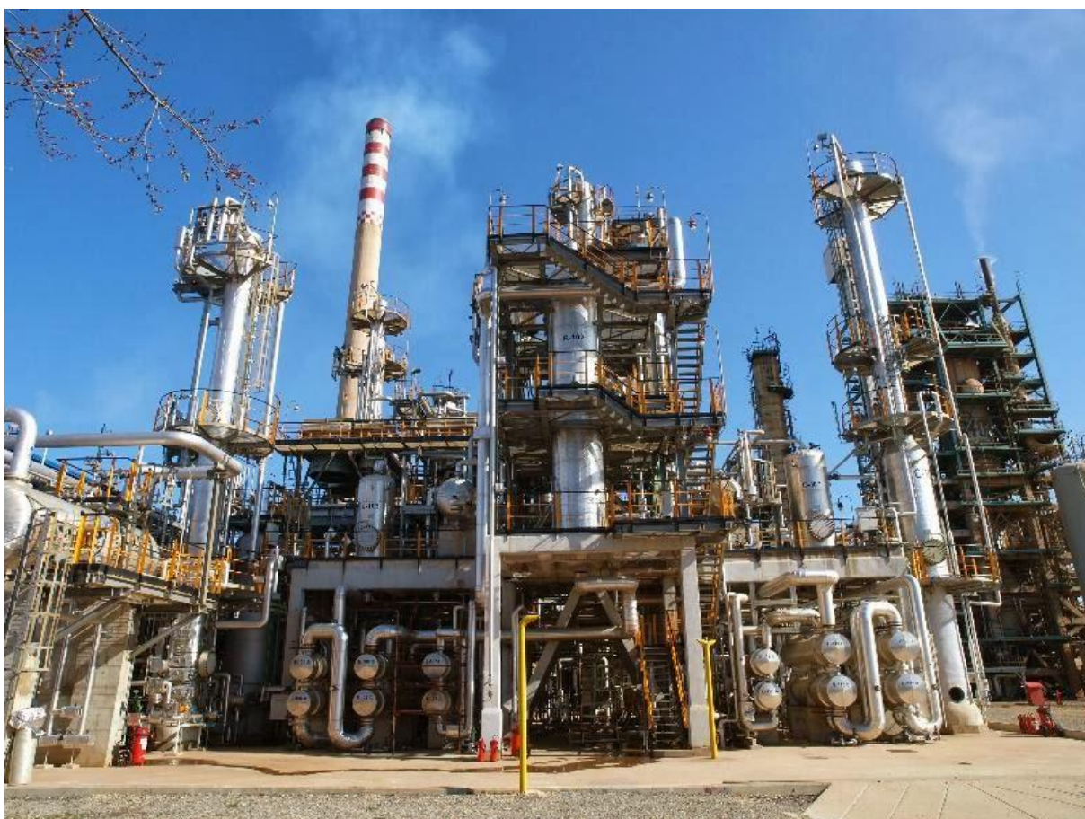
Sl.5- Postrojenje na Bilogori