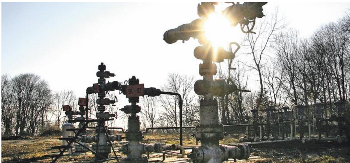
Sl.4- Bušotinski grm na Bilogori