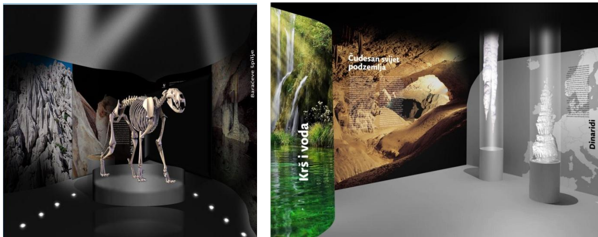
Slika 3. Izgled interijera s pojedinim tematskim područjima