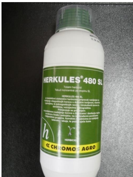
Slika 6. Izgled ambalaže herbicida Herkules 480 SL