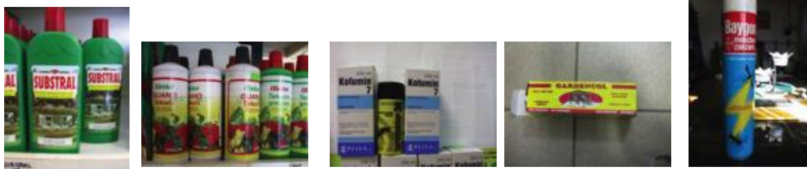
Slika 12. Razne vrste pakiranja pesticida