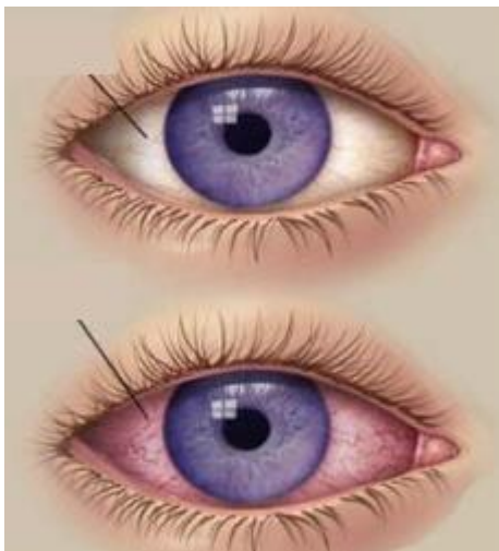
Slika 16. Posljedica ne korištenja zaštitnog sredstva za oči

Ulja su npr. dobra da se aktivna tvar zalijepi za biljku, praškasta inertna sredstva se koriste za raspršivanje po zemlji i/ili biljkama. Inertne komponente ponekad mogu uzrokovati akutne efekte kod ljudi tako npr. petroleum koji se koristi kod tekućih pesticida, a može uzrokovati iritaciju očiju, grla i nosa, te rijetko i slučajevne kemijski inducirane upale pluća. Kod praškastih pesticida inertne komponente su najčešće talk, glina ili mljeveni biljni materijali kao npr. klipovi kukuruza koji mogu izazvati različite alergijske reakcije.