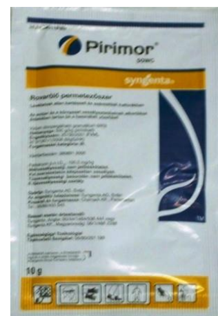
Slika 2. Pakiranje Pirimor 50 WG sredstva