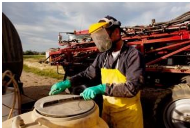
Slika 19. Štitnik za lice

Potreba za korištenjem osobne zaštitne opreme i njihov odabir ovisit će prije svega o uputama na etiketi i/ili popratnom listu svakog pojedinog sredstva za zaštitu bilja. Ako na uputama nije posebno naveden materijal od kojeg je osobna zaštitna oprema izrađena potrebno je zatražiti Sigurnosno-tehnički list za sredstvo za zaštitu bilja i postupati prema uputama ili tražiti informacije od proizvođača sredstva za zaštitu bilja ili osobne zaštitne opreme, zastupnika proizvođača ili distributera.