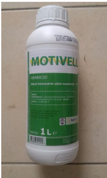
Slika 8. Izgled ambalaže Motivella

ambrozija, loboda, šćir, veliki dvornik, divlja zob, kužnjak, mišjakinja, broćika) u kukuruzu u količini 1 – 1,25 l/ha (100 – 125 ml na 1.000 m 2 ).