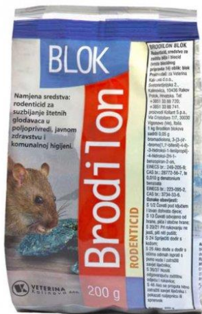
Slika 10. Izgled pakiranja Brodilon blokova