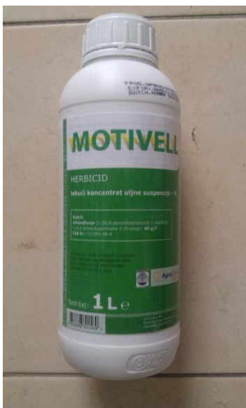
Slika 8. Izgled ambalaže Motivella

ambrozija, loboda, šćir, veliki dvornik, divlja zob, kužnjak, mišjakinja, broćika) u kukuruzu u količini 1 – 1,25 l/ha (100 – 125 ml na 1.000 m 2 ).