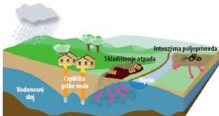
Slika 14. Prikaz ulaska otrova u pitku vodu

Ne smije se ubacivati prazna ambalaža u okoliš, jer se time čini višestruka šteta okolišu i ljudima.