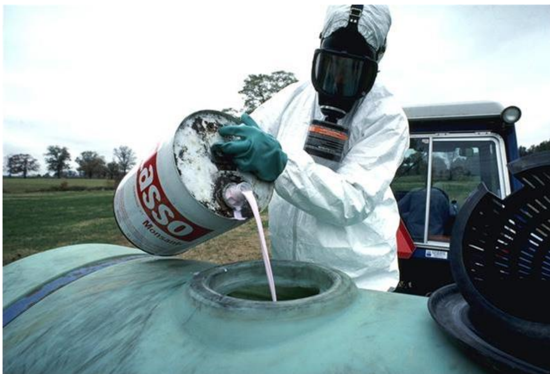
Slika 20. Pripravak smjese špriciva za špricanje zrakoplovom

Osobna zaštitna oprema za zaštitu dišnih organa mora se koristiti sukladno oznakama upozorenja i obavijesti na etiketi i popratnom listu svakog pojedinog sredstva za zaštitu bilja. Uporaba maske ili polumaske obvezna je ako se na etiketi sredstva za zaštitu bilja navodi oznaka upozorenja R 20 (H 332) ili R 23 (H 331) (opasno/otrovno ako se udiše) ili R 37 (H 335) (nadražuje dišne putove) ili odgovarajuće oznake obavijesti (na primjer S 39 ili SPo) kojima se nalaže zaštita dišnih putova. Preporučuje se također kod rada ili ulaska u zaštićene prostore (staklenike, plastenike) nakon tretiranja kao i kod rukovanja tretiranim sjemenom. Najčešće se na etiketi sredstva za zaštitu bilja određuje uporaba jednokratne filtarske polumaske (ili tzv. respiratora) za zaštitu od čestica koja pokriva nos i usta i označava se kraticom FF (HRN EN 149), a najčešći preporučeni filtar je filtar za zaštitu od čestica. Ovisno o djelotvornosti koriste se filtri s niskom (P1), srednjom (P2) i visokom sposobnosti hvatanja čestica (P3).