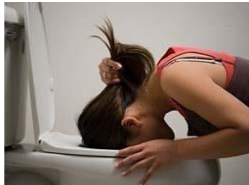
Slika 15. Trovanje malim količinama pesticidima

Pesticidi se sastoje od aktivne i inertne komponente. Aktivna komponenta je ona tvar koja djeluje određenim mehanizmom na ciljane biološku vrstu (biljke, insekti, glodavci i sl.), a inertna tvar je ona koja aktivnu tvar prenosi. Inertne tvari su tekućine, ulja ili različiti prahovi.