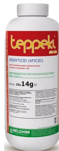
Slika 3. Pakiranje pesticida Teppeki 500 WG

Poseban naglasak treba staviti na njegove toksikološke i ekotoksikološke karakteristike. Naime TEPPEKI 500 WG ne predstavlja opasnost za korisnike, za podzemne vode, ne predstavlja rizik za vodene organizme, pčele, ptice, ribe niti populacije prirodnih neprijatelja lisnih uši. Zbog navedenog se odlično uklapa u programe integrirane zaštite bilja u zemljama EU.