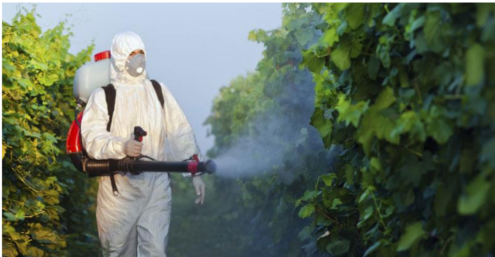
Slika 17. Minimalna zaštita potrebna pri špricanju

Uporaba osobne zaštitne opreme je jedna od osnovnih mjera za smanjenje rizika pri radu sa sredstvima za zaštitu bilja koja primjeniteljima i poljoprivrednim radnicima omogućuje siguran rad. Pri rukovanju sa sredstvima za zaštitu bilja može se koristiti sljedeća osobna zaštitna oprema: zaštitna odjeća, zaštitna pregača, zaštitna kapa ili kapuljača, zaštitne