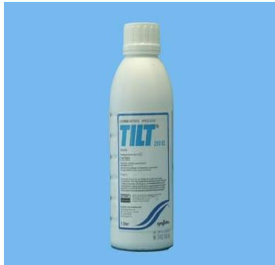
Slika 5. Tilt 250 SC

U pšenici i ječmu koristi se najviše dva puta godišnje, a u vinovoj lozi najviše tri puta godišnje.