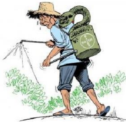
Slika 13. Prikaz kako se ne smije raditi

- Rad s pesticidima je opasan, osobito ako se korisnik ne pridržava mjera osobne zaštite, te se, rukujući njima, može i otrovati. Treba znati znakove (simptome) otrovanja napisane na uputama. Ako se primijete takvi znakovi, ne smije se oklijevati. Tada je najbolje odmah prekinuti posao, jer zdravlje je važnije od prinosa na imanju. Hitno treba obaviti nužno pranje onečišćenih dijelova tijela ili zatražiti nečiju pomoć. Presvući se i potražiti pomoć liječnika, noseći sa sobom uputu priloženu uz jedinično pakiranje otrova ili spremnik pesticida.