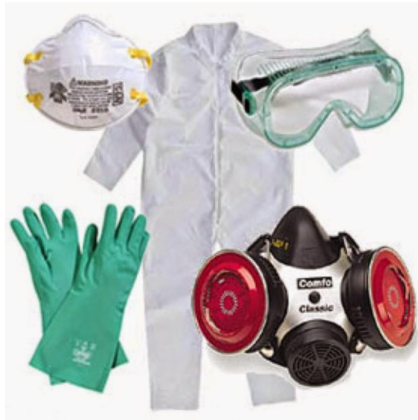
Slika 18. Nužna OZS pri uporabi pesticida

rukavice, zaštitna obuća, štitnici za lice, zaštitne naočale koje dobro pristanjaju i zaštitna filtarska maska ili polumaska te u posebnim radnim uvjetima i samostalni uređaj za disanje.