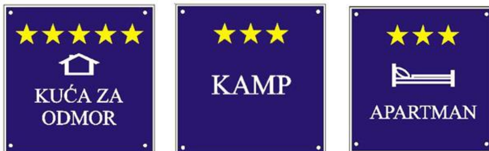
Slika 1. Primjer ploča sa oznakom vrste i kategorije objekta