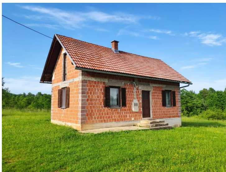
Slika 4. Kuća za odmor "Viva Rastoke"

Kuća uzeta kao konkretan primjer u pisanju ovog rada je postojeći objekt na kojemu je potrebna adaptacija i prilagodba uvjetima Pravilnika o razvrstavanju i kategorizaciji objekata u kojima se pružaju ugostiteljske usluge u domaćinstvu (slika 2).