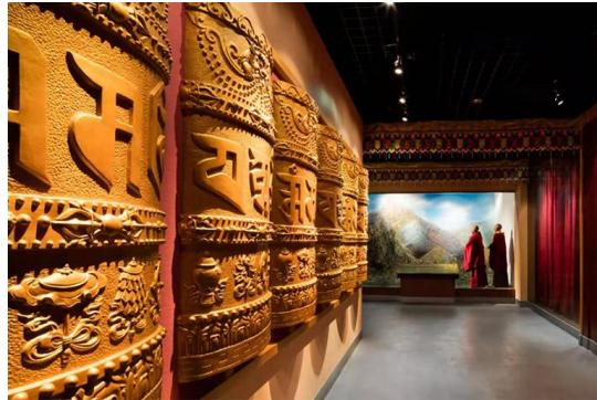
Slika 20. Muzej tibetanske medicine i tibetanske kulture

China Discovery, https://www.chinadiscovery.com/qinghai-tours/things-to-do-in-qinghai.html , (20.07.2023.)