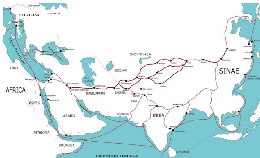
Slika 1. Stari Put svile