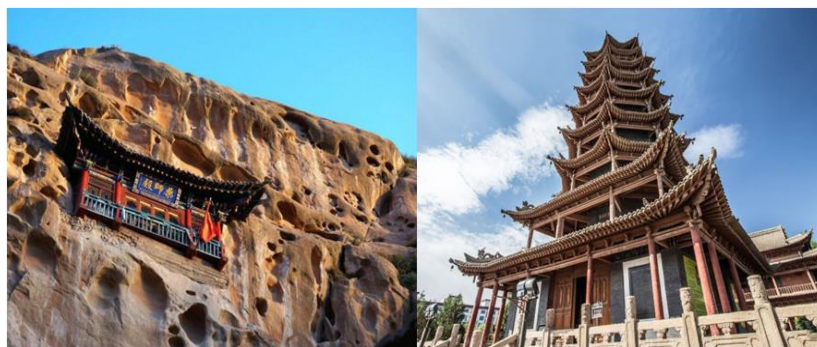
Slika 9. Hram Mati i Muta

Smješten 60 kilometara jugozapadno od Zhangyea, u podnožju slikovite planine Qilian, hram Mati pripada autonomnoj županiji Sunan Yugu. Ime je dobio po mitu prema kojem se vjeruje da se u njemu nalazi trag kopita nebeskog konja. Mati hram poznat je po jedinstvenim pećinama, a reprezentativna je "Trideset i tri sloja nebesa". Različite špilje su razbacane, uglavnom u stilu tibetanskog budizma. Udaljen 500 m od hrama Dafo, hram Muta nalazi se u južnoj ulici okruga Zhangye, jedina preostala pagoda u Zhangyeu. Pagoda je visoka 32,8 metara, ima osam stranica i devet razina. Svaka razina ima drvenu skulpturu zmaja na oktogonu, s draguljima u ustima i zvončićima koji vise ispod. U cijeloj kuli nema čavla ni zakovice. Kad se uđe u pagodu, može se imati panoramski pogled na grad Zhangye. Osim toga, trg ispod pagode također je popularno mjesto za građane, gdje se može u potpunosti osjetiti gradska kultura i život građana Zhangyea. 45