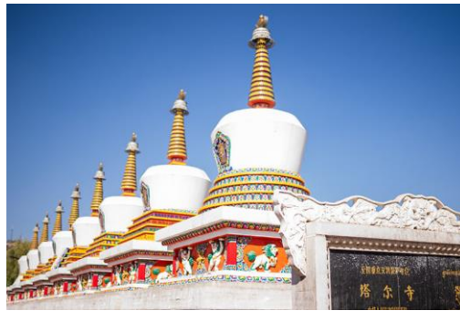
Slika 15. Samostan Kumbum