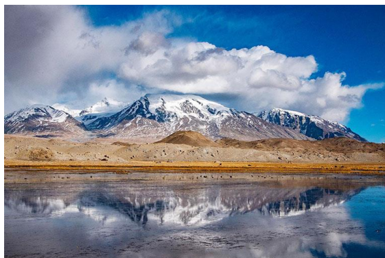
Slika 11. Jezero Karakul