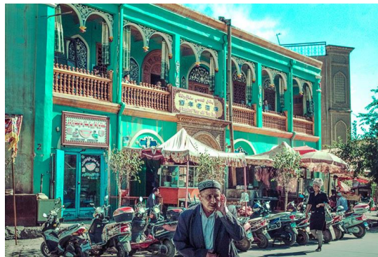
Slika 13. Kashgar Century-old Teahouse