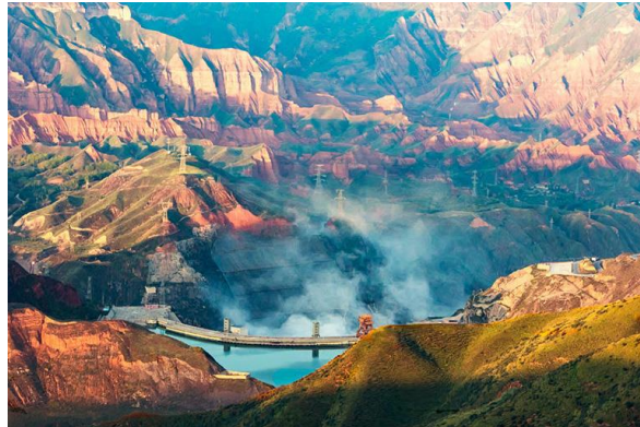
Slika 19. Nacionalni šumski park Kanbula