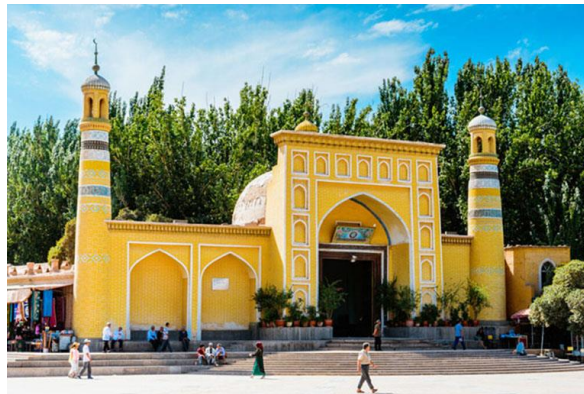
Slika 12. Džamija Id Kah