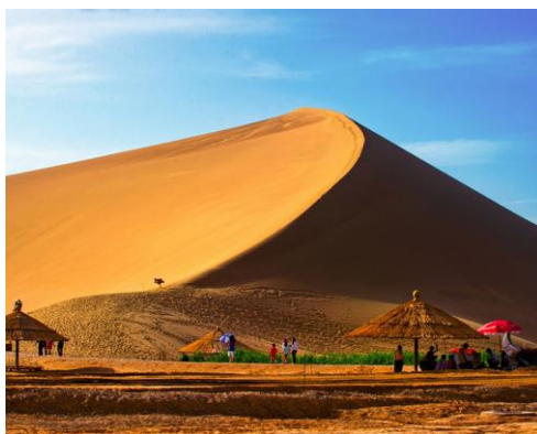
Slika 5. Echoing Sand Mountains