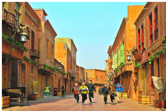
Slika 10. Stari grad Kašgara