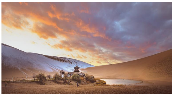
Slika 4. Crescent Lake