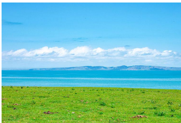
Slika 14. Jezero Qinghai