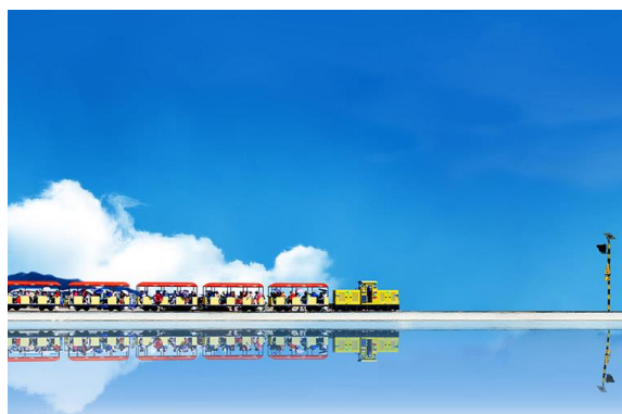
Slika 17. Slano jezero Chaka