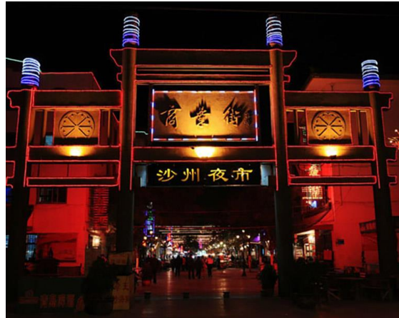
Slika 6. Shazhou Night Market