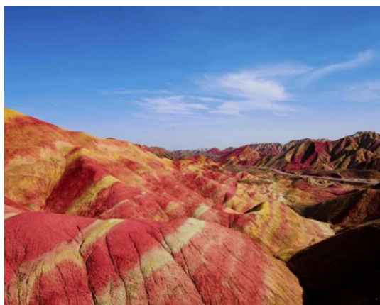
Slika 7. Nacionalni geopark Zhangye

Binggou je drugo područje koje se nalazi na rijeci Liyuan. Iako je manje posjećen, nudi dodatne poglede na nevjerojatne krajolike. Treće područje je poznato kao Sunan Danxia Scenic Area. Formacije stijena i valovita brda gotovo izgledaju kao da su naslikani. Krajolici su nadrealni. Bilo bi pošteno reći da je nacionalni geopark Zhangye najšareniji nacionalni park na svijetu. Park ima niz šetnica koje posjetiteljima omogućuju vijuganje oko šarenih krajolika pješčenjaka. Šetnice su ravne i čine ih dostupnim osobama u invalidskim kolicima i drugim putnicima s fizičkim poteškoćama kako bi ipak doživjeli sjaj. 41