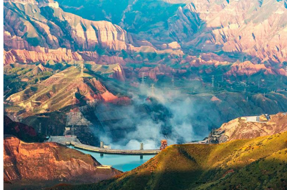
Slika 19. Nacionalni šumski park Kanbula