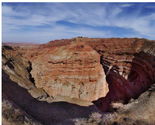
Slika 8. Veliki kanjon Pingshanhu

Slikovito područje Velikog kanjona jezera Pingshan udaljeno je oko 57 kilometara od gradskog područja Zhangye, gdje je stijena neobičnog oblika. Možete pronaći "ljude, ptice, životinje i pagode". Poznati geološki stručnjaci i turisti u zemlji i inozemstvu pohvalili su ga kao "usporedivog s Grand Canyonom u Coloradu" i novo je otkriće Puta svile. 43