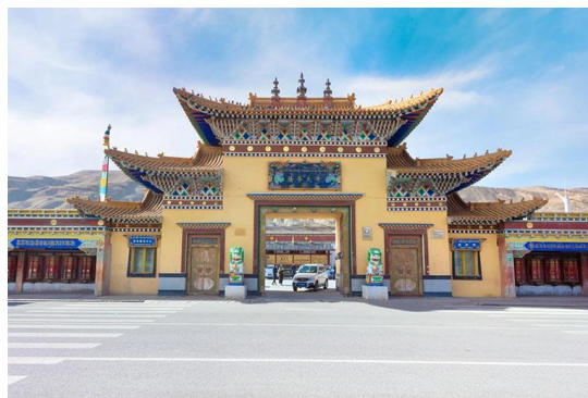
Slika 18. Samostan Rongwo