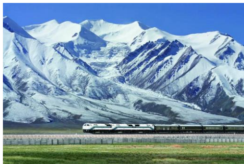
Slika 16. Qinghai Tibetska željeznica