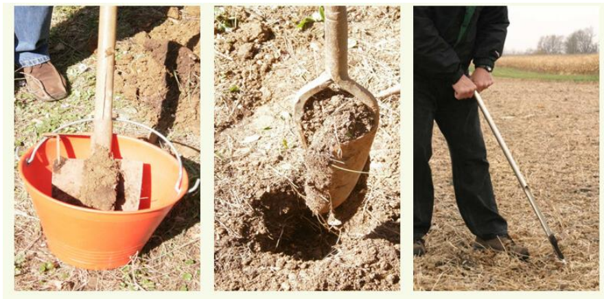
Slika 3: Načini uzimanja uzoraka tla pomoću sondi ili štijače