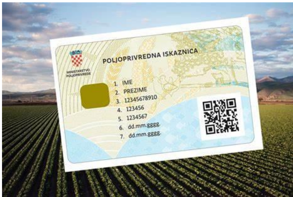
Slika 1: Poljoprivredna iskaznica