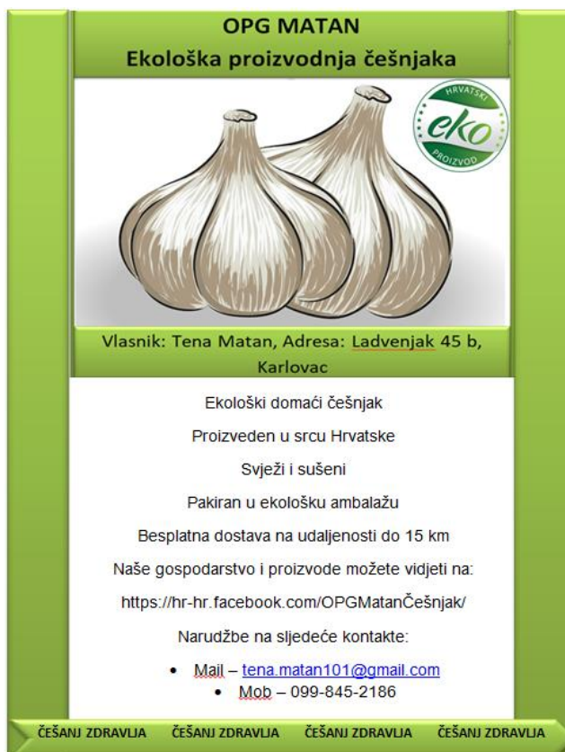
Slika 10: Promotivni letak