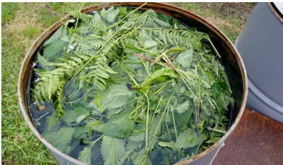
Slika 8: Spravljanje ekološkog zaštitnog sredstva