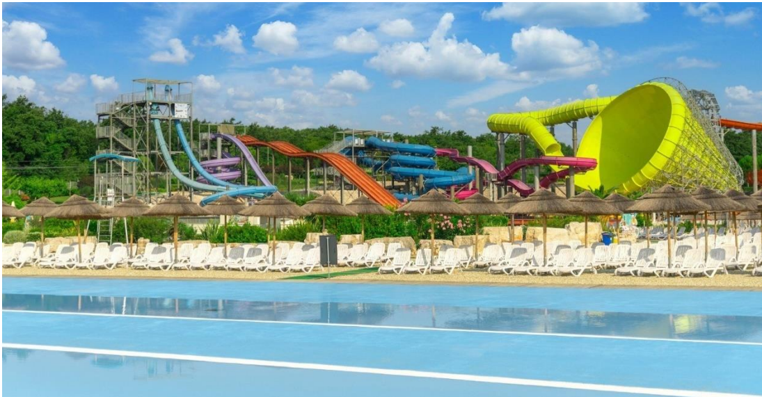
Slika 9. Pogled na tobogane vodenog parka Aquacolors