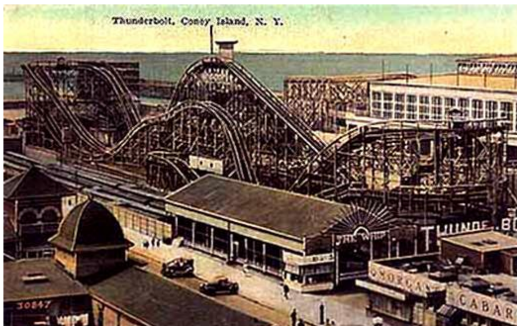
Slika 3. Prvi vlak smrti, Coney Island 1884.