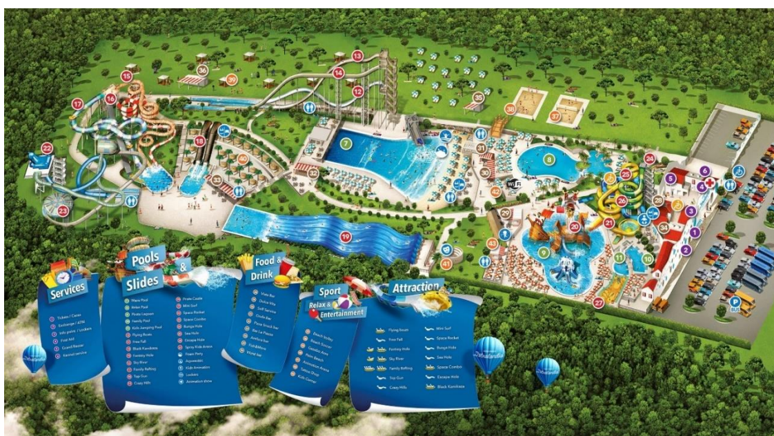
Slika 8. Mapa Istralandije