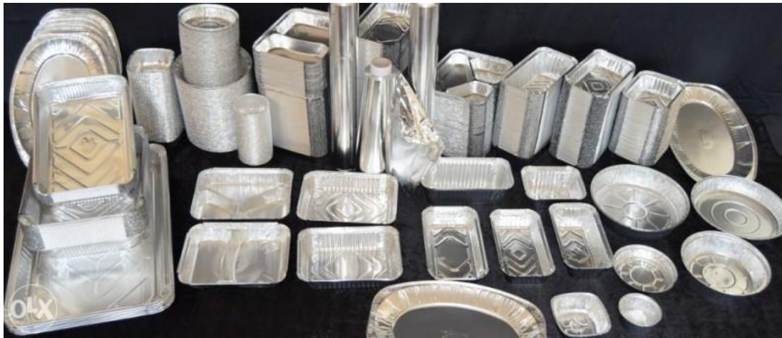
Slika 1. Aluminijska ambalaža, ( https://olx.ba/artikal/36438454/ambalaza-aluminijske-posude-ovalni/ )

Za aluminij je karakteristično da je mehanički otporan (slabije od čelika), no za pojačanje njegove čvrstoće dodaju se magnezij i mangan. Jednostavan je za oblikovanje, savitljiv i rastezljiv. Osim toga, ne propušta vodu, masnoće, svjetlost, plinove i mirise (Muhamedbegović i sur., 2015), zbog čega se vrlo često koristi za pakiranje aromatičnih i higroskopskih proizvoda koji ne smiju doći u interakciju s okolinom, i fiziološki je ne štetan (Halambek i sur., 2016). Vrlo je otporan na koroziju, što je jedan od razloga za njegovo korištenje za proizvodnju limenki i folija. Aluminij bez primjesa, tj. čisti aluminij najčešće se upotrebljava za pakiranje bezalkoholnih pića, morske hrane i hrane za kućne ljubimce. Njegove mane su skupoća, odnosno visoka cijena te nije pogodan za varenje (Marsh i Bugusu, 2007). Također se za korištenje pakiranja hrane koristi tanka folija, dok se deblja koristi kao podmetač. Sama aluminijska folija se ne koristi učestalo međutim, ako se oplemeni s drugim folijama, nailazi na veću primjenu u prehrambenom sektoru kao ambalaža za mliječne proizvode, kavu, začine i sl. (Muhamedbegović i sur., 2015).