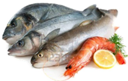
Slika 5. Akvatični organizmi ( https://www.hah.hr/doneseno-znanstveno-misljenje-hrvatske-agencije-za-hranu-o-prisutnosti-zive-olova-kadmija-i-arsena-u-akvaticnim-organizmima-na-trzistu-republike-hrvatske/ )

Dakle, najčešći metali i legure koji se koriste u kontaktu s hranom su: aluminij, antimon, krom, kobalt, željezo, mangan, cink, itd., a neki od njih će biti obrađeni u daljnjem radu.