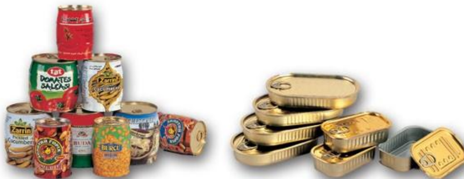
Slika 3. Ambalaža povrća i ribljih prerađevina ( https://www.ebaza.rs/firma-detaljnjie-slike.php?ID=3348 )

Pri odabiru vrste metalnih, ali i drugih, ambalažnih materijala potrebno je ispuniti određene zdravstvene uvjete, kako bi se prisustvo štetnih supstanci svela na minimum. Dakle, jedan od osnovnih uvjeta za odabir ambalaže jest zdravstvena ispravnost. Osim prethodno navedenih, mehaničkih i kemijskih svojstava, s ekološkog aspekta, potrebno je ispuniti određene zahtjeve koji se odnose na izradu i sastav ambalaže te sposobnost reciklaže ambalažnih materijala. Vezano za meso i mesne prerađevine, zadatak ambalaže je sačuvati boju mesa, onemogućiti rast bakterija te spriječiti nepoželjne kemijske reakcije. Mesne prerađevine poput narezaka, pašteta i gotovih jela pakiraju se u aluminijske konzerve. Zbog svoje postojanosti, odnosno konzistencije, paštete se pakiraju i u metalne tube. Osim mesnih prerađevina, često se u aluminijske konzerve (koje moraju biti nepropusne na kisik, svjetlost i paru, te dobre toplinske izolacije), pakuju i riblji proizvodi (sardine, skuše, tuna i sl.) (Juul i Hemmer, 2002).