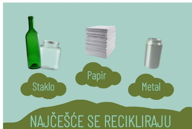
Slika 8. Materijali koji se najčešće recikliraju

Održivi materijali predstavlja materijal koji nastaje na temelju ekološkog i društveno odgovornog postupka ili materijala koji je recikliran, a kojim se smanjuje negativan utjecaj na okoliš. Što se tiče metalne ambalaže, one imaju za prednost slijedeće faktore: lako oblikovanje, dobrih je mehaničkih svojstava, nema potrebu za korištenjem više aditiva u procesu proizvodnje i interakciji s hranom, mogućnost hermetičkog zatvaranja, otpornost na temperaturu, nepropusnost itd. Osim toga, zbog mogućnosti višestrukog recikliranja metalna ambalaža se smatra ekološki prihvatljivom u sustavu pakiranja hrane (Simić, 2013). Pozitivnog je utjecaja na zdravstvenu ispravnost, što je od iznimne važnosti u prehrambenom sektoru, odnosno prehrambenoj industriji.