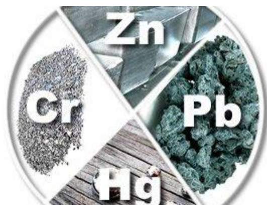
Slika 7. Prikaz teških metala ( https://hr-m.iliveok.com/health )

Teški metali ne posjeduju nikakvu nutritivnu vrijednost i nepovoljno utječu na ljudsko zdravlje. Teški metali koji se mogu pojaviti u materijalima i predmetima koji su u kontaktu s hranom su: Kadmij (Cd), Živa (Hg), Aluminij (Al), Olovo (Pb) i Arsen (As).