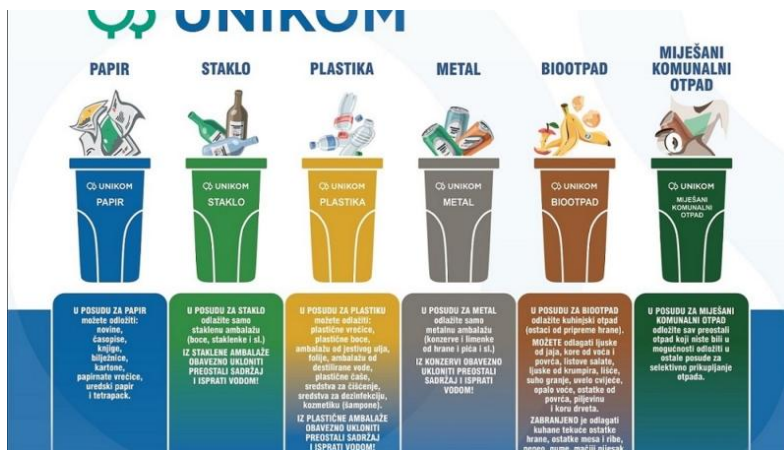
Slika 9. Odvajanje otpada ( https://unikom.hr/novosti/otiskani-vodici-za-pomoc-pri-odvajanju-otpada/ )

Subjekti kojima je vrsta djelatnosti prikupljanje metala za reciklažu imaju obavezu i dužnost pridržavati se zakonskih normi koje se odnose na gospodarenje metalnim otpadom te ispunjavati propisane tehničke uvjete u vezi s prikupljanjem, zbrinjavanjem i recikliranjem metalnog otpada, posjedovati okolišnu dozvolu i sl. u sustavu održivosti i reciklabilnosti najvažniji proces jest razvrstavanje otpada. Na području Republike Hrvatske, metali se u kućanstvima razvrstavaju zajedno s plastikom, no u svakoj obradi otpada, metalni se otpad odvaja uz pomoć magneta (Ficko, 2013).