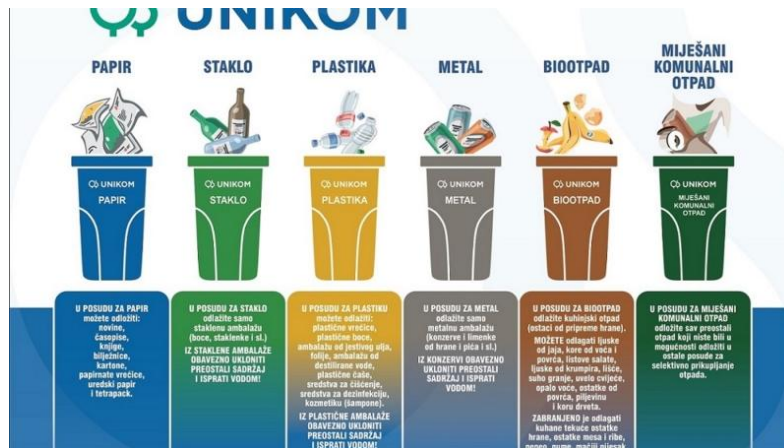
Slika 9. Odvajanje otpada ( https://unikom.hr/novosti/otiskani-vodici-za-pomoc-pri-odvajanju-otpada/ )

Subjekti kojima je vrsta djelatnosti prikupljanje metala za reciklažu imaju obavezu i dužnost pridržavati se zakonskih normi koje se odnose na gospodarenje metalnim otpadom te ispunjavati propisane tehničke uvjete u vezi s prikupljanjem, zbrinjavanjem i recikliranjem metalnog otpada, posjedovati okolišnu dozvolu i sl. u sustavu održivosti i reciklabilnosti najvažniji proces jest razvrstavanje otpada. Na području Republike Hrvatske, metali se u kućanstvima razvrstavaju zajedno s plastikom, no u svakoj obradi otpada, metalni se otpad odvaja uz pomoć magneta (Ficko, 2013).