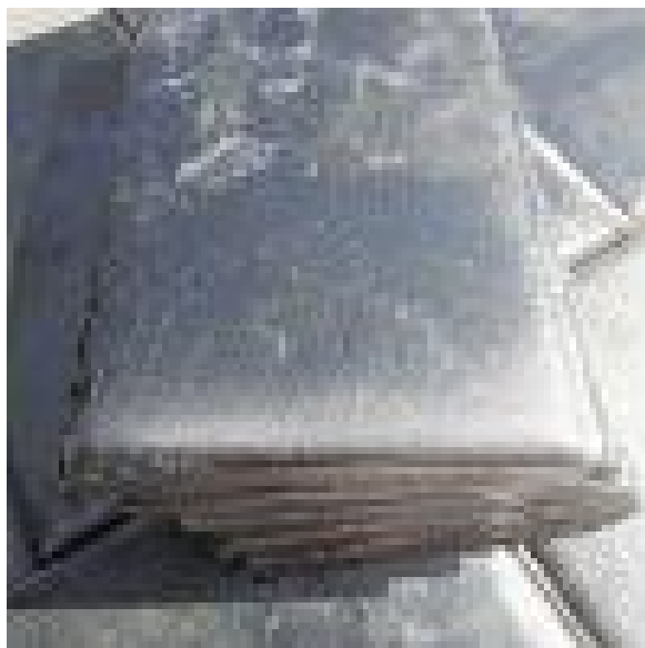
Slika 2. Metalna kositrena anoda ( https://www.widerangemetals.com/hr/limena-metalna-anoda/ )

U Republici Hrvatskoj upotreba kositra propisana je Pravilnikom o zdravstvenoj ispravnosti materijala i predmeta koji dolaze u neposredan dodir s hranom (Narodne novine, br. 125/09,31/11) kojim je određeno da “kositar koji se koristi za izradu bijelog lima mora biti čistoće 99,85% i ne smije sadržavati više od 0,02% olova ili kadmija – pojedinačno ili ukupno – niti više od 0,01% arsena. Osim toga, vanjske i unutarnje površine limenke moraju biti čiste i glatke, s ujednačenom i neprekinutom kositrenom prevlakom, odnosno zaštitnim lakom i ne smiju imati ogrebotine, brazde, mjehuriće, ulegnuća ili bilo kakva druga oštećenja na prevlaci.“