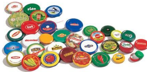
Slika 4. Metalni zatvarači

Voće, povrće te njihove preradevine (sokovi, marmelade i sl.), radi očuvanja njihove stabilnosti potrebno je pakirati u ambalažu koja je nepropusna za kisik. Proizvode je potrebno osigurati od vanjskih utjecaja, pa se u tu svrhu često koriste hermetički zatvorene limenke i materijali od stakla s metalnim zatvaračima (Jašić, 2007).