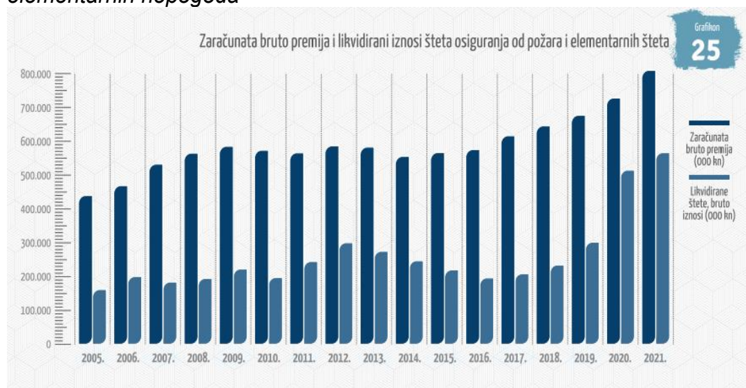
Grafikon 1: Zračunata bruto premija i likvidirani iznosi šteta osiguranja od požara i elementarnih nepogoda